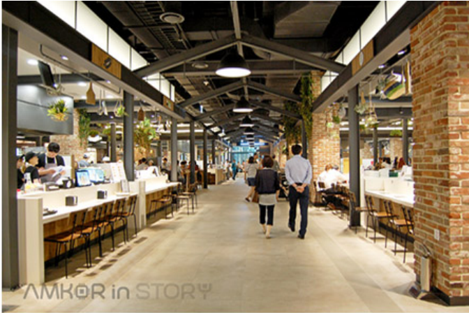
※ 프리미엄 아울렛의 지하 1층 식당. 도심의 수요에 맞추어 식당과 식품관의 접근성을 높였습니다.

본 센터는 2017년 '10월'에 본 센터를 오픈하여 다양한 상품과 서비스를 제공하고 있습니다. 본 센터는 주요(Key Tenant: 주요 업체 및 브랜드)의 입점률도 100% 이상으로 높일 예정이며, 1층부터 지하 1층까지 다양한 상품과 서비스를 제공하는 다양한 공간과 시설을 제공할 예정입니다. 본 센터는 본 센터의 운영을 통해 고객에게 다양한 편의와 혜택을 제공할 예정입니다.