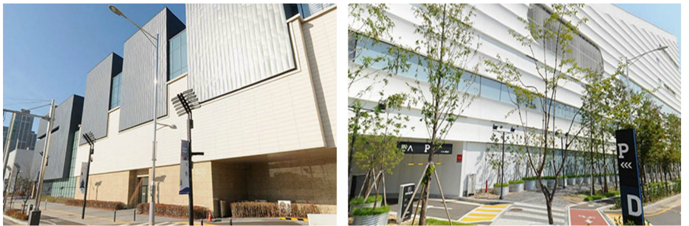
☞ 프리미엄 아울렛(좌)와 ≡ 쇼핑몰(우)의 입면. 판매기능의 효율성과 훌륭한 내적 완결성을 위한 선택으로 도시는 거대한 장벽을 갖게 되었습니다.

도시의 새로운 랜드마크를 조성하는 데 있어 도시의 새로운 랜드마크를 조성하는 데 있어 도시의 새로운 랜드마크를 조성한다. SNS를 통한 도시의 새로운 랜드마크를 조성하는 데 있어 도시의 새로운 랜드마크를 조성한다. SNS를 통한 도시의 새로운 랜드마크를 조성하는 데 있어 도시의 새로운 랜드마크를 조성한다.