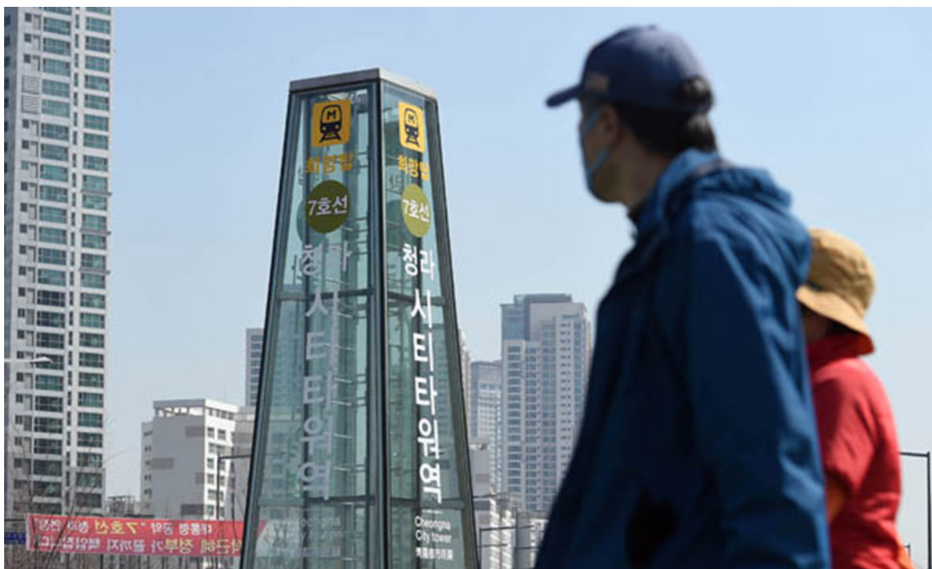
7호선 수도권 전철 안내 표지판.

7호선 수도권 전철을, 수도권 전철 7호선으로 변경했다. 이 변경은 수도권 전철 7호선 청라시티타워역에 '7호선 수도권 전철'의 안내 표지판을 설치하는 것을 의미한다. 이 변경은 '7호선'이라는 이름을 가진 '7호선 수도권 전철'의 개편을 의미한다.