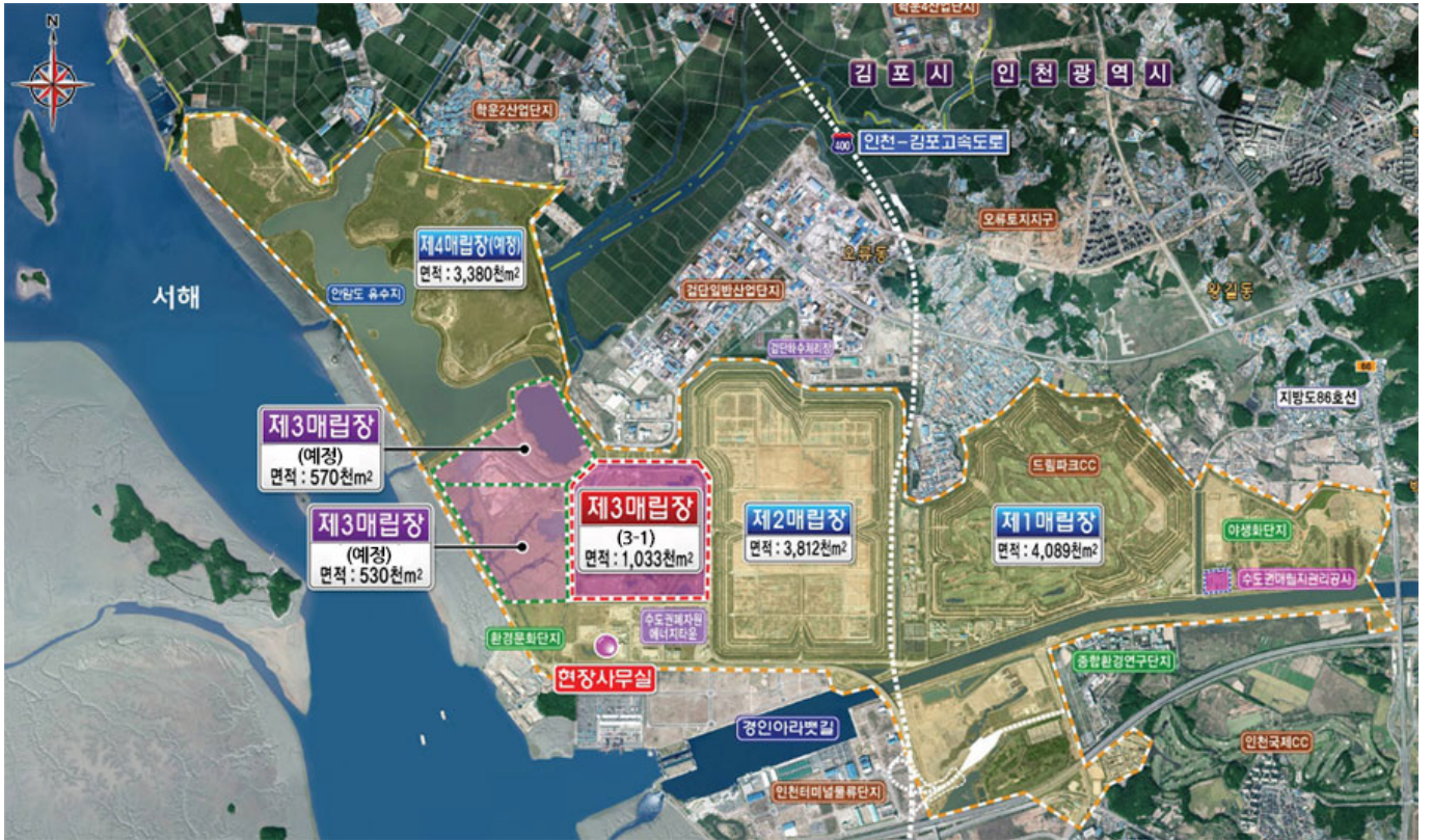
<표 1> 매립지 현황

1992년 매립지 5개소, 2025년 매립지 5개소, 총 10개소, 총 면적 13,874천m².