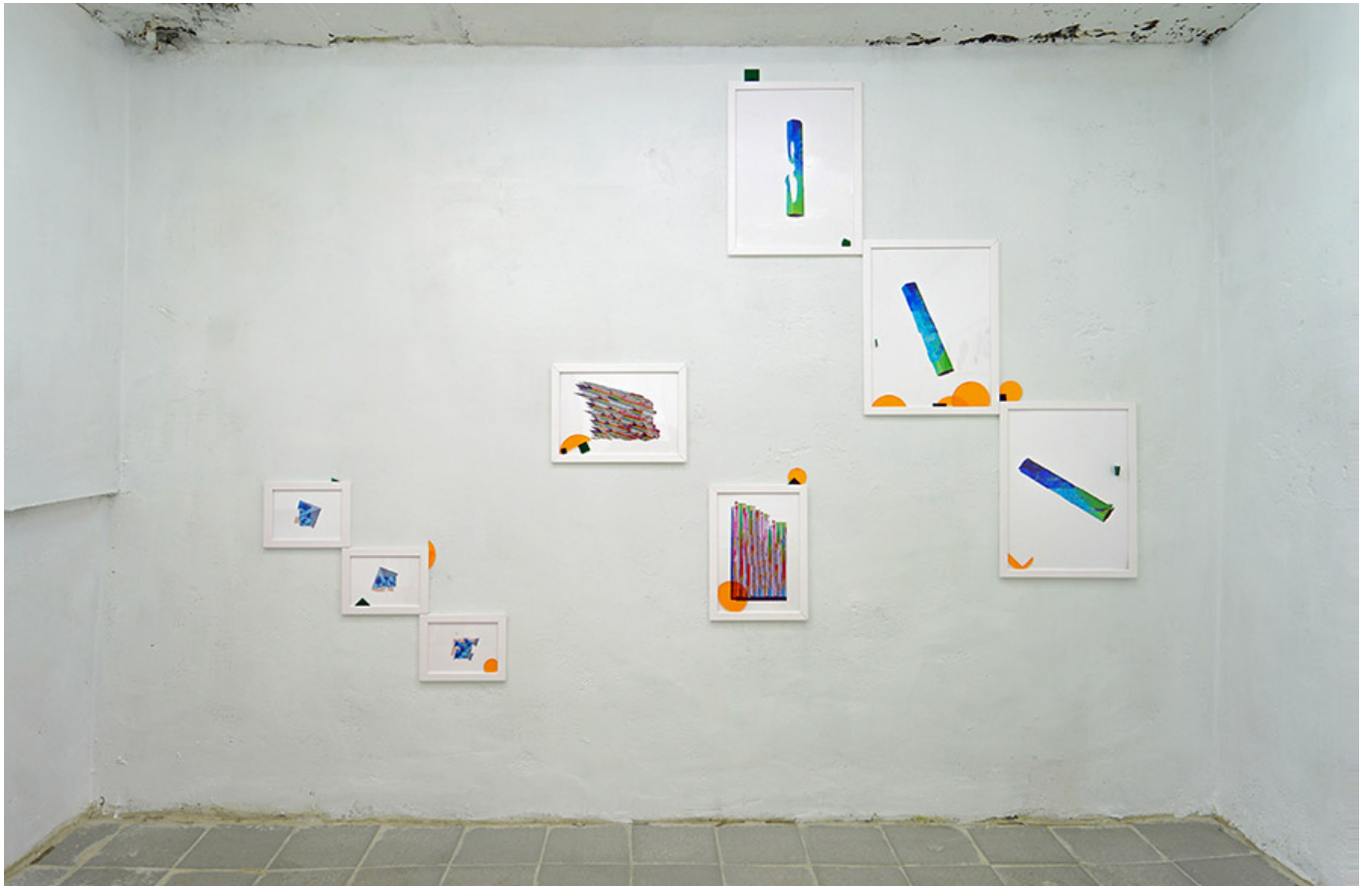
Manufacture: Undo_000 000, 000_0000_2018-19