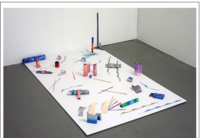
Wallpapers series_000 000_200x120x30cm_2017