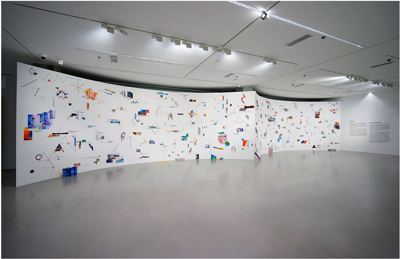
○○○ ○ ○(Mojave Day and Night)_○○○ ○○○ ○ ○○ ○○_3.5×20m_2019