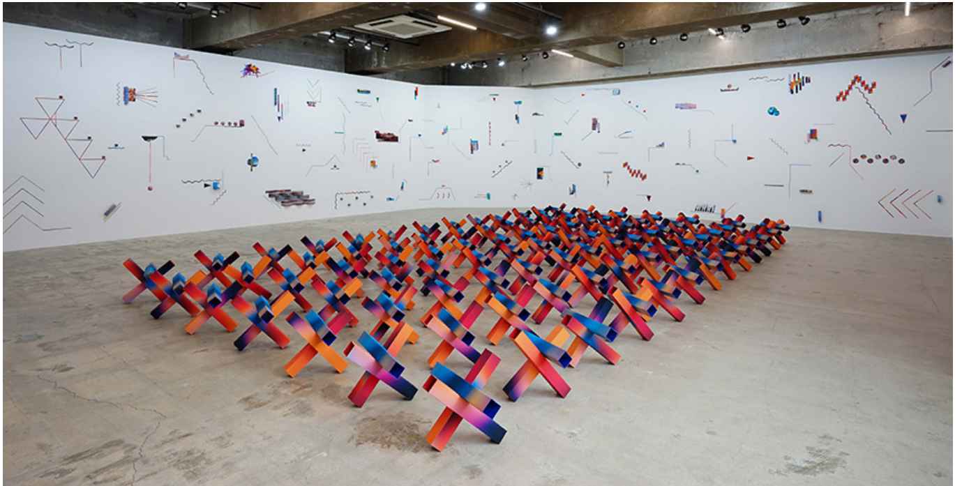
Sierra_000000 000 00, 000 000 000 0 00 00_7×3.9m(00), 2.5×17m(0)_ ,2018