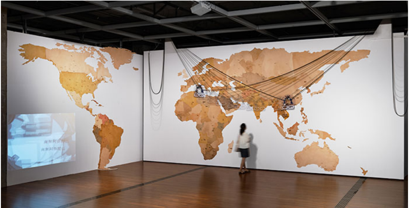
王萌 《The Scorched World》_装置, 2018, 尺寸 0.2m×14m×4m_2018/2019

2013 年 神户 双年展 (Kobe Biennale, 2013)、 2017 年 台北 双年展 (Taipei Biennale, 2017) 以及 2015 年 台北 双年展 (Taipei Biennale, 2015)。