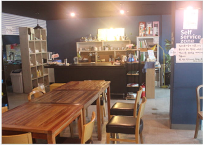
인터뷰 장소 문화바람