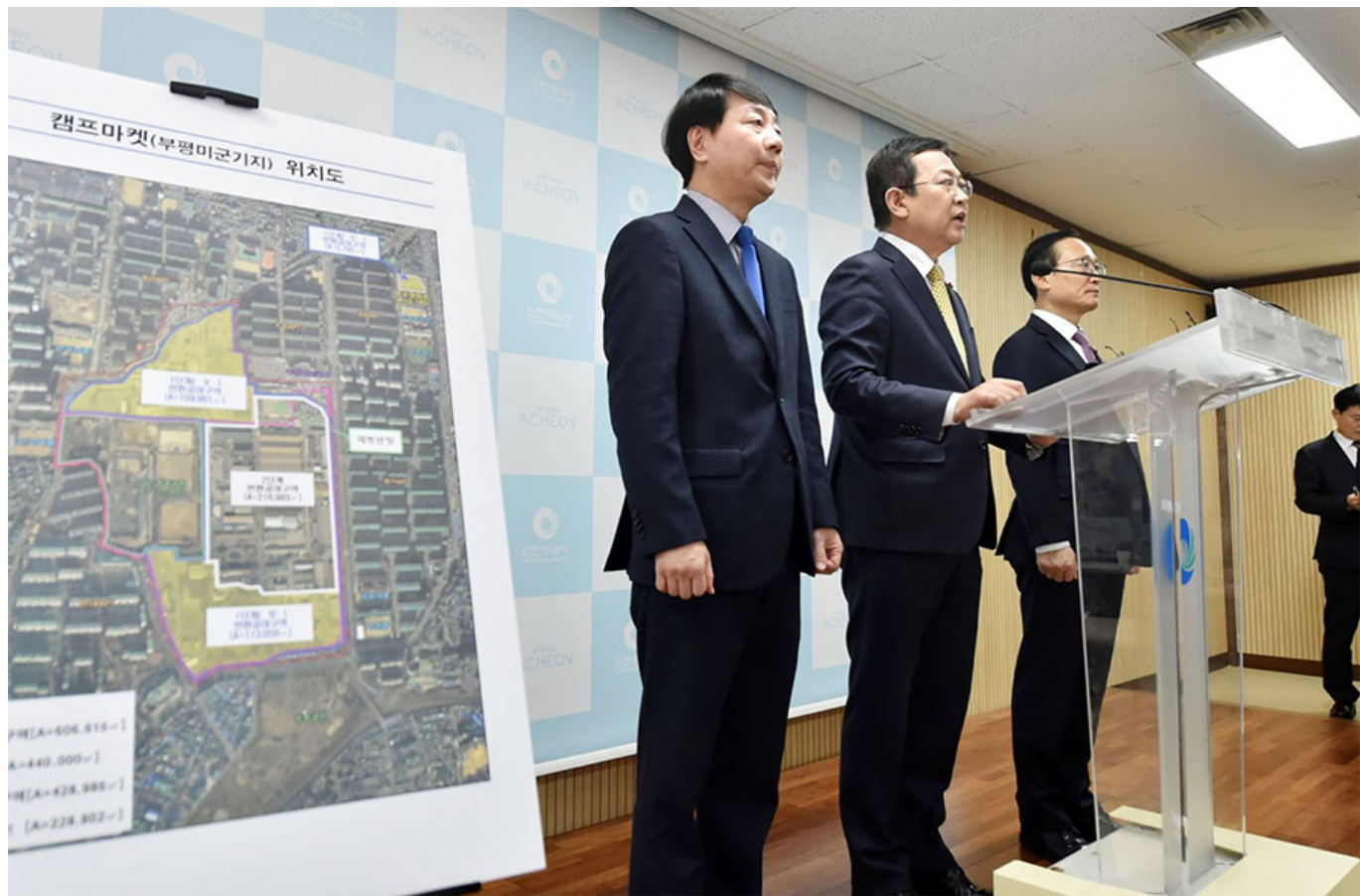
12월 11일 발표된 캠프마켓 위치도 출처: 한국토지주택공사 (www.khwa.com) >

이러한 성과를 바탕으로 '2011년'에 12월 11일 발표되었습니다. 당사는 1990년대 초반부터 '2011년'에 12월 11일 발표되었습니다. 2010년 12월 11일 발표되었습니다. 1990년대 초반부터 '2011년'에 12월 11일 발표되었습니다.