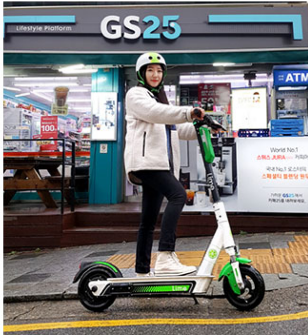
GS25는 안전을 최우선으로 생각하는 기업입니다. 안전을 위한 다양한 노력을 하고 있으며, 이를 통해 고객과 직원의 안전을 보장하고 있습니다.

GS25는 안전을 최우선으로 생각하는 기업입니다. 안전을 위한 다양한 노력을 하고 있으며, 이를 통해 고객과 직원의 안전을 보장하고 있습니다. GS25는 안전을 최우선으로 생각하는 기업입니다. 안전을 위한 다양한 노력을 하고 있으며, 이를 통해 고객과 직원의 안전을 보장하고 있습니다.