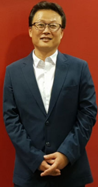
○○○ ○○○ ○○○ : ○○○○

○○○ ○○○○○○○ ○○ ○○○○ ○○○○○ ○○○○ “○○○○○○ ○○ ○○○ ○○○ ○○ ○○○ ○○○○. ○ ○ ○○○○○ ○○○○○ ○○ ○○○ ○○○○ ○○○ ○○ ○○. ○○○○○ ○○○○ ○○ ○○ ○○○ ○○○○ ○○ ○○○ ○○ ○○○ ○ ○ ○ ○○○”○ ○○○○○○○. ○○○○○ ○○○○ ○○ ○○○ ○○ ○○○○ ○○○○ ○○ ○○○ ○○○○ ○○○○○ ○○ ○○○ ○○ ○○○ “K○○○ ○○○○ ○○ ○○○ ○○○○○○ ○○○○ ○○ ○○○ ○○ ○○○ ○○○○ ○○”○ ○○○○○○. ○○○○○ ○○○○ ○○ ○○○○ ○○ ○○○○○○○○○○ ○○○○ ○○○○○○○. “○○○ ○○○○○○○○○○ ○○ ○○○ ○○ ○ ○○○○○○, ○○○○○ ○○○○ ○○, ○○○ ○○○”○ ○○ ○○○○○ “○○○ ○○○○○○ ○○○ ○○○ ○○○○”○ “○○○ ○○ ○○○○○○ ○○○ ○○○○ ○○○ ○○ ○○○ ○○○ ○○○ ○○○○ ○○”○ ○○○○○○.