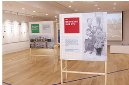
세종병원 35주년 개원 기념 특별기획 전시 <세계로 가는 세종병원의 심장展> 모습

2016년 11월 22일, 세종병원 35주년 개원 기념 특별기획 전시 <세계로 가는 세종병원의 심장展>가 열렸습니다. 이 전시회는 세종병원의 35년 역사를 돌아보고, 세계로 가는 세종병원의 심장展을 소개하는 의미를 지니고 있습니다. 이번 전시회는 세종병원의 35년 역사를 돌아보고, 세계로 가는 세종병원의 심장展을 소개하는 의미를 지니고 있습니다. 이번 전시회는 세종병원의 35년 역사를 돌아보고, 세계로 가는 세종병원의 심장展을 소개하는 의미를 지니고 있습니다.