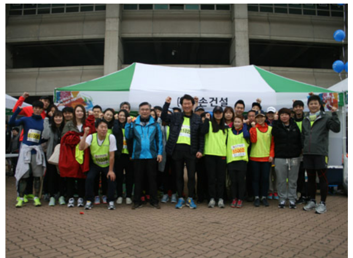
마라톤 대회에서 직원들과 함께