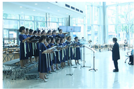
메디플렉스 세종병원 로비음악회

00 00 000 000 00000 0 00000 000 00 00 00000 00 00000 0 000 000000. 00000 00000 000 00 000 000 00 000000. 000000 00 000 00 000, 000 00 0 000 0, 000 00000000 00 000 000 000 00 00 000 0 00 000 00 0 000. 000 000 000 00000 000 00 00 00000, 00 0000000 000000 00 00000 0, 00000 00 00000 00 000000 00000 000 000 00000000 000000 00000 000 000 0 0 000 00 000 000 0 00 000 000000.