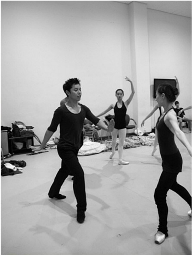
인천시티발레단 연습실