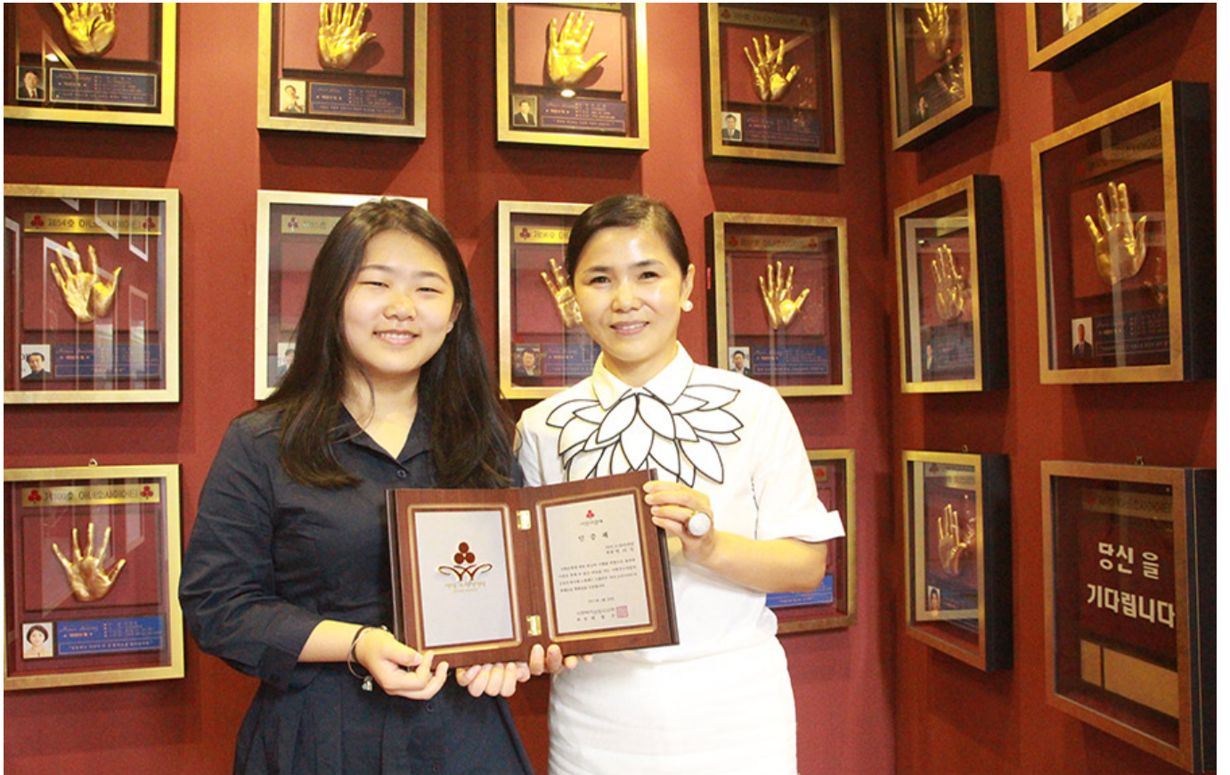
아너소사이어티 가입 (딸과 함께)

A. 이 프로그램은 우리 사회의 다양한 분야에서 활동하고 있는 여성들을 위한 것입니다. 이 프로그램은 여성들이 자신의 역량을 발휘하고, 사회적 책임을 다할 수 있도록 돕는 데 목적이 있습니다. 또한, 여성들이 서로 교류하고 협력할 수 있는 기회를 제공합니다.