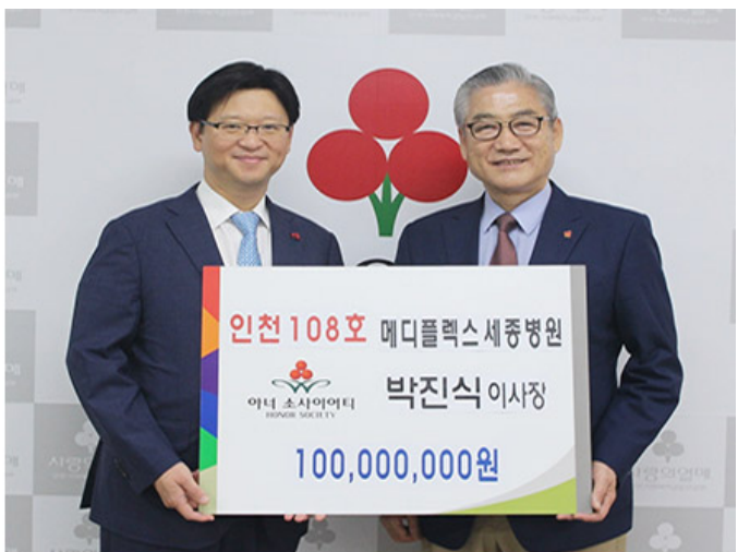
아너 소사이어티 가입식

Q. 수술을 할지 말지 결정하는 데 도움을 주는 것이 중요합니다. 수술을 할지 말지 결정하는 데 도움을 주는 것이 중요합니다.