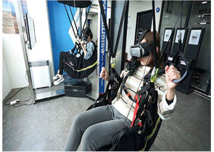
실감콘텐츠체험관 탐(인천 동구 서해대로520번길 12)

Q. 동구강 스틸랜드는 인천 동구 화수로 69번길 17에 위치하고, 실감콘텐츠체험관 탐은 인천 동구 서해대로 520번길 12에 위치하고 있다. 두 시설의 위치를 비교하여 설명하시라.