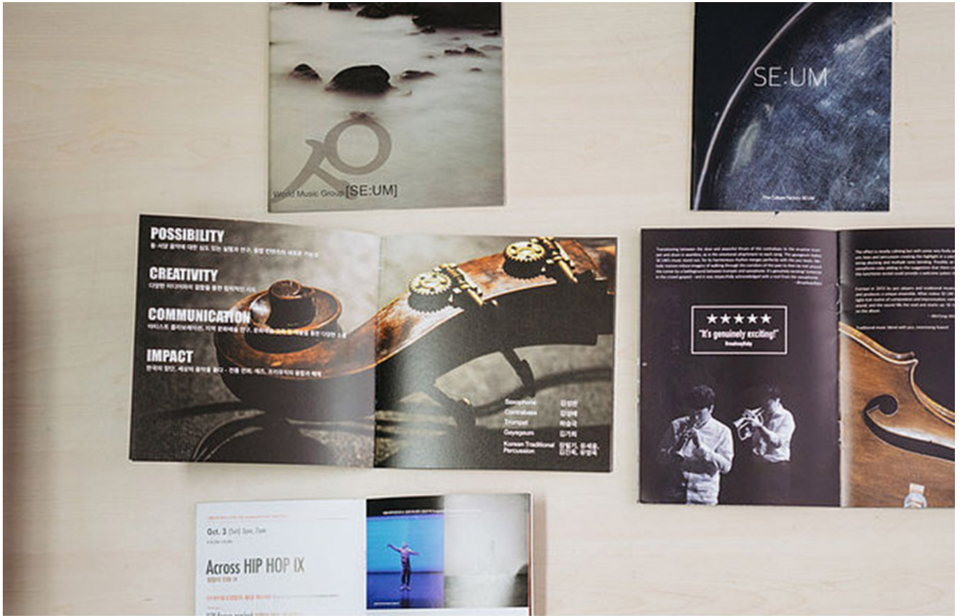
세움 홍보 디자인 작업

Q) 어떤 것 어떤 것 어떤 것 어떤 것 어떤 것 어떤 것. 어떤 것 어떤 것 어떤 것 어떤 것 어떤 것 어떤 것? 어떤 것?