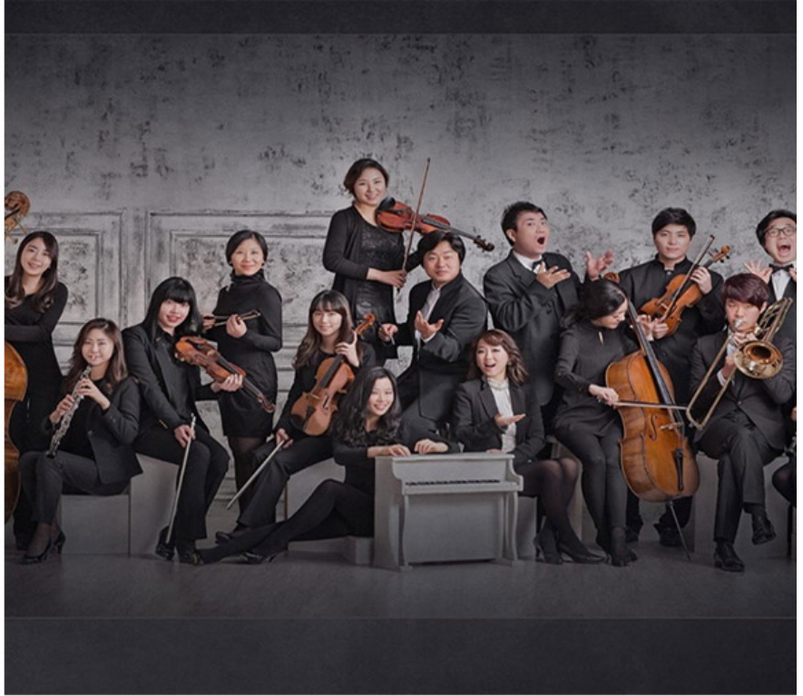
루체 단원