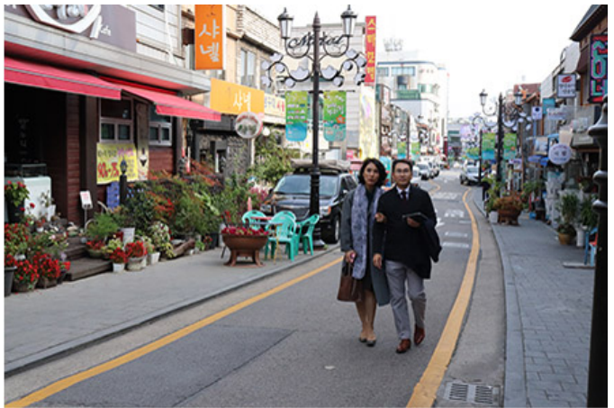
다시 찾은 탄뜨라 음악카페와 신포동 거리

Q. 결제 금액이 잘못 표시되거나 결제가 취소되는 경우, 해당 업체에 문의하여 해결 방법을 알아보십시오. 또한, 결제 금액이 잘못 표시되는 경우, 해당 업체에 문의하여 해결 방법을 알아보십시오.