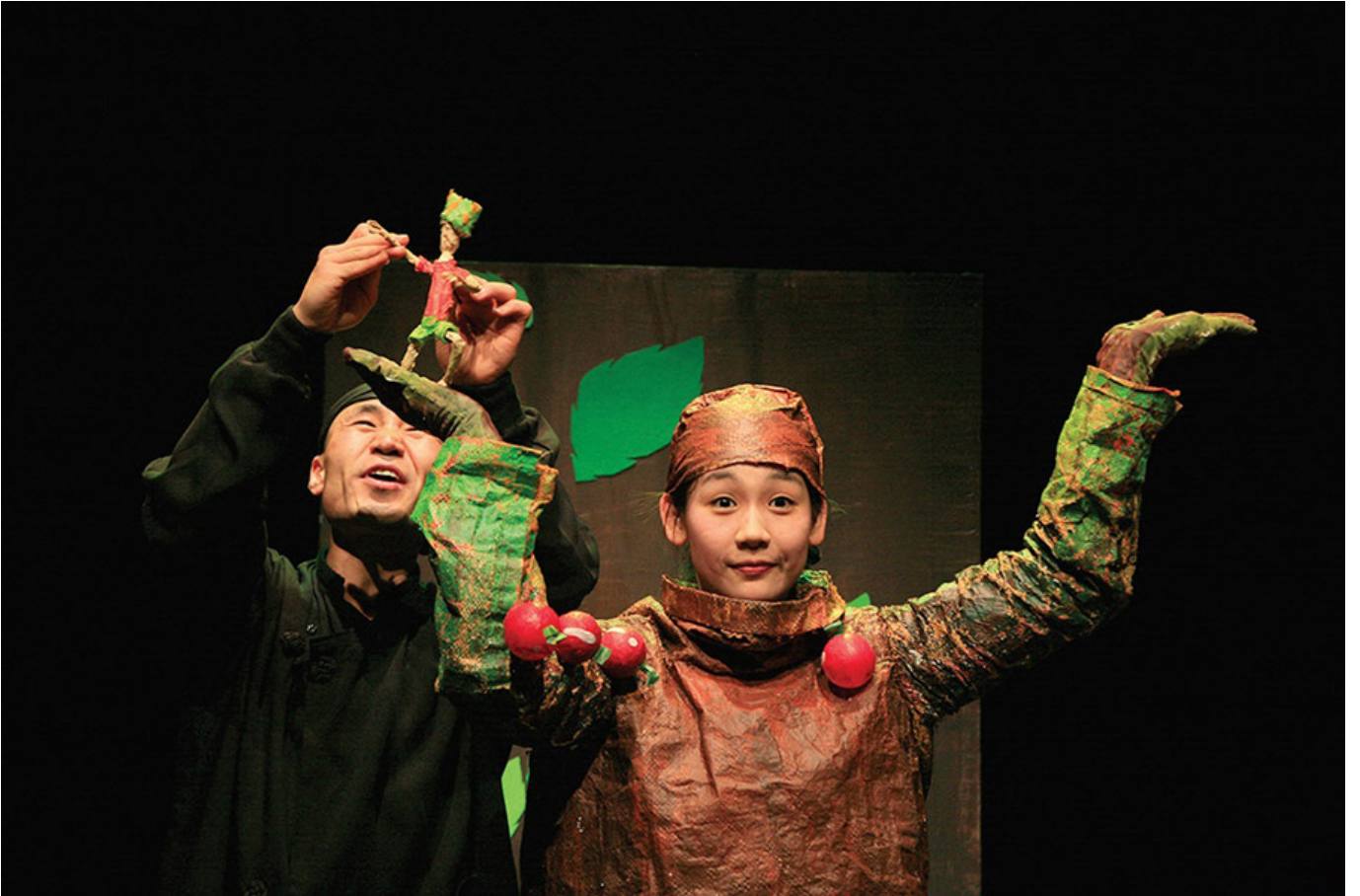
극단 나무 상상놀이극 <애들아 같이 놀자> 공연