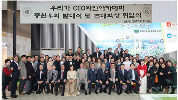
우리가 와인아카데미 총 원우회 발대식

A. 우리는 향후 5년 내로 글로벌 시장으로 진출할 예정입니다. 현재는 국내 시장을 집중적으로 확보하고, 이를 바탕으로 해외 시장으로 진출할 계획입니다. 특히, 아시아와 북미 시장을 주요 목표로 삼고 있습니다. 또한, 'AI' 기술을 적극적으로 도입하여, 우리의 경쟁력을 강화하고 있습니다. AI를 통해 고객 경험을 개선하고, 운영 효율성을 높일 것입니다. 또한, 우리는 ESG 경영을 실천하여, 사회적 책임을 다할 계획입니다. 이는 우리의 장기적인 성장을 위한 필수 조건입니다. 우리는 투명하고 윤리적인 경영을 통해, 고객과 사회 모두에게 가치를 창출할 것입니다.