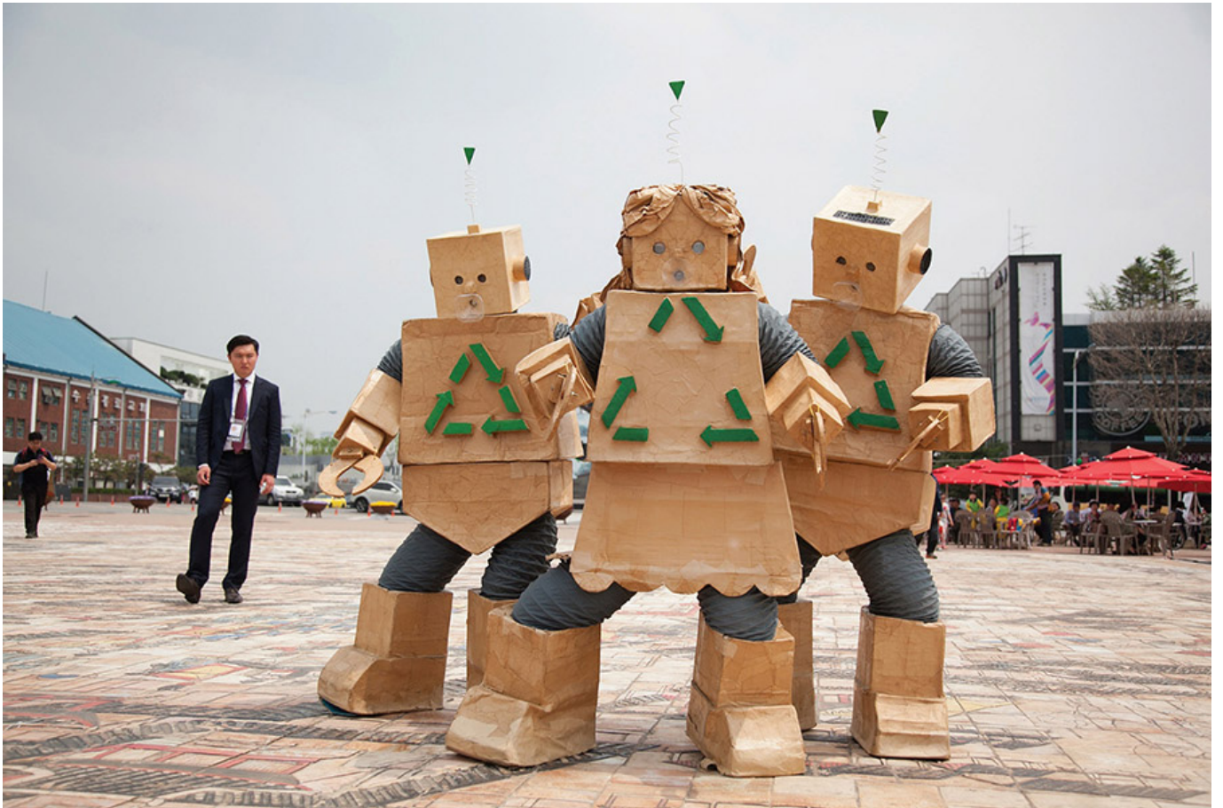
〈로봇 폐품〉 거리 공연

Q. 재활용을 하면 환경이 깨끗해지고, 자원을 절약할 수 있다. 하지만 재활용을 하면 일자리가 줄고, 생활비가 늘어난다. 어떻게 하면 좋을까?