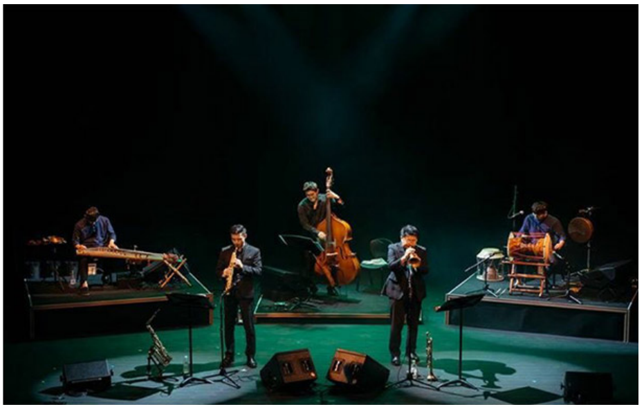
세움 아티스트 <SE:UM>

Q) 000000000000000000000 000000 00000 0000. 0000000 0000 00 0000 00 000000. 0000000 0000 0000 00000 00 000000000. 000000 0000 00000 0000000, 0000 0000000 0000 00 00000 000000 0000. 00000000000 00000, 0000000 0000 00 0 0 00000000 00 00 00000 00000 0000 0 0 00000. 0000 0000, 000000 0000 0000 00 0000 00000 0 0000. 0000 0000, 00000 0000 0000 00 0000 00000 0 0000. 0000 0000 00000 000000 00000, 00 00000 0000000 00000.