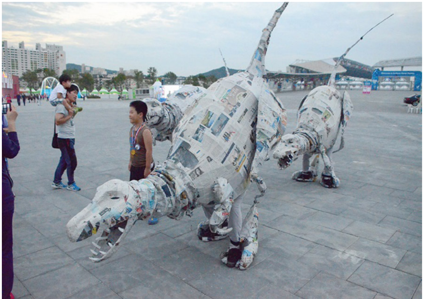
〈신문지 주라기〉 거리 공연

이와 같은 방식은 환경 보호와 재활용을 촉진하는 데 도움이 됩니다. 또한, 이러한 활동은 어린이들에게 환경에 대한 인식을 높이고, 환경 보호의 중요성을 일깨워줍니다. 이러한 활동은 환경 보호를 위한 중요한 첫 걸음입니다.