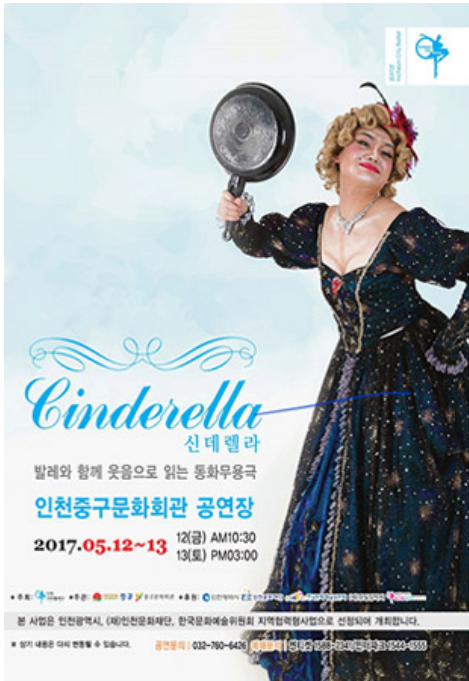
신데렐라 공연 포스터 ©인천시티발레단