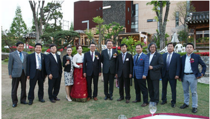
와인아카데미 5기 회장 취임식