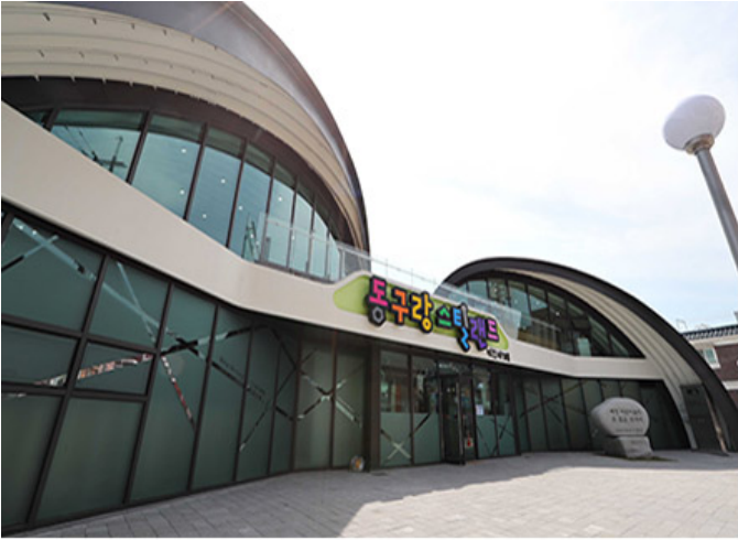
동구강 스틸랜드(인천 동구 화수로69번길 17)