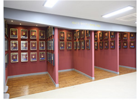
인천사회복지공동모금회 명예의 전당

'모든 것이 함께하는 문화나눔. 아트레인이 더욱 행복한 인천을 만들어갑니다.'