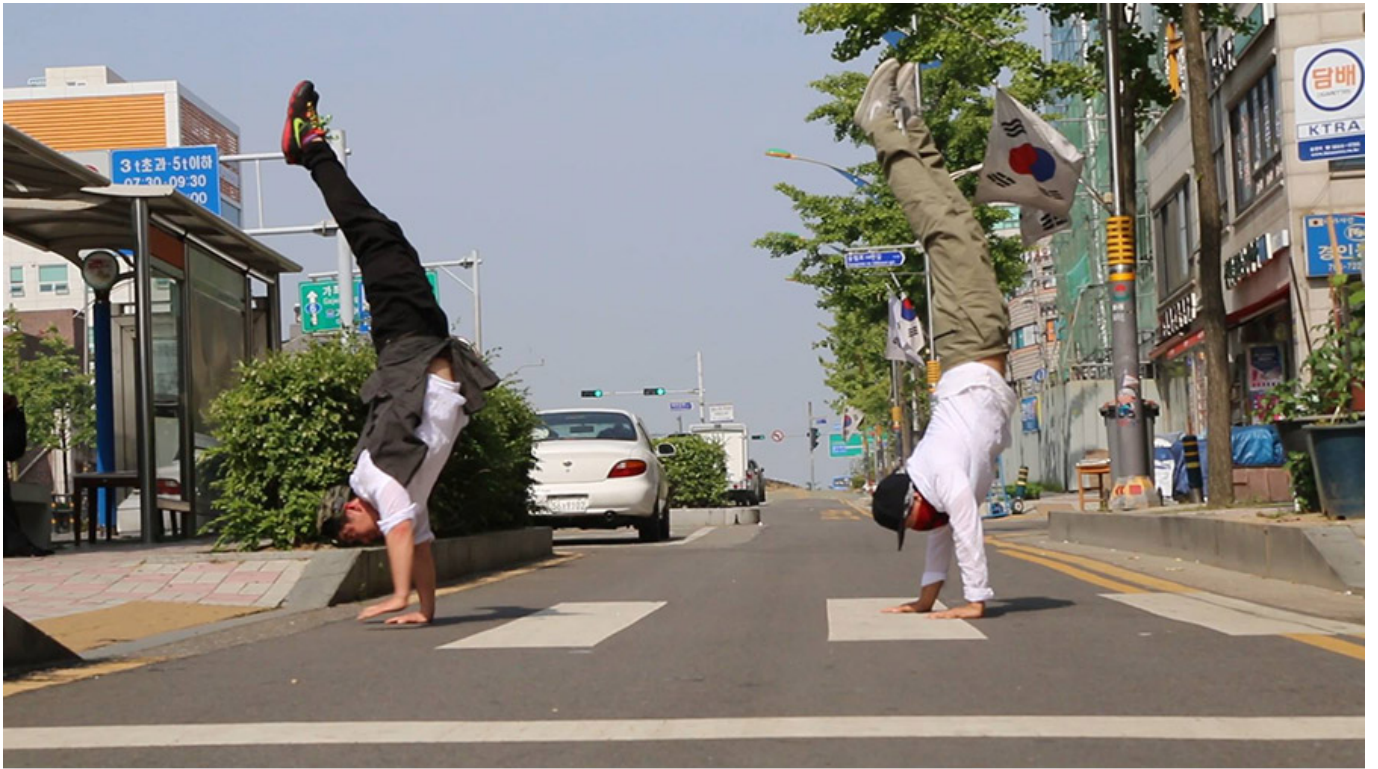
<도시청년 게릴라> 작당 제공

2015년 5월 10일 <도시청년 게릴라> 작당 제공. 이 작당은 작당 게릴라가 2015년 5월 10일 '0'으로 작당 게릴라가 작당 게릴라가 작당 게릴라가 작당 게릴라가 <도시청년 게릴라> 작당 게릴라가 작당 게릴라가.