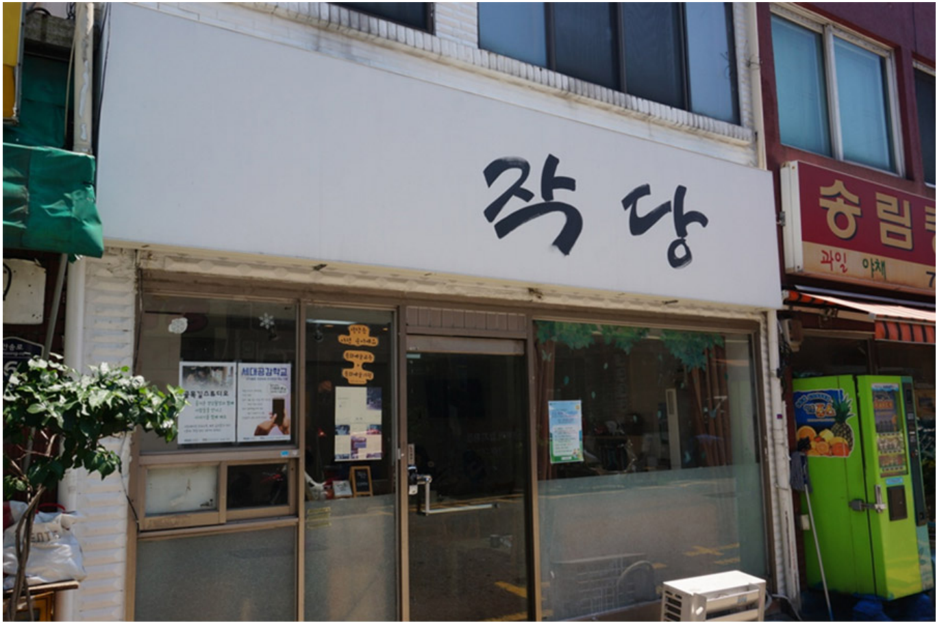
인천 동구 송림동에 자리잡은 <작당>