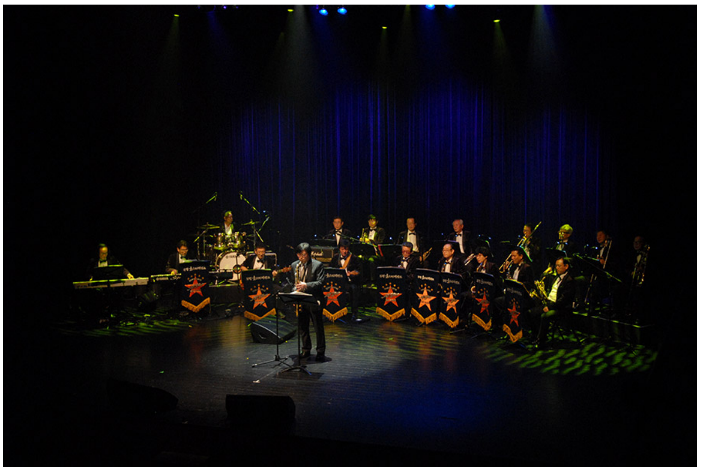
부평아트센터 공연

이 공연은 우리 지역사회를 위해 많은 노력을 기울인 우리 모두가 함께 만들어낸 소중한 성과입니다. 이 공연을 통해 우리 모두가 함께 노력한 결과에 대해 감사의 마음을 전하고, 앞으로도 더욱더 나은 공연을 위해 노력하겠습니다. 이 공연은 58곡으로, 이 공연을 통해 우리 모두가 함께 노력한 결과에 대해 감사의 마음을 전하고, 앞으로도 더욱더 나은 공연을 위해 노력하겠습니다. 이 공연은 100곡으로, 이 공연을 통해 우리 모두가 함께 노력한 결과에 대해 감사의 마음을 전하고, 앞으로도 더욱더 나은 공연을 위해 노력하겠습니다. 이 공연은 40곡으로, 이 공연을 통해 우리 모두가 함께 노력한 결과에 대해 감사의 마음을 전하고, 앞으로도 더욱더 나은 공연을 위해 노력하겠습니다. 이 공연은 100곡으로, 이 공연을 통해 우리 모두가 함께 노력한 결과에 대해 감사의 마음을 전하고, 앞으로도 더욱더 나은 공연을 위해 노력하겠습니다.