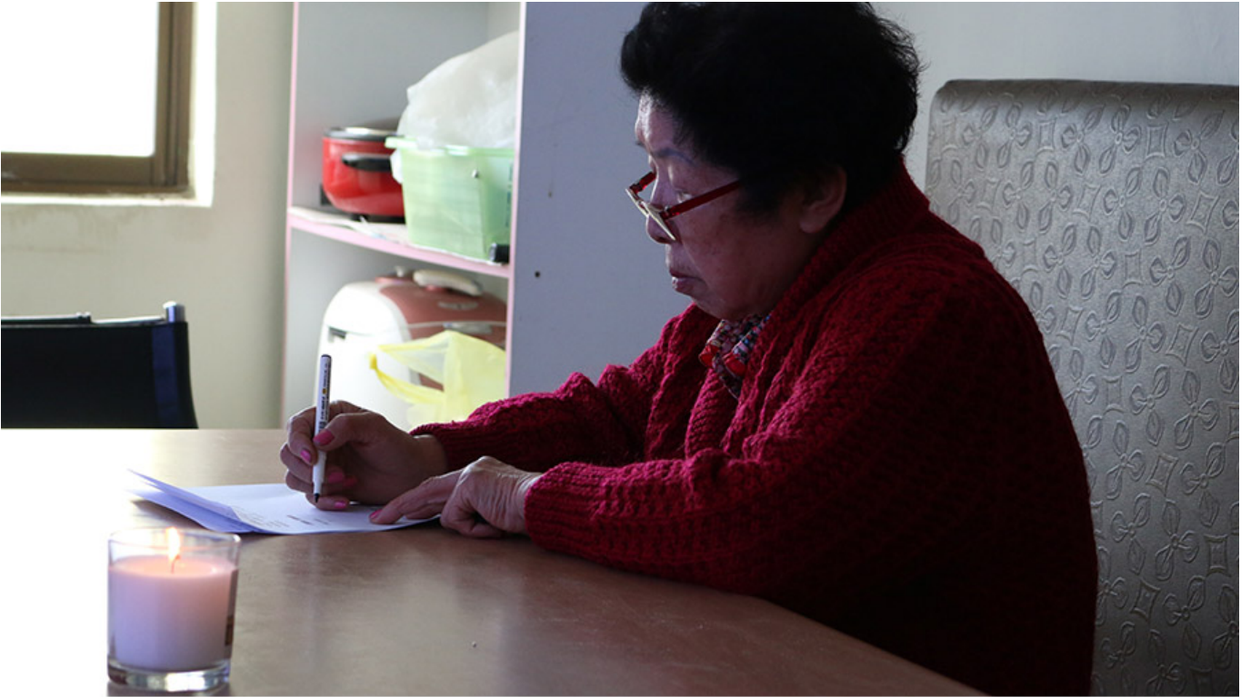
<자서전> 프로젝트 작당 제공

이 책은 이 프로젝트에서 얻은 이야기입니다. 이 책은 프로젝트에서 얻은 이야기, 프로젝트에서 얻은 이야기, 프로젝트에서 얻은 이야기.