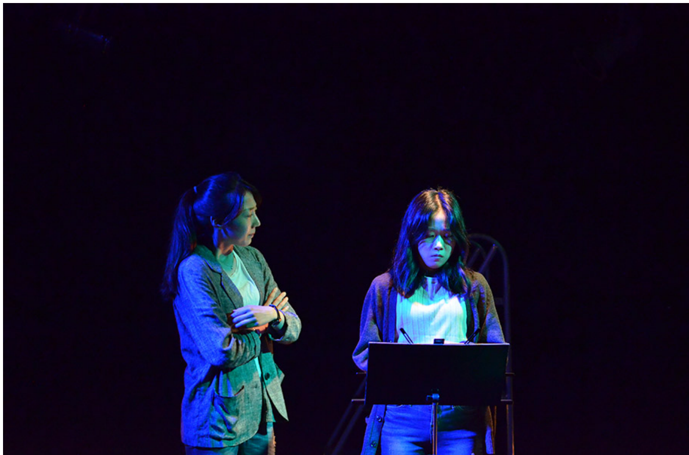
도처의 햄릿 (2018)

이 장면은 두 여성이 무대 위에서 대화를 나누고 있는 모습이다. 왼쪽에 서 있는 여성은 팔짱을 끼고 상대방을 바라보고 있으며, 오른쪽에 서 있는 여성은 마이크를 들고 발표 중이거나 질문에 대답하고 있는 것으로 보인다. 배경은 어둡고 무대 조명이 인물들에게 비추고 있다.