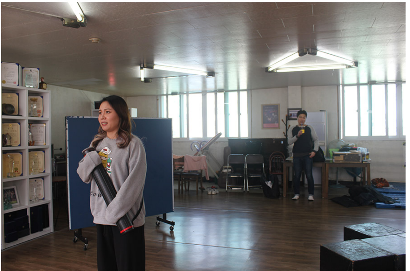
5월 24일에 공연 예정인 뮤지컬 <신포동 장미마을>을 연습하는 배우들