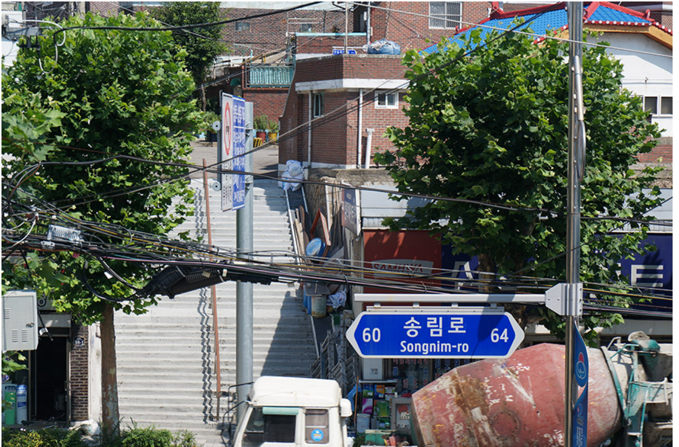
인천 동구 송림동

<〇〇>〇〇〇 〇〇〇 〇〇〇 〇〇 〇〇〇〇〇〇 〇〇〇 〇〇〇 〇〇〇〇 〇〇〇. 〇〇〇〇〇〇〇. 〇〇 〇〇〇 〇〇 〇 〇〇 〇〇 〇〇 〇〇 〇〇〇 〇〇〇〇〇 〇〇〇〇〇 〇〇 〇〇〇 〇〇〇〇 〇 〇〇〇. 〇〇〇〇 〇〇〇 〇〇〇〇 〇〇 5〇〇〇 <〇〇>〇〇〇 <〇〇〇〇〇 〇〇 〇〇>〇〇〇〇 〇〇〇 〇〇〇 〇〇〇〇 〇〇. 〇〇 〇〇〇〇 〇〇〇〇 〇〇〇 〇〇. 〇〇〇 〇〇〇 〇〇〇 〇〇〇 〇〇 〇〇〇 〇〇 〇〇〇 〇〇〇〇 〇〇 〇〇 〇〇〇 〇〇 〇〇〇 〇〇 〇〇〇 〇〇 〇〇 〇 〇 〇〇.