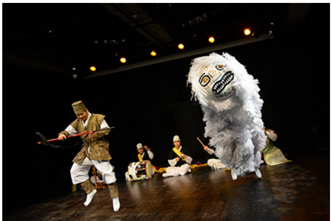
연희단 <비류>공연

이 공연은 전통 예술의 정수를 보여주는 소중한 기회입니다. 관객 여러분께 최고의 공연을 선사하기 위해 최선을 다하고 있습니다.