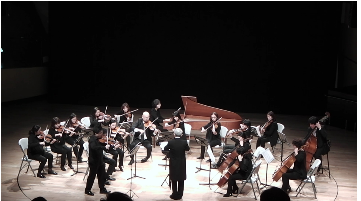
2014. 12.10 Four seasons2.MP4_000320247, 00000000 00

00 8 9 00 000000 000000. 000 000 00 <Virutoso of incheon> 00 0 000 0000?