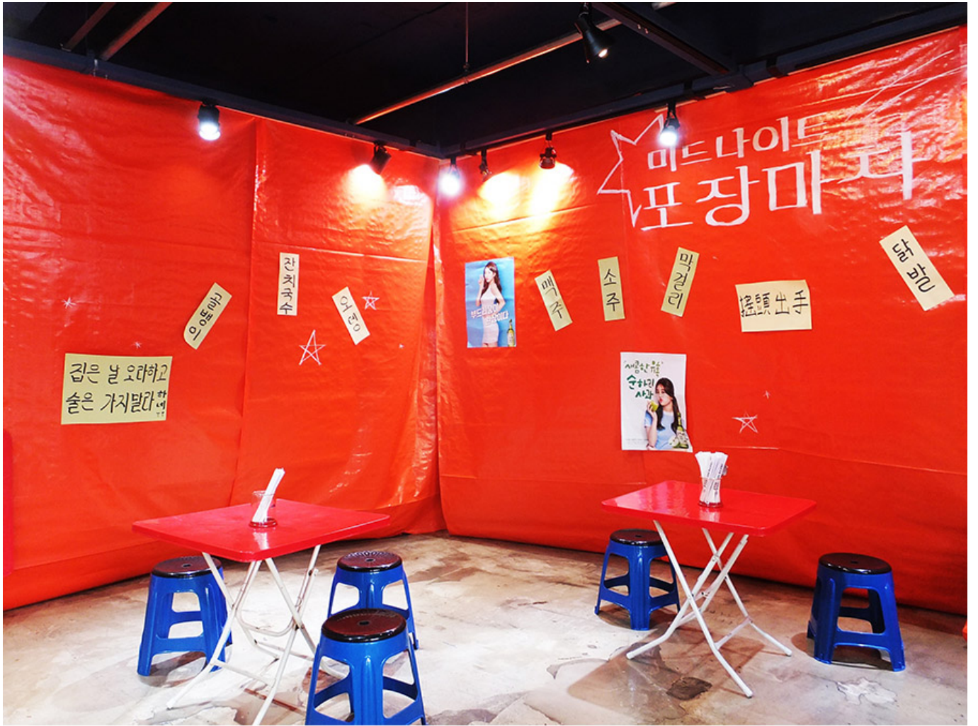
<미드나이트 포장마차> 공연 무대

Q. 이 사진은 어떤 공연의 무대 세트인가? 사진에서 보이는 것들을 보고, 이 공연의 분위기와 내용을 추측해 보자.