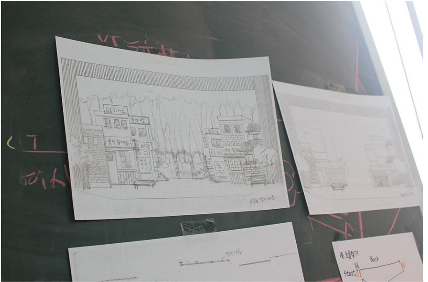
뮤지컬<신포동 장미마을> 무대 스케치

○○○○ ○○○○ ○○○○ ○○○ ○○○ ○ ○ ○○○○. ○○○ ○○○ ○○○ ○○○○ ○○○○ ○○○ ○○○○ <○○○○○○○○ ○○○○○○>○ ○○○ ○○○ ○○○○. ○○○○ ○○○ ○○○ ○○○ <○○ ○○○○○○>, <○○○>○○○. <○○○○○○ ○○○>○ ○○○○ ○○○○○○ ○○○○○○ ○○○○○○ ○○○○ ○○○○ ○○○○.