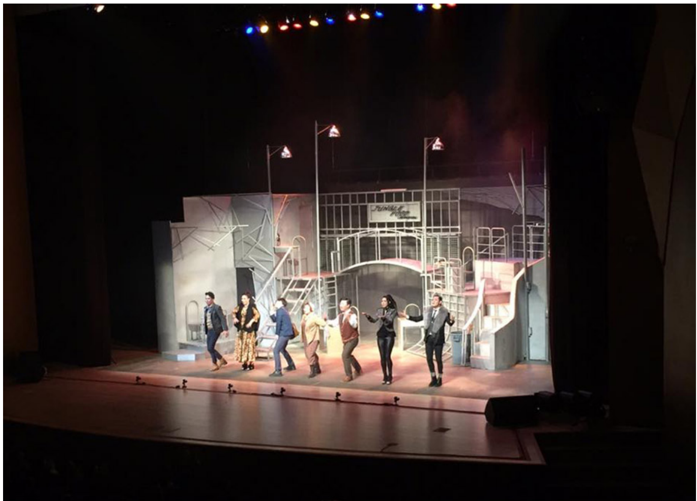
<정글라이프> 공연

이 공연은 사랑, 희망, 그리고 인간애를 주제로 합니다. 관객들에게 사랑의 힘을 믿고, 어려운 상황에서도 희망을 잃지 않는다는 메시지를 전달합니다. 또한, 서로를 이해하고 존중하는 것이 얼마나 중요한지를 깨닫게 해줍니다. 이 공연은 관객들에게 따뜻한 감동을 선사하며, 모두가 함께 웃고 즐길 수 있는 기회를 제공합니다.