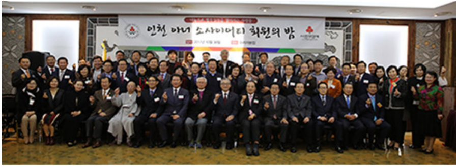
2017 아너의 밤