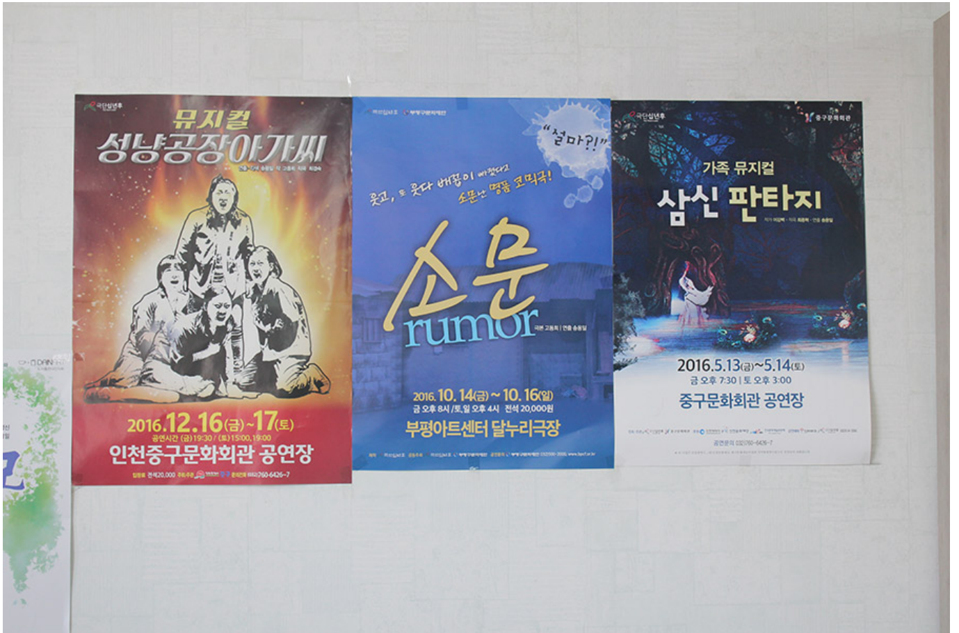
〈십년후〉극단의 작품 포스터

<소문>, <삼신 판타지>는 2016년 10월 14일부터 16일까지 부평아트센터 달누리극장에서 공연되었다. 공연 시간은 (금) 19:30 / (토) 15:00, 19:00