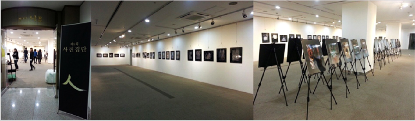
2015년 <사람집단 人>의 상상바라보기 전시회 당시 사진

A. 2009년 3월 10일부터 4월 13일까지 100여 점의 작품을 전시했다. 2012년 10월 4일부터 13일까지 100여 점의 작품을 전시했다. 2015년 10월 2~3일 100여 점의 작품을 전시했다. 2015년 10월 2~3일 100여 점의 작품을 전시했다. 2015년 10월 2~3일 100여 점의 작품을 전시했다.