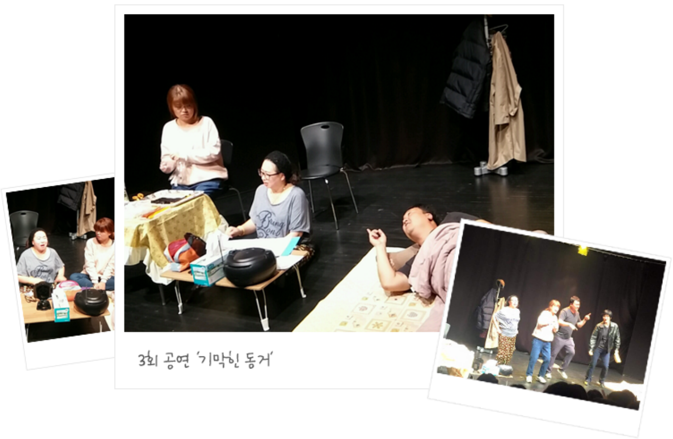
3회 공연 '기막힌 동거'

'2013년 장애인 예술인 지원사업'의 목적은 장애인 예술인의 창작활동 지원, 예술인으로서의 역량 강화, 예술인으로서의 사회적 인식 제고, 장애인 예술인 지원에 관한 법률 제14조 제2항에 따라 실시되는 사업입니다. 또한 장애인 예술인의 창작활동 지원, 예술인으로서의 역량 강화, 예술인으로서의 사회적 인식 제고, 장애인 예술인 지원에 관한 법률 제14조 제2항에 따라 실시되는 사업입니다. 또한 장애인 예술인의 창작활동 지원, 예술인으로서의 역량 강화, 예술인으로서의 사회적 인식 제고, 장애인 예술인 지원에 관한 법률 제14조 제2항에 따라 실시되는 사업입니다.