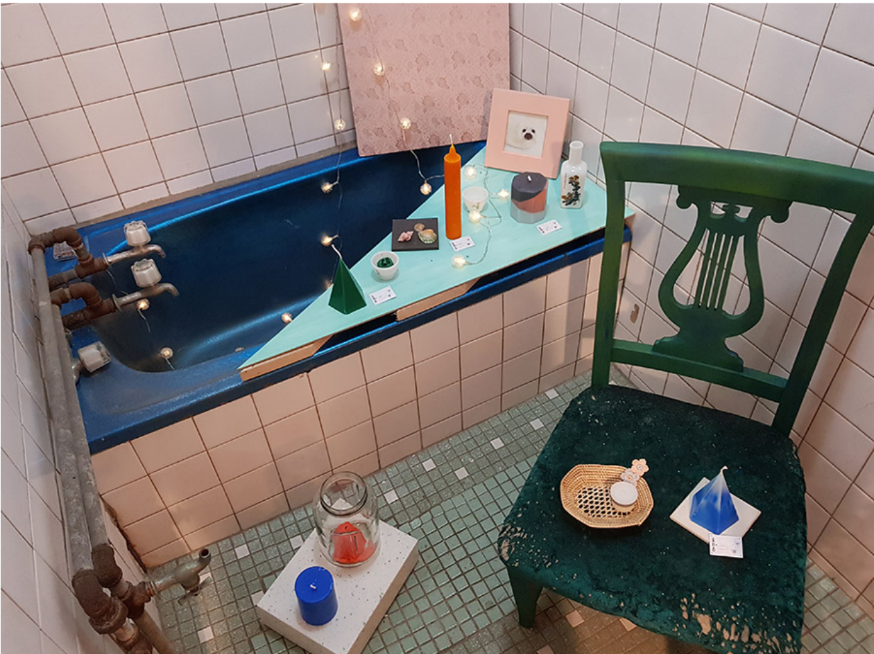
이번 전시 <췁망췁백화점>은 기존의 공간 구조물에 자연스럽게 작품들을 배치함으로써 작가들의 작품세계를 친근하게 풀어냈다.