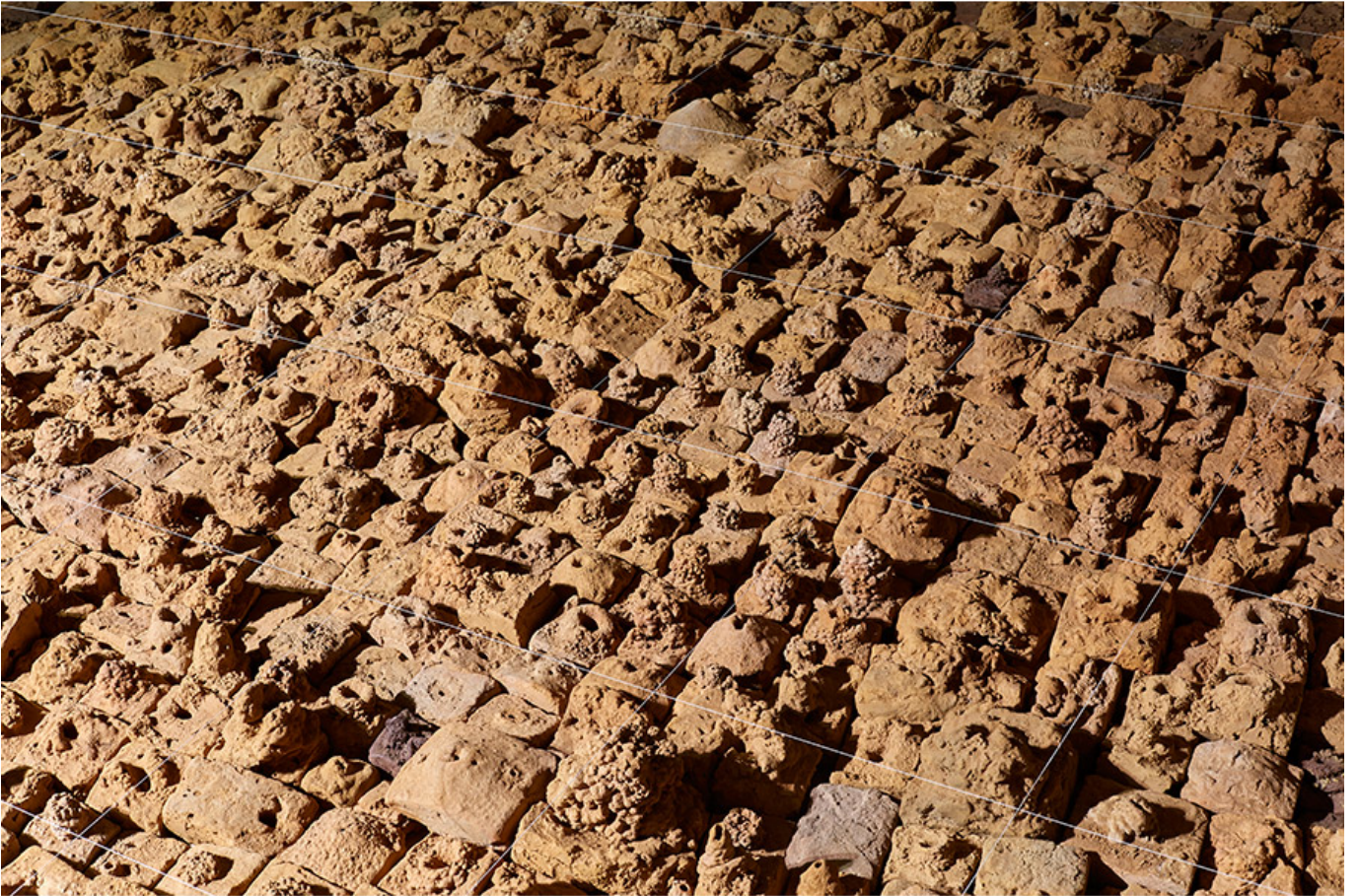
고고학적풍경-불의 만다라, 소성된 갯벌, 철, 488×244×80cm, 2018