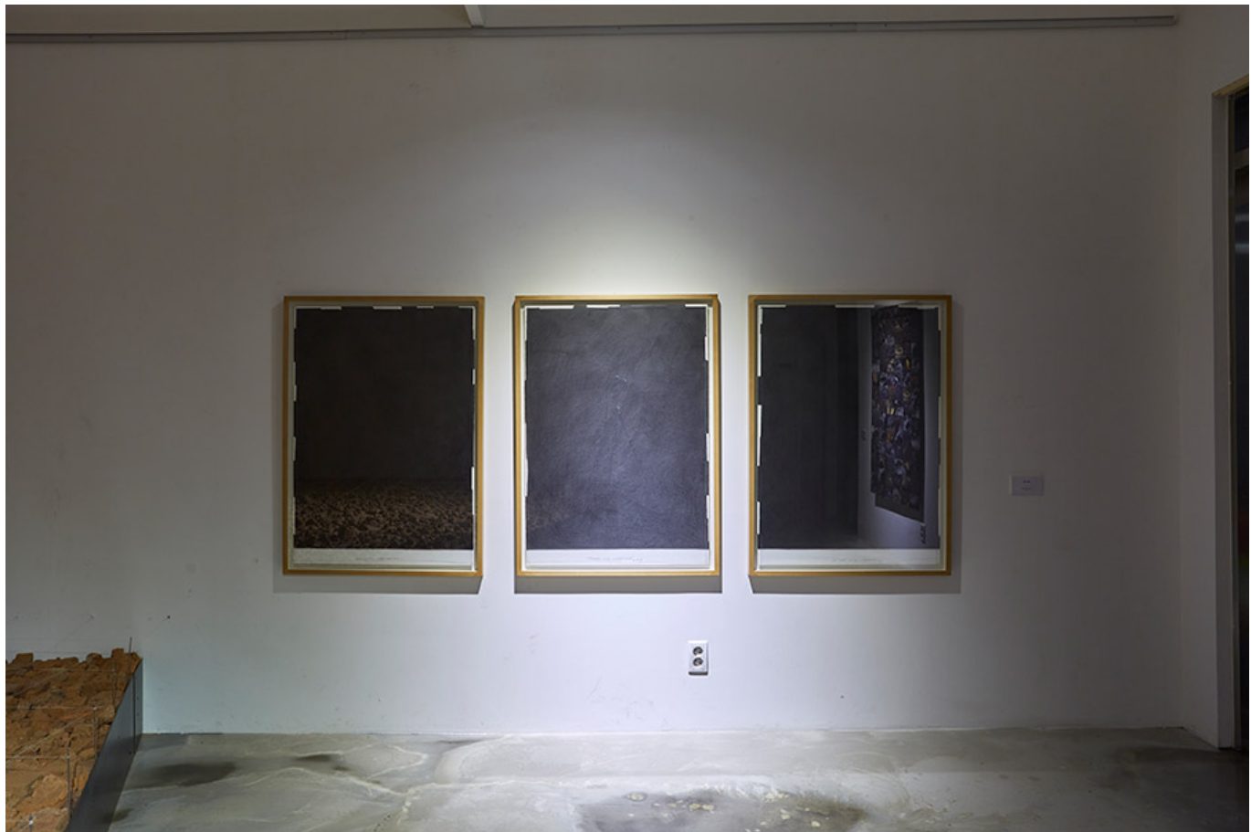
불의 공제선, 종이 위의 흑연, 70x100cm, 2018

0000, 000 0000 0000 00 00 00 0 0000. 00 000 00 000 000 000 000 0 000 000 000 0000 000 0 00 000000 000 000 000 000000 000000 000 000. 00000 000 00 00000 00000. 0000 0000 0000 0000 0000 00 0000 0000 0 0 00 00 00000 0000. 0000 '00'0 00 000 00000 00 0 00 0000 00 0 0000 000 0000 00000. 00 0000 0000 0 0000 000000 0(?)0 000000 00 0000 00000. 0000 0000 00 0000 00, 0000 00 00 0000 0000 00 0000 000000. 00 0 0000 000000 0 00 00, 00000 0000 00 00000 00000. 00 0 0000 00 0000 00 0 0000 00000. 000000000 00 0000 00 00 00 0000 0000 00 0000. 0 0000 00000000000 0000 00, 0000000 00, 0000 00, 00000 0000 00000 00 '00'0 00 0000. 00 00, 00000000 0000 00 00 00 00000 00 00 00000000 0000 00 00 00 0000 00 0000 0000.