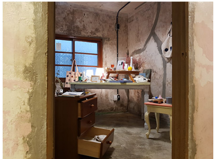
버려진 낡은 여관에서 다양한 예술 활동이 이뤄지는 문화공간으로 탄생한 '인천여관X루비살롱'

인천여관X루비살롱은 인천광역시 중구 남대문로1가길 10에 위치한 문화공간이다. 1960년대 여관으로 사용되던 이 공간은 10여년 동안 방치되어 왔으나, 2014년 문화재단에 의해 리노베이션을 거쳐 문화공간으로生まれ。 이곳에서는 다양한 예술 활동이 이뤄지며, 지역 주민들과 함께 소통하는 공간으로 자리매김하고 있다. 특히, 공연, 전시, 워크숍 등 다양한 프로그램을 통해 문화 향유 기회를 제공하고 있다. 또한, 지역 예술가들의 창작 활동을 지원하고, 문화 교류를 위한 플랫폼 역할을 하고 있다.