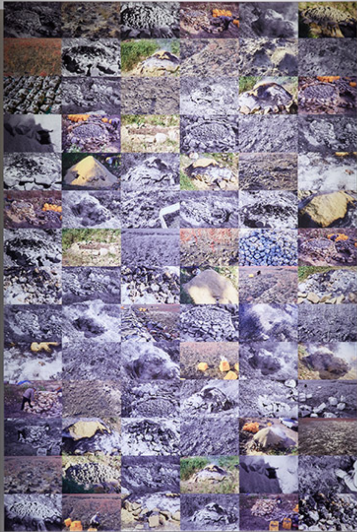
고고학적 풍경-볼의 만다라, 디지털프린트, 10×150cm, 2016