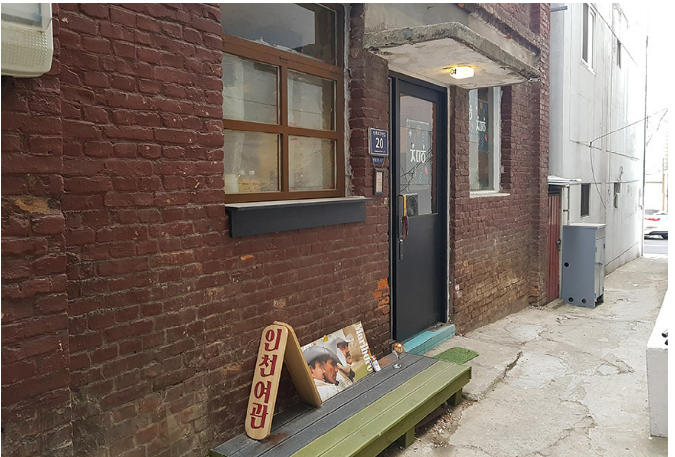
건물 사이의 후미진 셋길에 숨어있는 '인천여관X루비살롱'

0000x00000 0000 00 00 '0000' 000. 00 0 00 00000 0 00 00 00 000 00, 00000 000 00 000 000000. 000 000 00 00 0000 00 0000 00 000 00 0000 000 000 0000x000000 000. 00 000 000 0000 0000x000000 000 0 00 0000. 000 000 00 00 00 000 000 000 0000 0000 0000 000 0 0000 000.