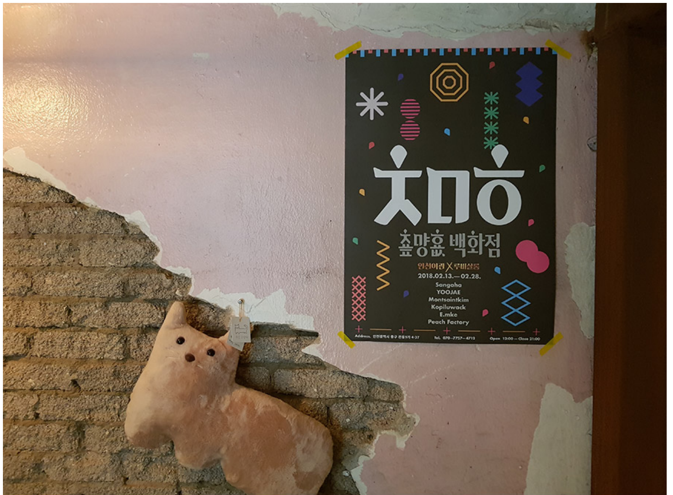
지난 2월 13일부터 28일까지 '인천여관X루비살롱'의 2층 전시장에서 세 번째 전시 <출망훈백화점>이 열렸다.

2020년 2월 13일부터 28일까지 '인천여관X루비살롱'의 2층 전시장에서 세 번째 전시 <출망훈백화점>이 열렸다.