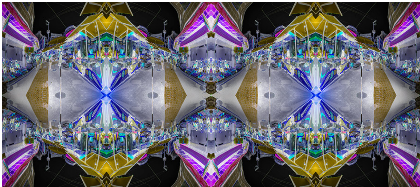
Repeat Stage No1_168x74.5cm_2018

Repeat Stage No1_168x74.5cm_2018. This artwork is a complex, multi-layered structure, highly detailed and symmetrical. It features a central, glowing blue and white core, surrounded by intricate, colorful patterns in shades of purple, yellow, and green. The overall composition is highly reflective and symmetrical, resembling a complex architectural or scientific structure.