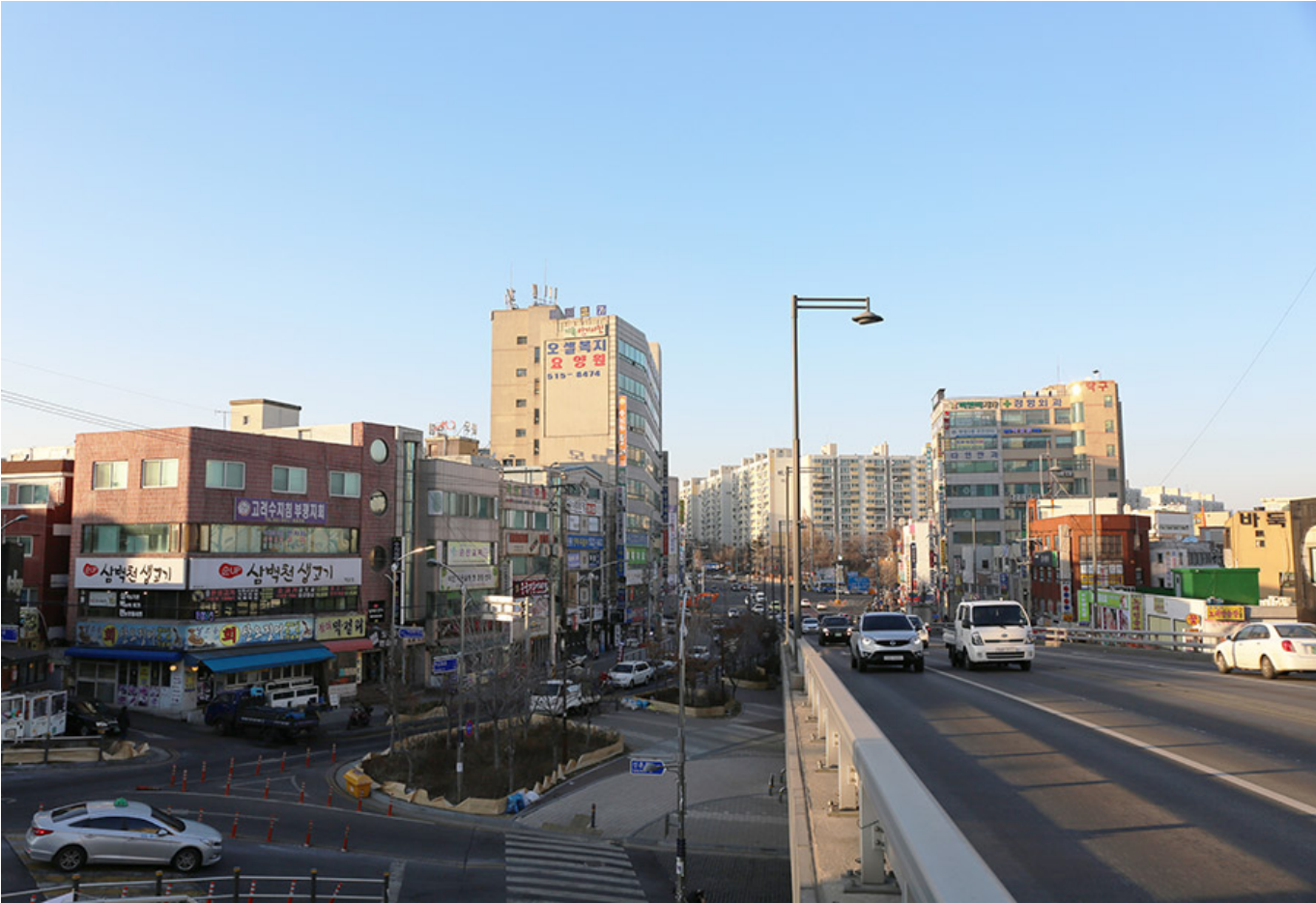
000_Sounds of the City in Bupyeong_200 000_000 00000_00_0000_2018

0000 00 00 000 00 000 0000. 00 00 00 000 000 00000 00000 0000 0 0000 000000 00. 00 000 000 000 000 000 0000 000 000 000 00, 00 00 000 00 000 0000 0000 00 000 000 00. 000 00 0 000 00 00 0 00 000 000 00 000 00, 000 0000 000 0 00.