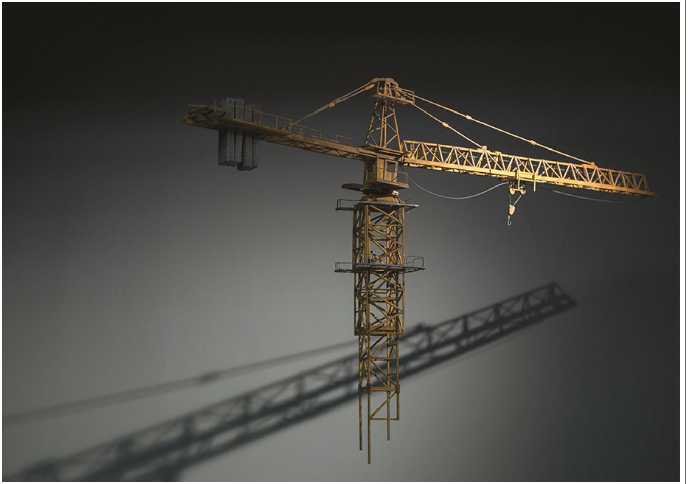
0001_00, 00, 00,000_185x23x82cm_2017