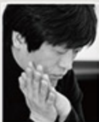
「아름답고 쓸모없기를」 (문학동네, 2016)