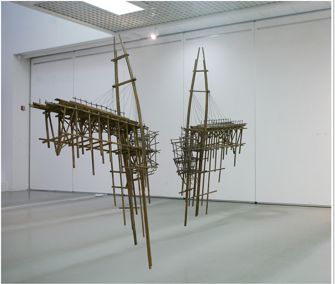
2013 年, 中国 杭州, 杭州 2m 杭州, 2013