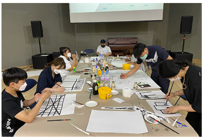
学生が授業で学んでいる様子(グループワーク)