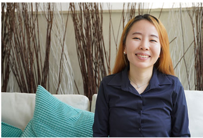
○○○ ○○ ○○○○ (○○: ○○○ ○○)