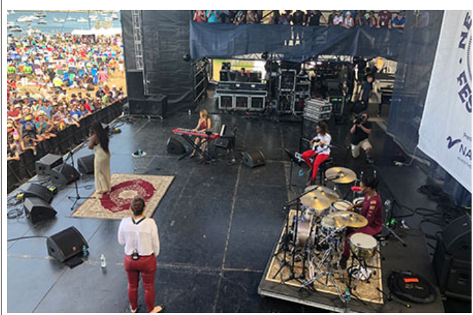
이 나라 사람들과 만났습니다 (이 나라 사람들과 만났습니다)

이 나라 사람들과 2019년 이 나라 사람들과 ‘Concha Buika’ 이 나라 사람들과 만났습니다, ‘New Port Jazz festival’, ‘Red Sea Jazz festival’, ‘NYC Summer stage’, ‘SF Jazz center’, ‘Coliseu Theater’ 이 나라 사람들과 만났습니다.