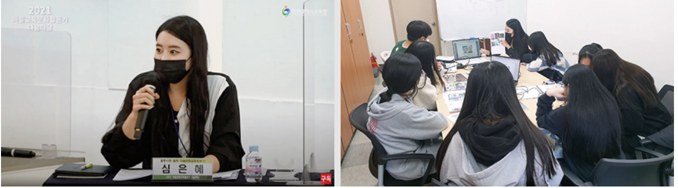
○○○○○○○○○○○○, 2021 ○○○○○○ ○○○○○○ ‘We Art Play’ ○○○○ (○○ ○○: ○○○)