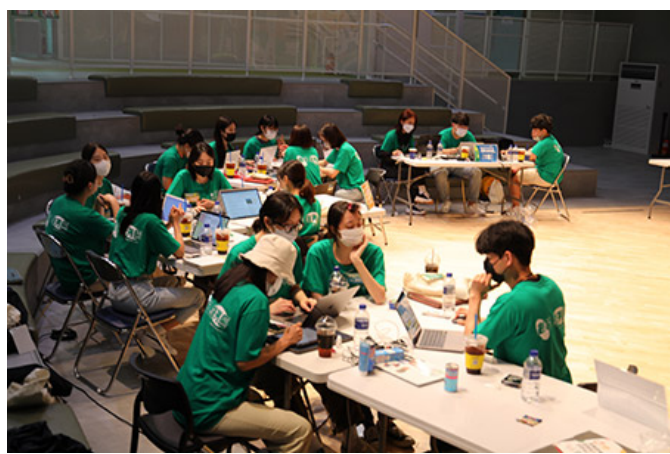
学生が授業で学んでいる様子

「これらを通して、学生は「自分たちの力で何かを成し遂げる」という達成感を得られる。また、課題をクリアしていく過程で、チームワークの大切さや、コミュニケーションの重要性も学べる。本学では、このような実践的な学習を重視し、学生が社会で活躍するための力を身につけてほしいと考えている。」