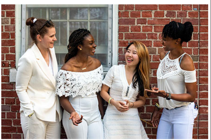
이 나라 사람들과 (이 나라 사람들과 만났습니다)