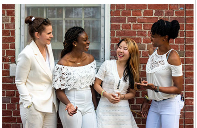
우리는 이 모든 것을 이룬다 (모든 것을 이룬다)