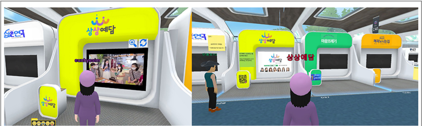
2022 상상예담 전시 모습 (좌: 000_000)

향후 계획 및 기대에 대해 말씀드리겠습니다. 1. 이번 행사를 통해 참가자들이 다양한 경험을 할 수 있도록 노력하겠습니다. 또한, 참가자들의 의견을 수렴하여 다음 해에 더욱 나은 행사를 준비하겠습니다. 2. 참가자들이 더 편리하게 이용할 수 있도록 <편의시설 및 휴게 공간>, 참가자들이 더 즐겁게 참여할 수 있도록 <인터랙티브 콘텐츠 개발!>, <다양한 연령대 & 성별에 맞는 프로그램>, 등 다양한 프로그램을 <향후 계획 및 기대에 대해 말씀드리겠습니다> 할 예정입니다. 3. 참가자들이 더 즐겁게 참여할 수 있도록 <인터랙티브 콘텐츠 개발!>, <다양한 연령대 & 성별에 맞는 프로그램>, 등 다양한 프로그램을 <향후 계획 및 기대에 대해 말씀드리겠습니다> 할 예정입니다. 또한, 참가자들의 의견을 수렴하여 다음 해에 더욱 나은 행사를 준비하겠습니다. “이번 행사를 통해 참가자들이 다양한 경험을 할 수 있도록 노력하겠습니다. 또한, 참가자들의 의견을 수렴하여 다음 해에 더욱 나은 행사를 준비하겠습니다. 2. 참가자들이 더 편리하게 이용할 수 있도록 <편의시설 및 휴게 공간>, 참가자들이 더 즐겁게 참여할 수 있도록 <인터랙티브 콘텐츠 개발!>, <다양한 연령대 & 성별에 맞는 프로그램>, 등 다양한 프로그램을 <향후 계획 및 기대에 대해 말씀드리겠습니다> 할 예정입니다.”