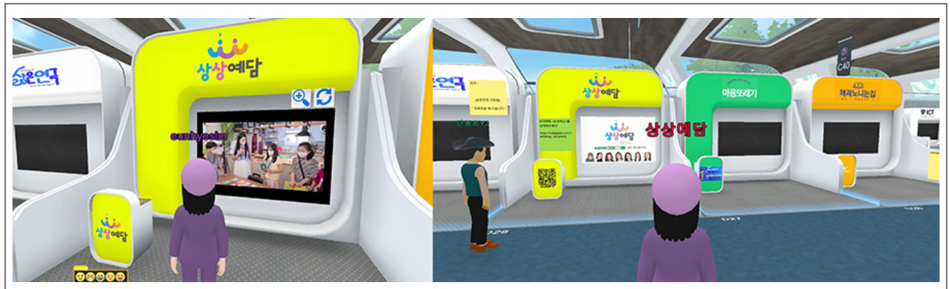
2022 상상예담 전시 모습 (좌: 상상예담)

본 사업의 필요성은 첫째, 지역사회의 다양한 문화·예술 활동을 지원하고, 둘째, 지역주민의 문화·예술 참여 기회를 확대하고, 셋째, 지역문화의 활성화를 도모하는 데 있다. 또한, 지역문화의 활성화를 도모하고, 지역주민의 문화·예술 참여 기회를 확대하고, 지역사회의 다양한 문화·예술 활동을 지원하는 데 있다.