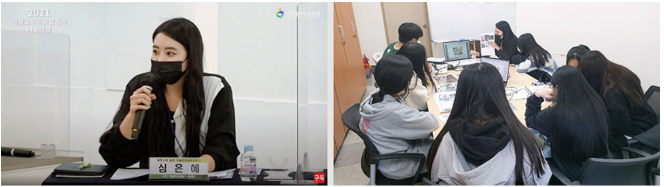
아산시교육지원청, 2021 아산시교육지원청 ‘We Art Play’ 워크숍 (2021. 11. 18. 오후 2시)