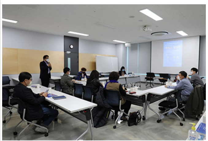
臺灣電力公司 <環境 社會> 社會責任報告書