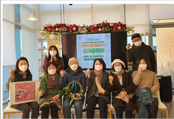
관악자연생태박물관 - 관악이름프로젝트 성과공유회

이번 행사는 관악자연생태박물관의 ‘지구의 날’을 맞아, 5월 22일 서울특별시 관악구 관동로 123길 10에 위치한 관악자연생태박물관에서 ‘지구의 날’ 기념 행사를 개최했다. 이번 행사는 관악자연생태박물관의 ‘지구의 날’을 맞아, 5월 22일 서울특별시 관악구 관동로 123길 10에 위치한 관악자연생태박물관에서 ‘지구의 날’ 기념 행사를 개최했다.