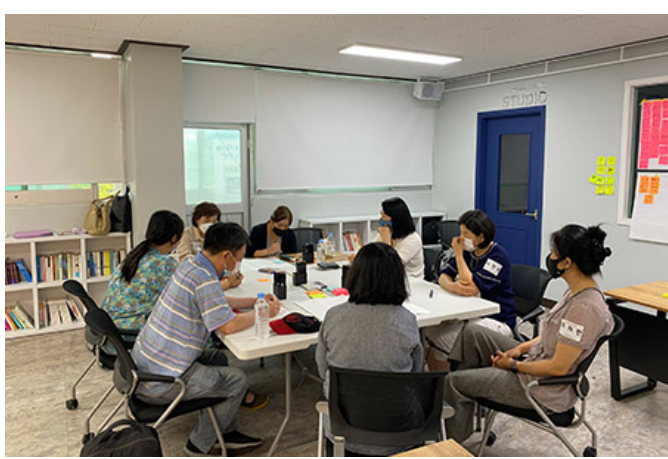
2024년 1월 10일 2024년 1월 10일

2013년 1월 10일 <103명 학생> 103명 학생이 참여한 103명 학생. 103명 학생이 참여한 103명 학생이 참여한 103명 학생, 103명 학생이 참여한 103명 학생이 참여한 103명 학생. 2024년 1월 10일 103명 학생. 103명 학생이 참여한 103명 학생이 참여한 103명 학생이 참여한 103명 학생.