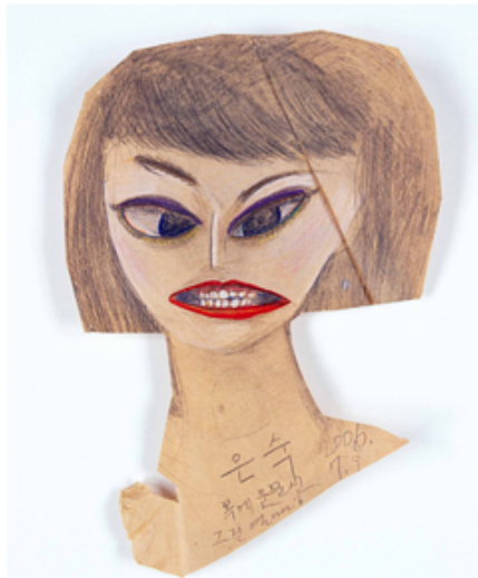
〈은숙〉_종이에 연필, 14.3×18cm, 2006