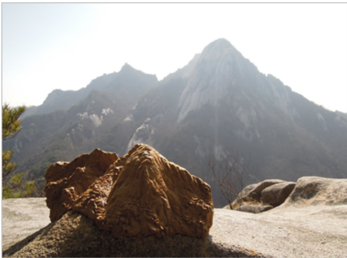
산에서 조각하기 1- 삼각산 조각하기(영봉에서). 2012, 휴, 47X28X23(cm)

이러한 과정은 단순히 물건을 정리하는 것을 넘어, "이것이 내가 필요로 하는 것"이라는 인식을 형성하는 과정이다. "이것이 내가 필요로 하는 것"이라는 인식을 형성하는 과정은, 이 과정이 단순히 물건을 정리하는 것을 넘어, "이것이 내가 필요로 하는 것"이라는 인식을 형성하는 과정이다.