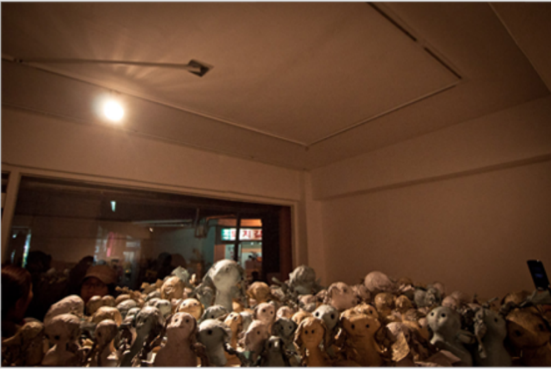
<딸기코의 딸들>_종이, 향불, 연필, 나무, 가변크기, 2011