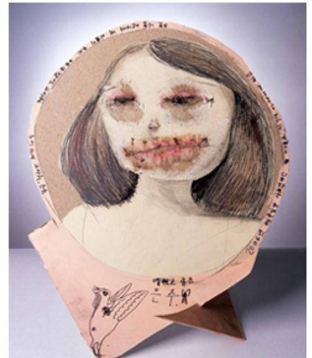
〈은주언니〉_혼합재료, 17×15×26cm, 2006