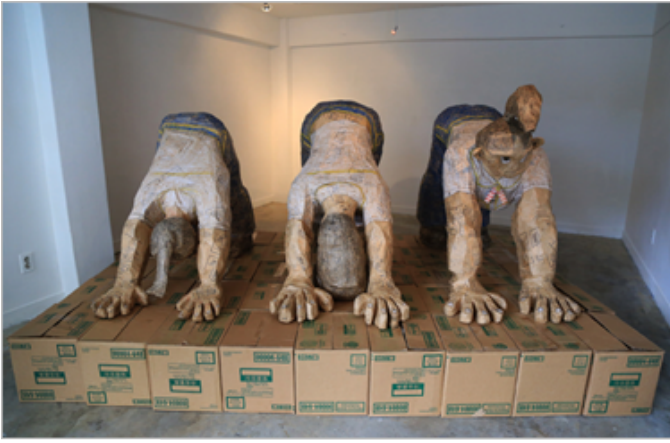
〈견상(犬狀)자세 중인 알바생〉_맥도날드 쓰레기, 308×200×153cm, 2014