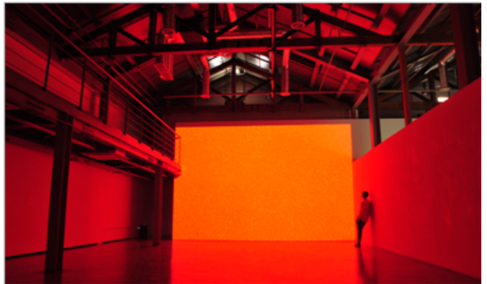
<#include red >

이 프로젝트는 빛을 통해 공간을 재구성하는 데 목적이 있다. 빛의 색과 강도를 조절하여 관람객의 감정을 자극하고, 공간의 분위기를 조성하는 데 중점을 둔다. 또한, 빛을 통해 시간의 흐름을 표현하고, 공간의 깊이를 강조하는 데도 노력했다. 이번 프로젝트는 빛의 힘을 통해 공간을 새롭게 바라보는 계기를 마련하고자 한다.