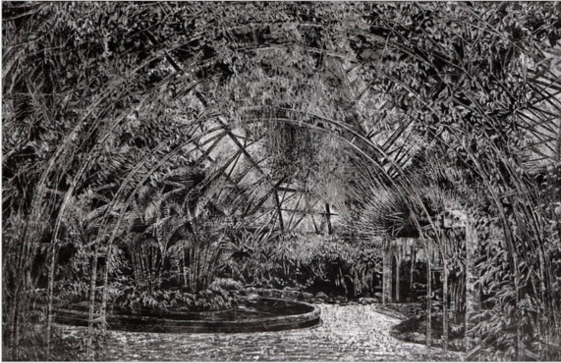
〈온기, fresco 회벽위에 스크래치, 90.0x140cm, 2016〉