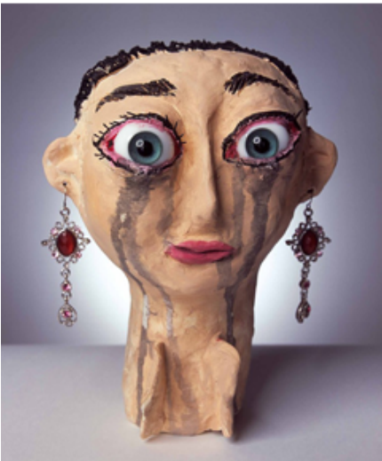
〈경숙〉_혼합재료, 14×16×18cm, 2006

A : 이 작품은 인간의 감정과 사회적 관계를 탐구하고 있습니다. 이 작품은 인간의 감정과 사회적 관계를 탐구하고 있습니다.