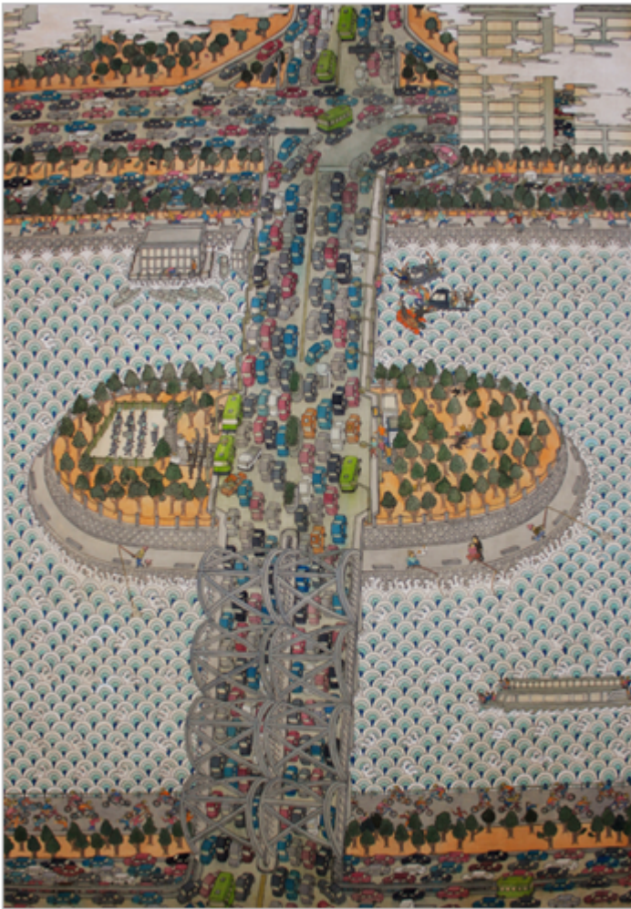
노들섬한강대교 정체도(老鸚島 漢江大橋 停滯圖) 130 X112cm_마(麻)에 수간채색_2012