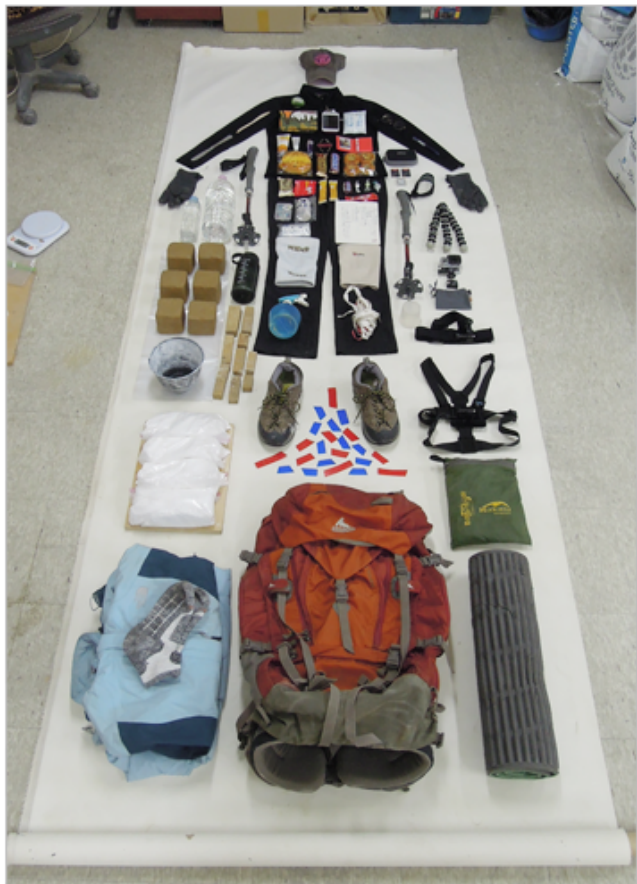
산에서 조각하기 1- 삼각산 조각하기(배낭꾸리기) 2012, 칼라사진, 가변크기