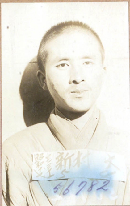
昭和 17 年 11 月 31 日 西大門刑務所 = 於テ撮影 保存原板 (小) 第 56782 號