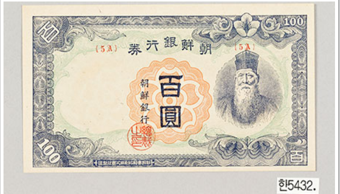
朝鮮銀行 100圓券 (1945年) (한5432.)

이 문서는 1945년 12월 100원(백원)과 50원(오십원)의 조선은행권(朝鮮銀行券)을 보여줍니다. 이 문서는 조선민주주의인민공화국(朝鮮民主主義人民共和國)의 공식 기록입니다. 이 문서는 1945년 12월 100원(백원)과 50원(오십원)의 조선은행권(朝鮮銀行券)을 보여줍니다. 이 문서는 조선민주주의인민공화국(朝鮮民主主義人民共和國)의 공식 기록입니다.