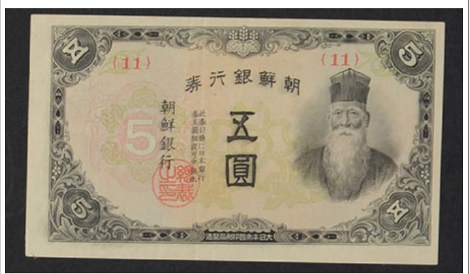
朝鮮銀行 5圓券 (1945年)