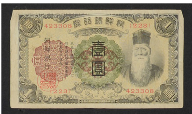
朝鮮銀行 1圓券 (1945年)