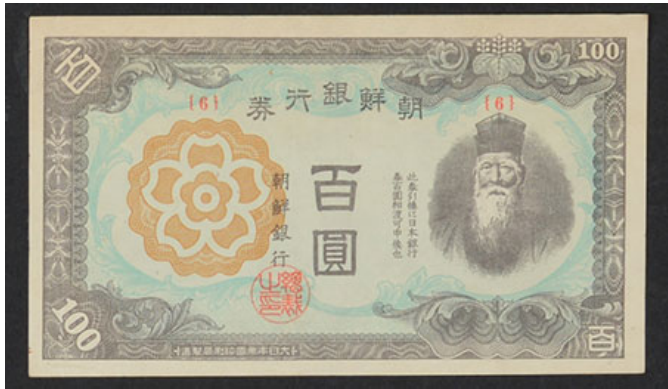
朝鮮銀行 100圓券 (1945年)