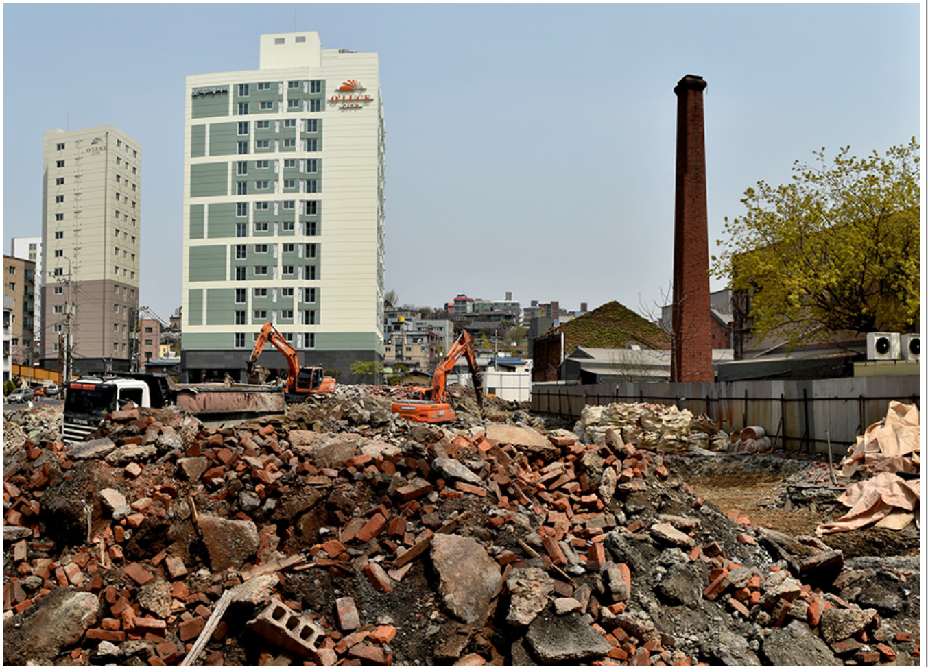
2020年4月 〇〇〇〇 〇〇〇〇〇〇 〇〇 〇〇 〇〇〇〇