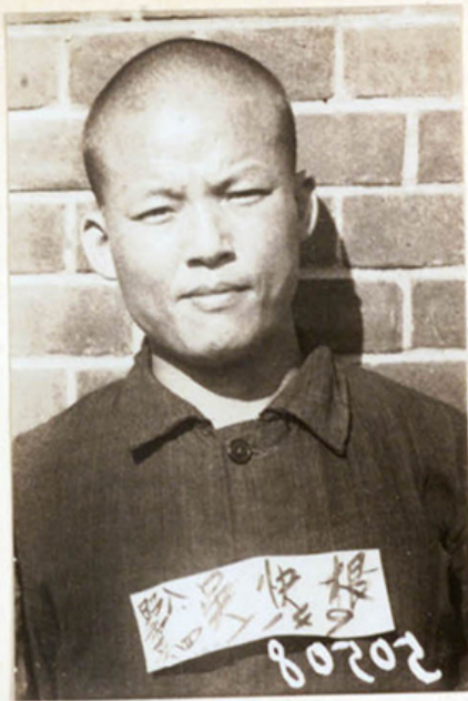
昭和16年8月4日 西大門刑務所 = 於テ撮影 保存原板(111)第 50508 號