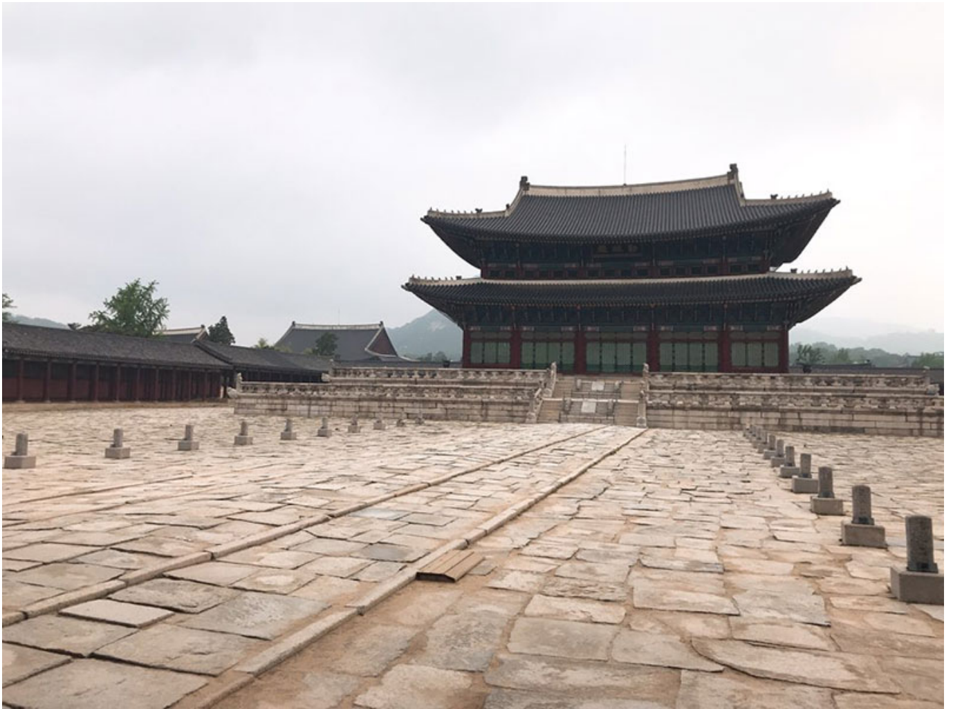
조선 궁궐의 정전

조선 궁궐의 정전(正殿)은 궁궐의 가장 중요한 건물로, 국왕이 즉위하고 각종 의식을 행하는 장소였다. 정전은 궁궐의 중심에 위치하며, 대궐(大殿)이라고도 불린다. 정전의 구조는 대개 2층으로, 지붕은 단아한 곡선을 띠고 있으며, 기둥은 방목(方木)을 사용한다. 정전 앞에는 넓은 돌계단(石階)이 있으며, 양쪽에 돌기둥(石柱)이 세워져 있다. 정전은 궁궐의 권위와 품격을 상징하는 중요한 건축물이다.