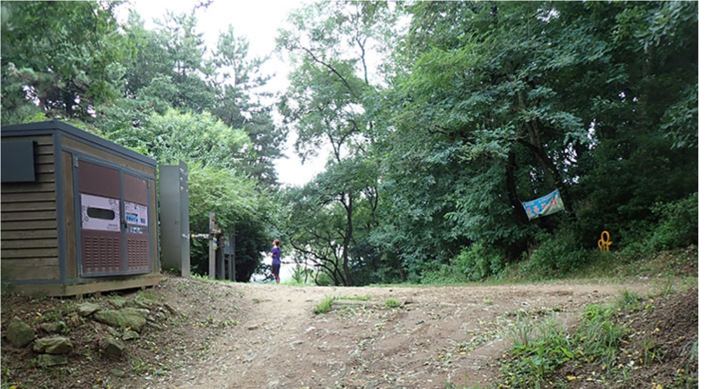
8월 9일 0000 000