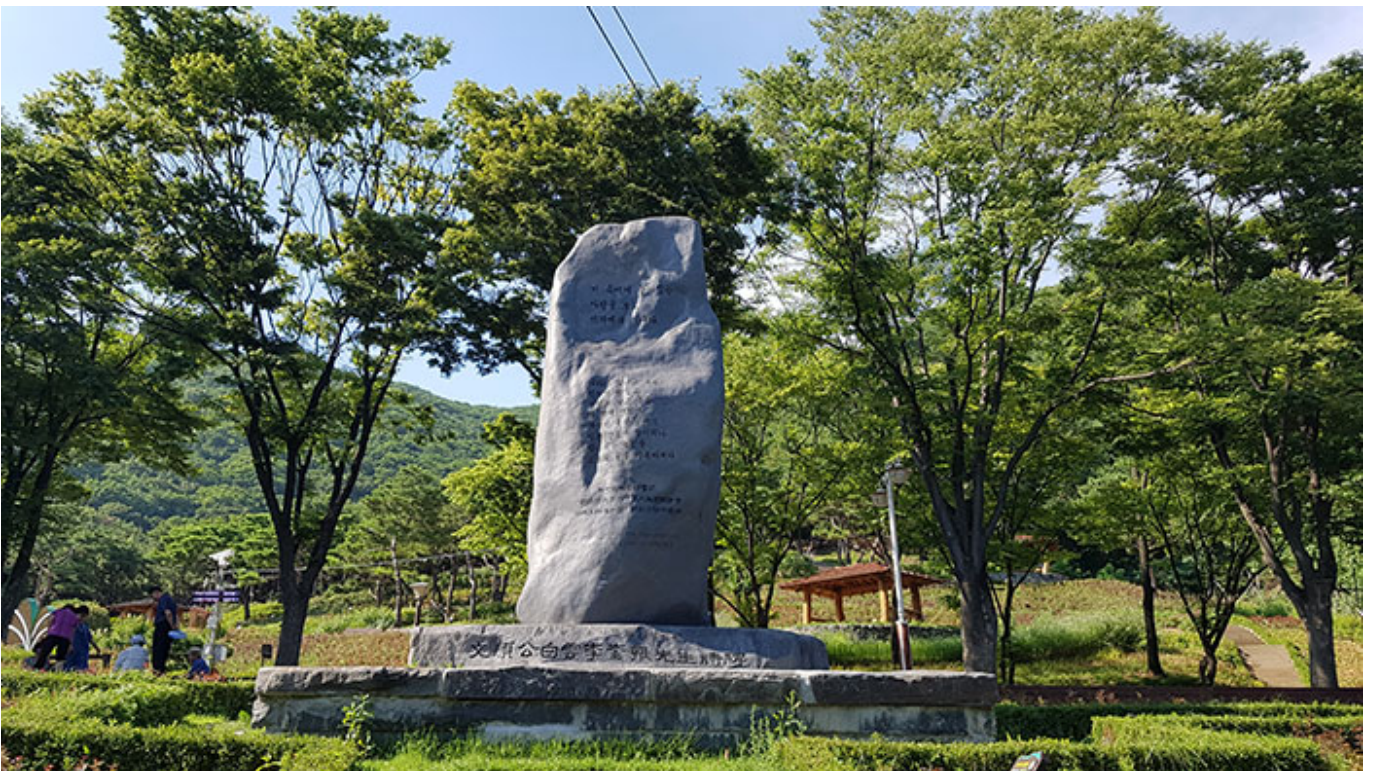
00:00 00:00 (00)

00:00:00 00 00 00:00 00 00:00 00:00 00:00 00 00. 00:00 00:00 00 11~14 00 00 00:00. 00 00:00 00 00:00 00:00 00:00 00 00:00 11~14:00 00:00 00:00 00 00:00 00:00 00:00. 00:00 00:00 00:00 00:00 00:00 00 00:00 00:00 00 0 00 11:00, 00 00 00:00 00:00, 00:00:00 00:00 12:00, 00:00 00 00:00 00:00 00:00 00:00 00 00