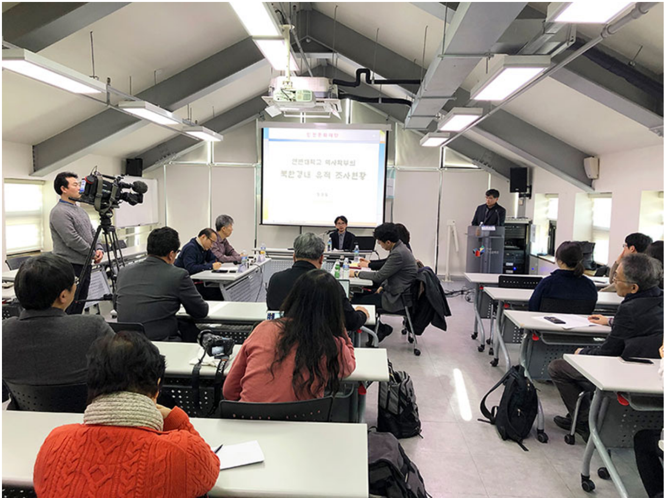
100인 100사(인문대학 석사학부)

한국과학기술원 KAIST의 '2021년 1학기 인문대학 석사학부'를 소개하는 영상 제작을 위한 회의가 진행되고 있다. 영상 제작팀의 구성원과 KAIST 관계자들이 참석하여, 이번 학기부터 시행되는 '100인 100사' 프로젝트를 소개하고, 이를 위한 영상 제작을 위한 계획과 일정 등을 논의하고 있다.