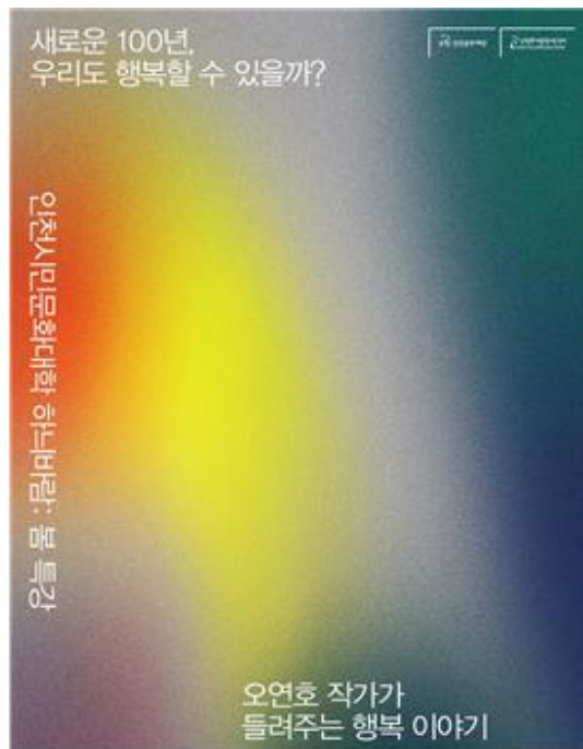
【○○】 ○○○○○○ ○○○○

○○○○ ○○○ ○○○○ 3○ 14○ ○○, ○○○○○○○○○ ○○○○ ○ ○○○○ ○○○○ ○○○○○○ ○○ ○○