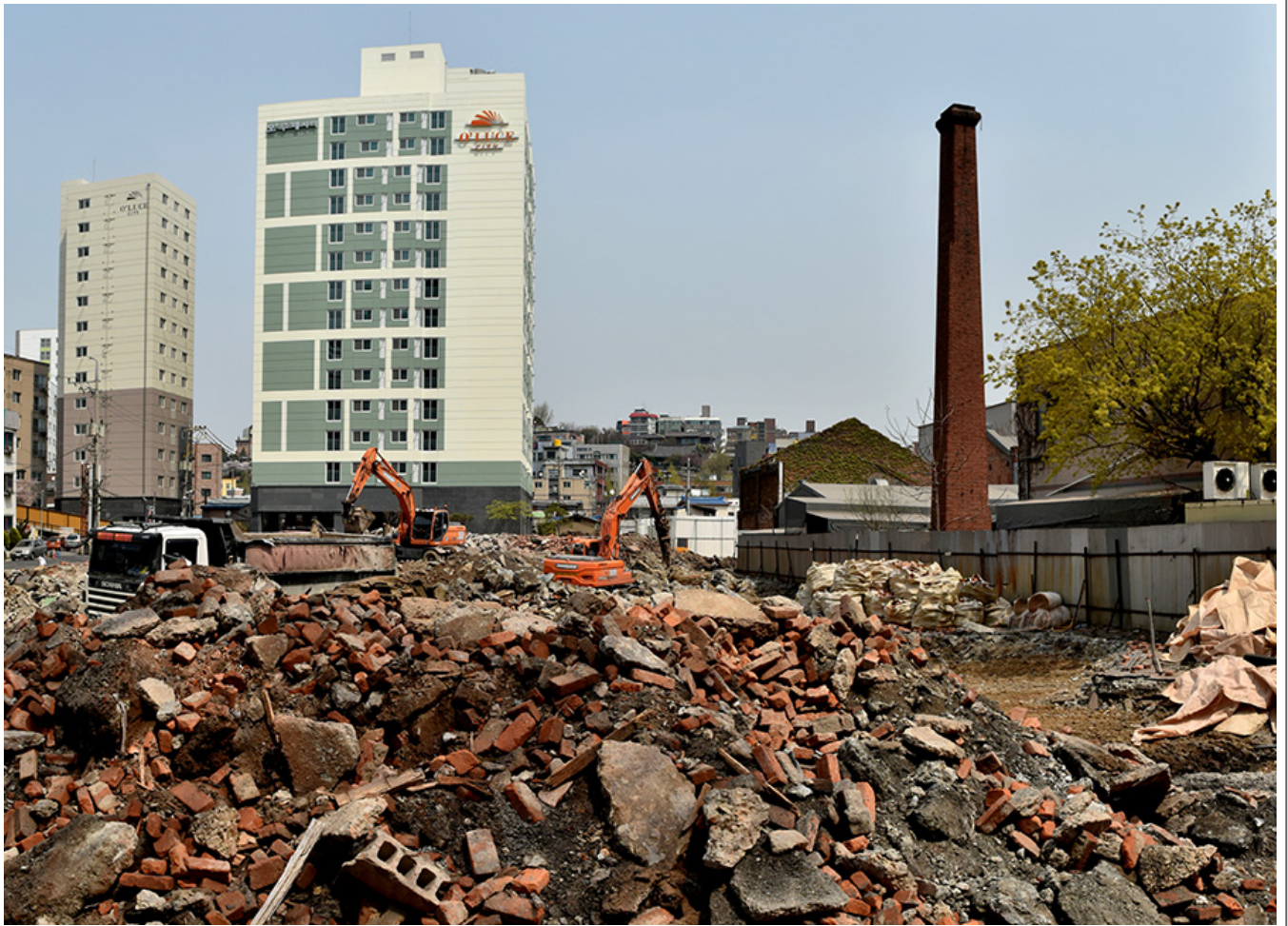
2020年4月 〇〇〇〇 〇〇〇〇〇〇 〇〇 〇〇 〇〇〇〇