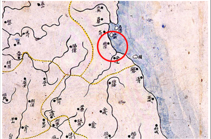
○○○○○ ○ ○○○ ○○ / ○○ : ○○○○○○