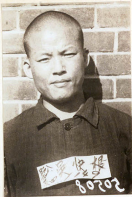
昭和16年8月4日 西大門刑務所 = 於テ撮影 保存原板(111)第 50508 號