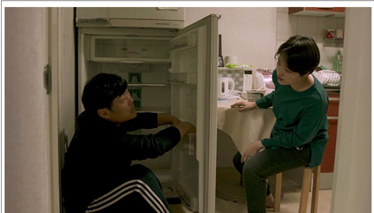
00 <00>0 0 00

“0000 00 0 00?” 000 000 000. 00000 000 000 0000000 0000 0000, 0 000 000 000 0 0000 0 00 0000 000. 00000 000 00000 00 000 00, 0 00 00 0000 000 0 00 00 0000. 00(000)0 00(000), 0 00 000 000 00 0. 000 0000 00 00 00, 000 000 000 00 0000 00 0000 00. 000 00 0 0 0 00 000 1000 0000 300000 000 00 00 000 00 0000 0000 000. 00 0 0000 000 000, 000 0 000 00 00 00 00 00 0000 0000 00 00000.