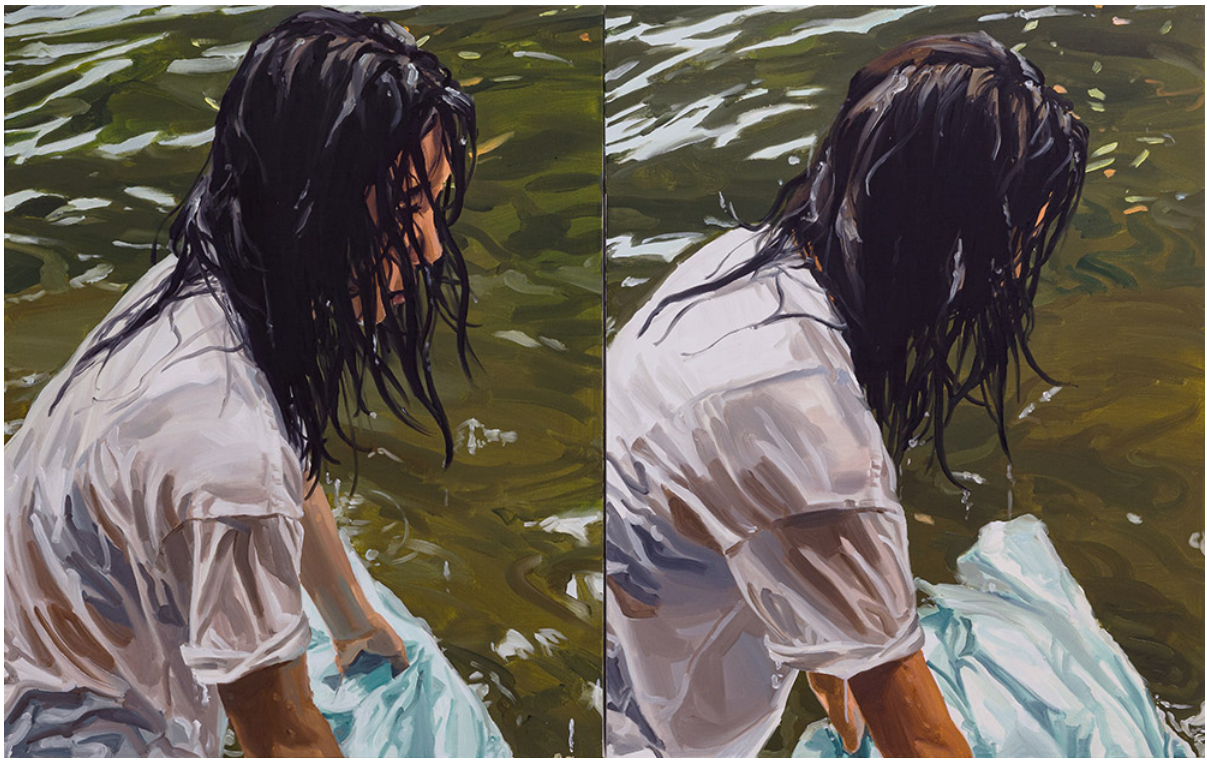
<Double Ripples>, 油畫 兩幅, 91×73cm(×2 pieces), 2021