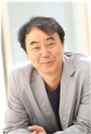
0/00 공연(공연. SONG YONGIL / 공연 사진)

공연문의는 02-550-0111로 문의하실 수 있다. 공연장소는 서울특별시 강남구 테헤란로 112번에 위치한 서울아트시어터이다.