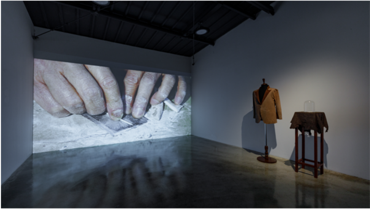
<인간>(Grinder), 한국, 비디오, FHD VIDEO 00:10:00, 2022

이 작품은 인간의 노동과 생산 과정을 탐구하며, 인간의 조건을 다룬다. 작품은 인간의 노동과 생산 과정을 탐구하며, 인간의 조건을 다룬다. 작품은 인간의 노동과 생산 과정을 탐구하며, 인간의 조건을 다룬다.