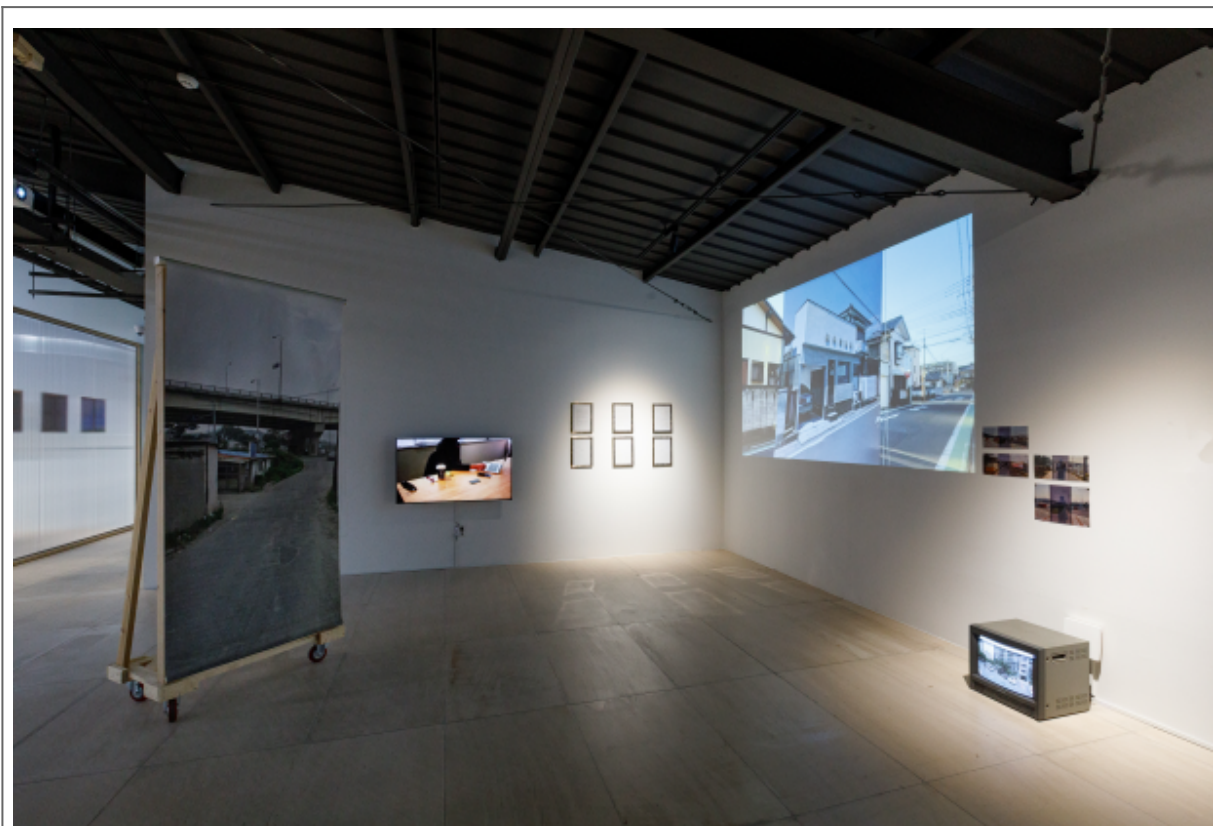
‘이-이 프로젝트’의 전시 모습

이것, 모든 것의 시작과 끝을 보여주는 것은 모든 것이 시작과 끝을 가지는 것, 모든 것이 시작과 끝을 가지는 것, 모든 것이 시작과 끝을 가지는 것, 모든 것이 시작과 끝을 가지는 것, 모든 것이 시작과 끝을 가지는 것, 모든 것이 시작과 끝을 가지는 것, 모든 것이 시작과 끝을 가지는 것, 모든 것이 시작과 끝을 가지는 것, 모든 것이 시작과 끝을 가지는 것, 모든 것이 시작과 끝을 가지는 것.