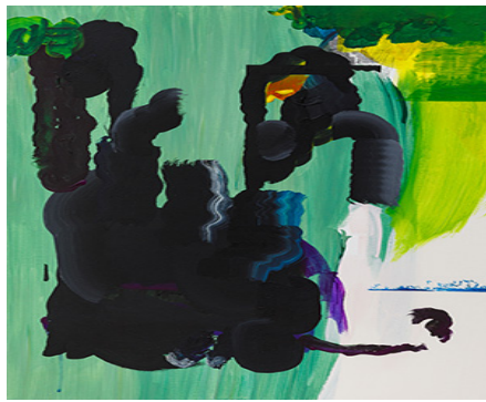
<□□(#□□□□, #□□□)>, □□□□ □□□, 65.1x53cm, 2022