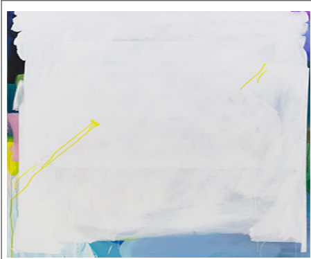
<□□(#1234)>, □□□□ □□□, 193.9x130.3cm, 2022

□□□ □□□ □□ □□ ‘□□□□ □ □ □□’ □□, □□ □□□, □□ □□□□ ‘□ □□□’□ □□□ □□ □□ □□ □ □□□□. □□□□ ‘□ □□ □ □□’ □□□ □□□ □□□, □□□□ □□□ □ □□□□□ □ □□□. □□□□ □□□ □□□ □□□, □□□ □□ □□□ □□□ □□ □□□□, □□□□ □□□□ □□□ □ □□□(imperfection is a higher value than perfection). □□, □□□□□ □□ □ □□□ □□□□, □□□ □□□ □□□□ □□□ □□□□□ □□. □□□ □□□□ □□ □□ □□□□□ □ □ □, □□□ □□□ □□□□ □□ □□, □□□ □□□□ □□□□ □□, □□□ □□□□ □□□□ □□□ □□□ □□□ □□□□□ (□□□□□ □□□□ □□□) □□□□ □ □□□□.