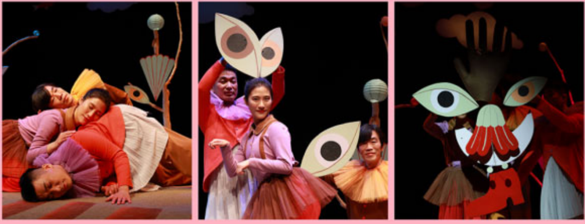
<무궁화> 공연 사진 (좌 : 무궁화, 우 : 무궁화)

<무궁화>는 2019년 10월 10일부터 11월 10일까지 3주간 공연될 예정이다. 공연 시간은 오후 7시 30분이다. 공연장소는 서울특별시 강남구 테헤란로 112번에 위치한 서울아트시어터이다.