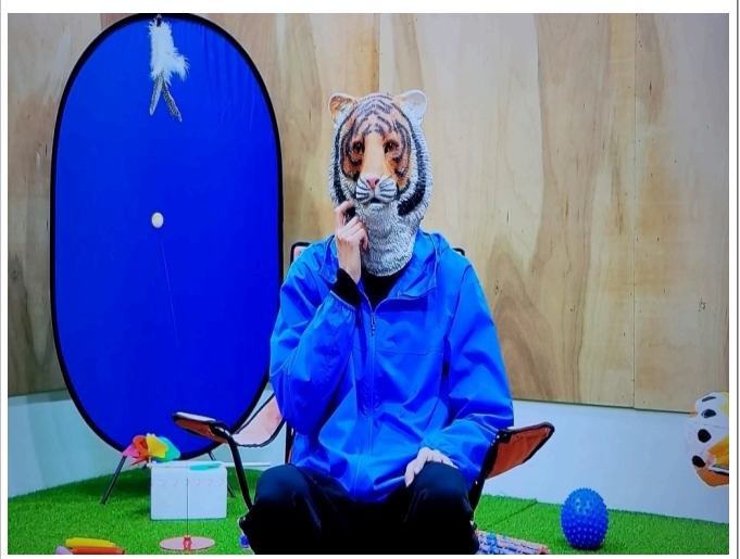
<무엇도 없다>, 2022