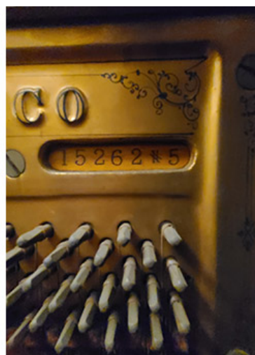
特許取得済みの機械式暗号機

この特許は、Sohmer & Co.によって取得された。この特許は、1888年に取得された。この特許は、1887年3月8日に取得された。この特許は、1887年3月8日に取得された。