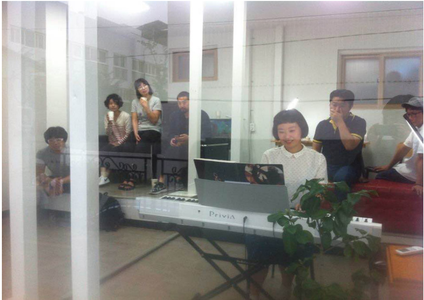
2017년 잠복자들의 <금손 피아노> 오픈식 사진

이제부터 시작합니다. 오늘, 우리, 함께 하는 모든 순간이 모두 소중한 순간이 되기를 바랍니다. 오늘, 우리, 함께 하는 모든 순간이 모두 소중한 순간이 되기를 바랍니다, 오늘, 우리, 함께 하는 모든 순간이 모두 소중한 순간이 되기를 바랍니다, 오늘, 우리, 함께 하는 모든 순간이 모두 소중한 순간이 되기를 바랍니다, 오늘, 우리, 함께 하는 모든 순간이 모두 소중한 순간이 되기를 바랍니다.