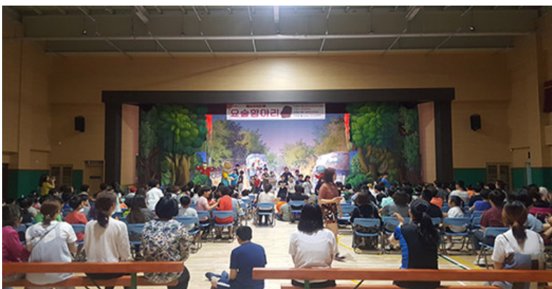
2017 찾아가는 문화활동 - 사랑극단 꼬마세상

이 프로그램은 지역 주민들이 함께 참여하여 문화생활을 즐기도록 하는 데 목적이 있다. 특히, 노인층을 대상으로 한 문화활동은 노인들의 삶의 질을 향상시키고, 사회적 교류를 증진시키는 데 크게 공헌한다. 또한, 지역 사회의 문화적 분위기를 조성하고, 주민들의 자발적인 참여를 유도하는 데도 크게 공헌한다.