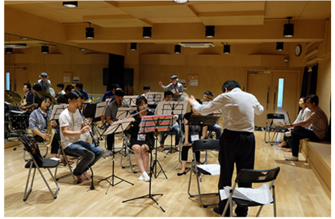
2017 인천왈츠 연주팀 연습장면