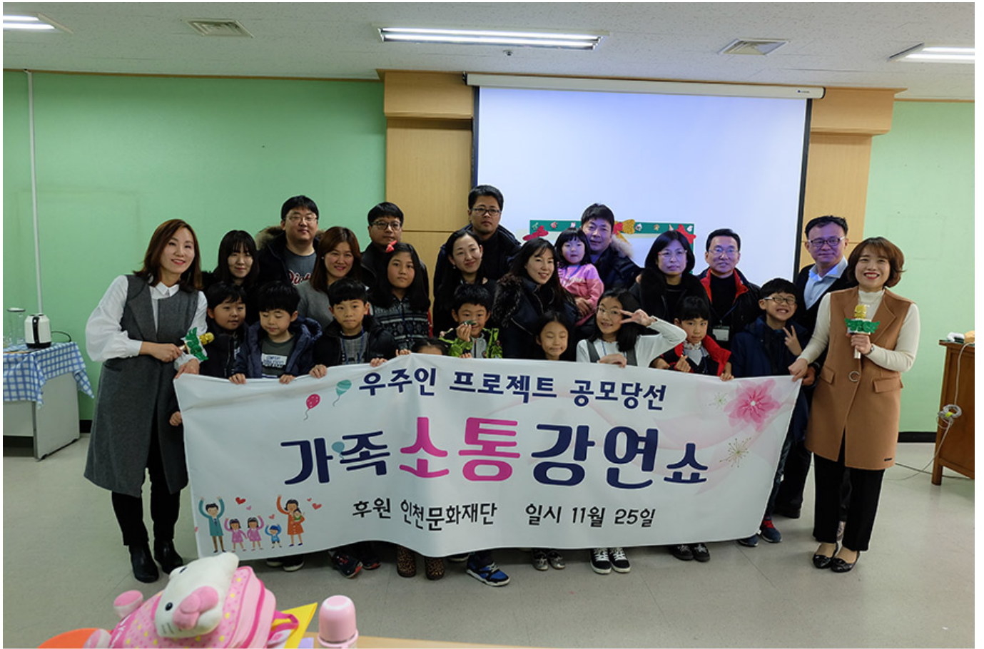
사춘기 아이를 둔 주부가 아이를 위해 같은 고민을 가진 가족들을 모집해 소통하는 강연 쇼를 개최한 우주인