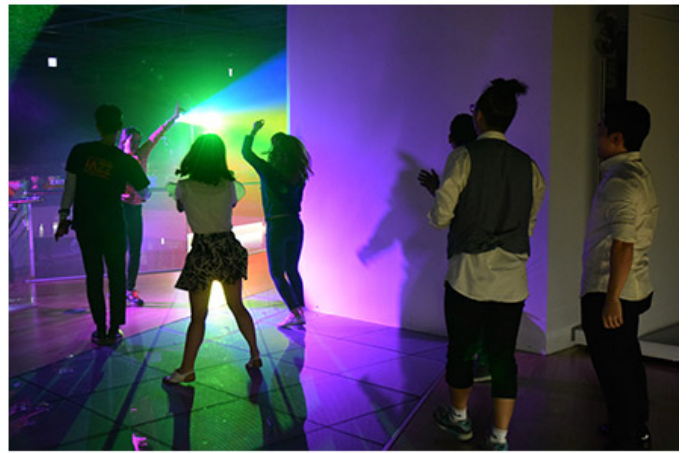
2016 트라이보울 재즈페스티벌 파티행사

2016년 10월 28일부터 30일까지 3일간 서울특별시 강남구 삼성동 코엑스 컨벤션홀에서 개최된 '2016 트라이보울 재즈페스티벌'은 국내외 재즈 뮤지션들의 열띤 공연과 함께 다양한 문화 프로그램을 선보여 큰 성공을 거두었다. 특히, 이번 축제에는 '오리엔탈 쇼커스'와 '와러씨커스' 등 젊은 재즈 뮤지션들의 활약이 돋보였으며, '2016 트라이보울 재즈페스티벌 파티행사'는 관객들의 열광적인 반응을 이끌어냈다. 또한, '2016 트라이보울 재즈페스티벌 메인무대'에서는 국내외 유명 재즈 뮤지션들의 열띤 공연이 펼쳐졌으며, '2016 트라이보울 재즈페스티벌 파티행사'에서는 다양한 문화 프로그램이 선보여 관객들의 흥미를 끌었다.