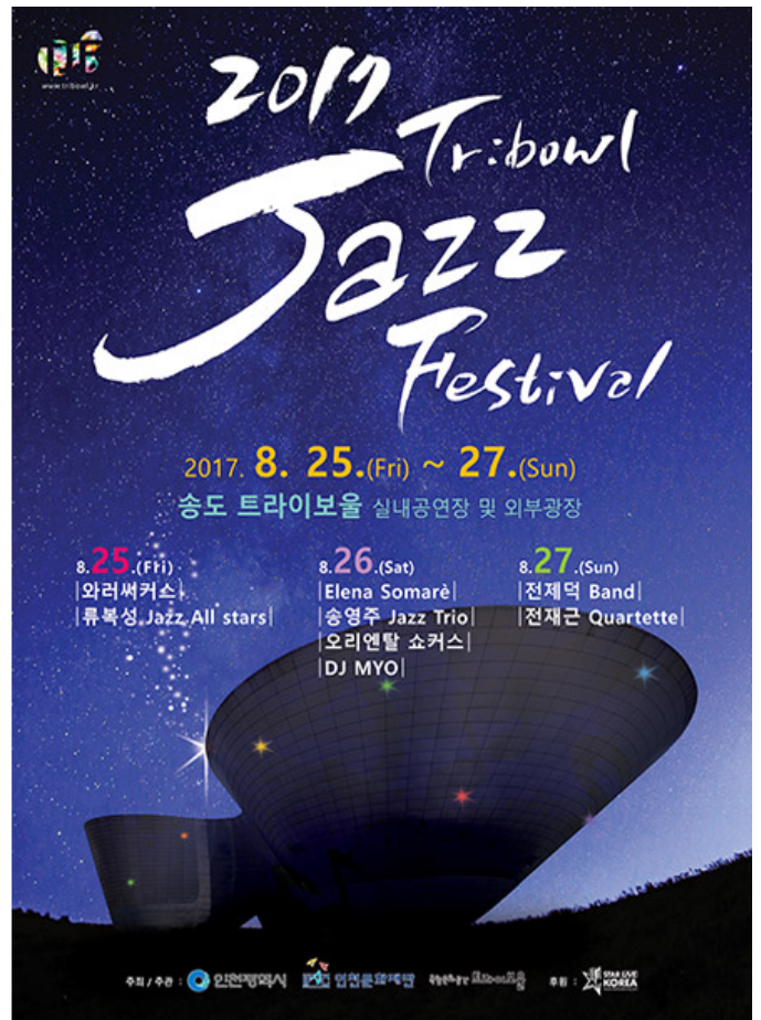
2017 트라이보울 재즈페스티벌 포스터

□□ □□□□□ □□□□ □□ □□□□□ □□ □□ 1□□, □□□□ □□□□ □□ 60□□□□ □□ □□□□