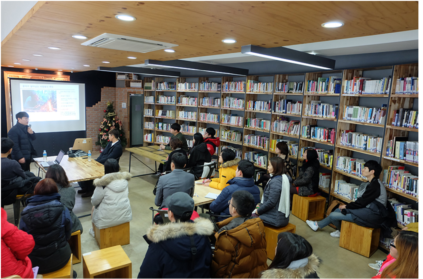
평소 관심 있었던 '디지털 노마드' 작가를 섭외해 직접 강연회를 열고 시민들과 지혜를 나눈 우주인