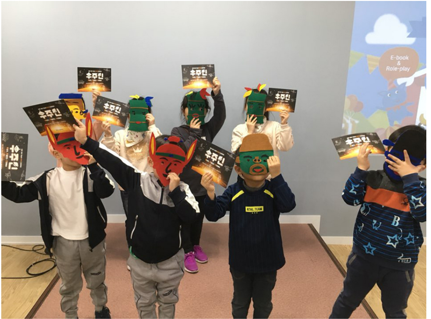
영어를 잘하는 아빠의 재능을 살려 이웃 아이들과 영어연극을 활동한 우주인