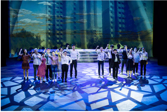
2016 인천왈츠 '1936, 그날' 공연사진