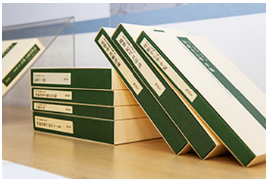
우현 고유섭 전집