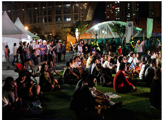
2016 트라이보울 재즈 페스티벌 야외 프로그램

오가람 “오가람” 쿼텟, “오가람 쿼텟”, “오가람 쿼텟”, “오가람” 쿼텟