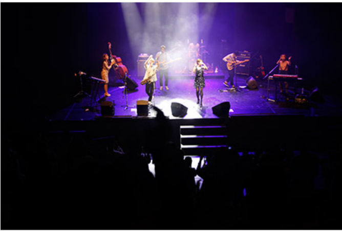
2016 트라이보울 재즈페스티벌 메인무대