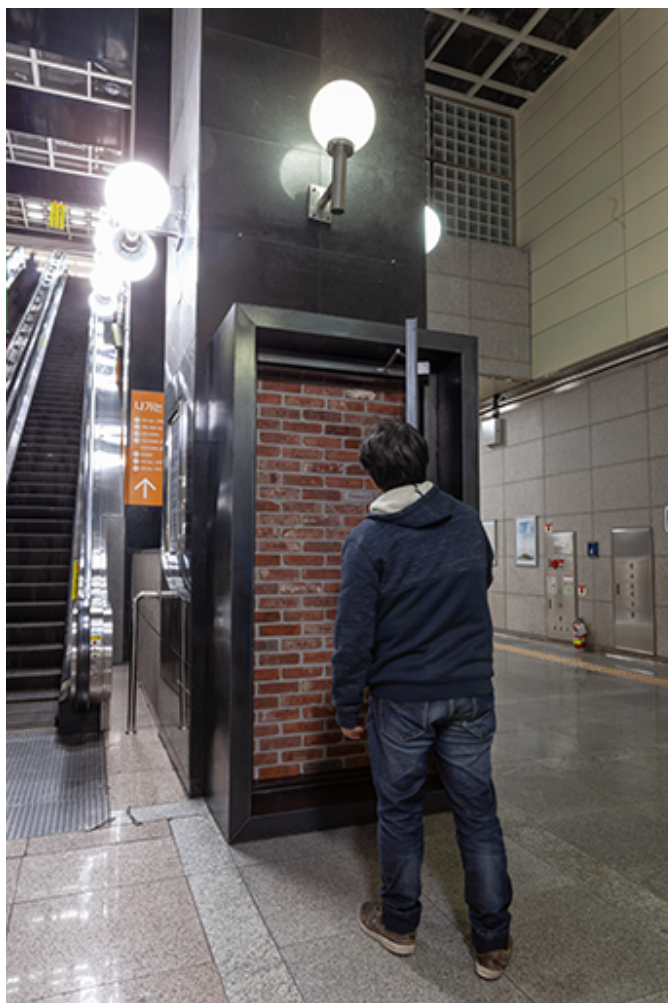
김승영, 당신은 당신으로부터 자유롭습니까, 240x130x60cm, 철, 단어가 새겨진 고벽돌, 2018