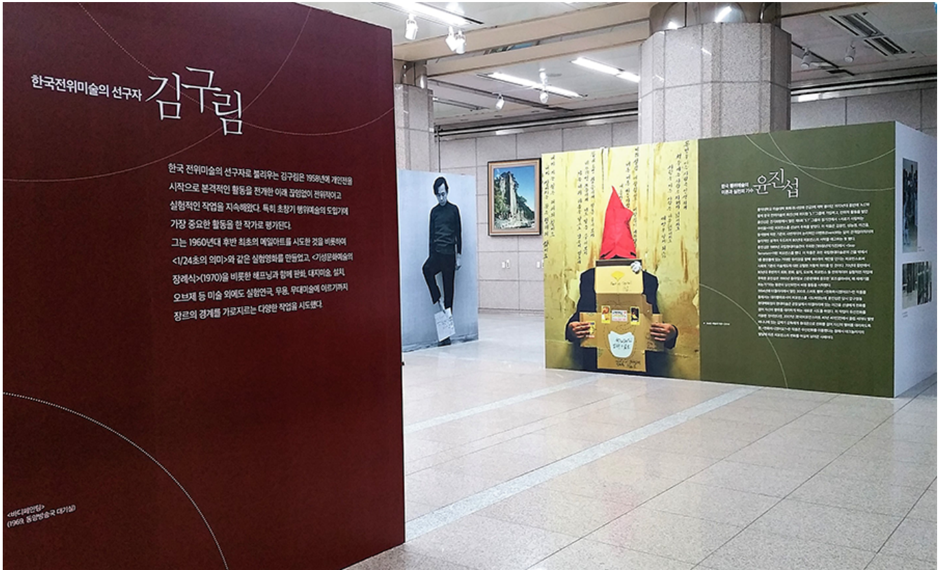
한국전위미술의 선구자 김구림