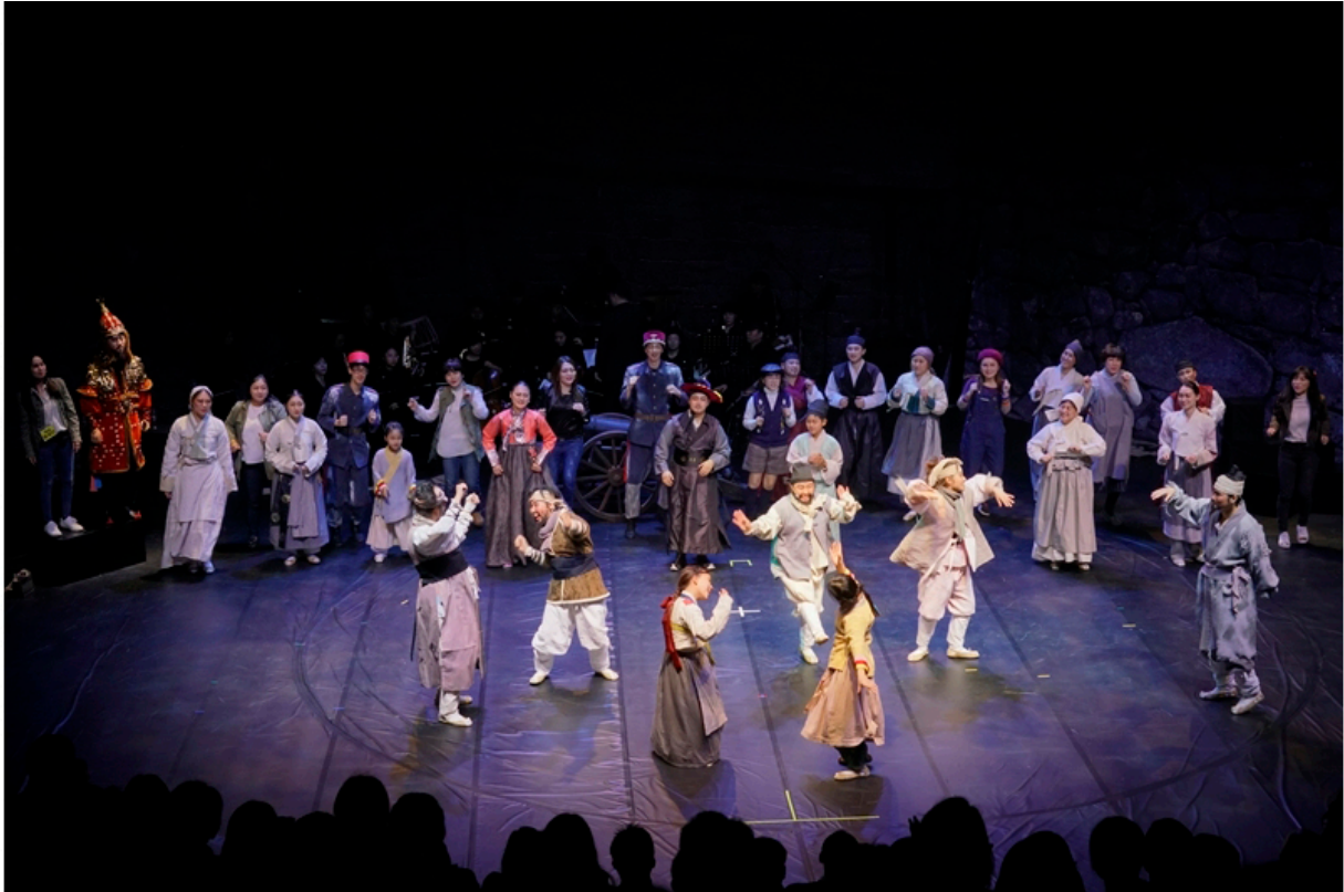
2018 年 韩国 传统戏剧 <汉, 1866 年 汉>