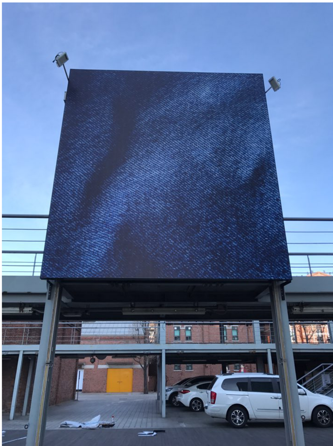
새로운 비행기, 다큐(영화), 미국, 1991

이 작품은 1991년 제작된 다큐멘터리이다. 제목 “새로운 비행기”는 당시 미국에서 발생한 테러 사건을 배경으로, 새로운 비행기 <The New Plane>가 어떻게 개발되고 있는지, 그리고 6명의 승객(미국인, 영국인, 프랑스인, 독일인, 이탈리아인, 일본인)이 어떻게 비행기를 타고 여행하는지를 보여준다. 이 작품은 당시의 사회적 분위기를 잘 반영하고 있다.