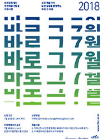
2015~2018년 바로그 자원 '바로그'에, 바로그 홈페이지에 게시된 바로그 소개를 꼭 읽어주세요?