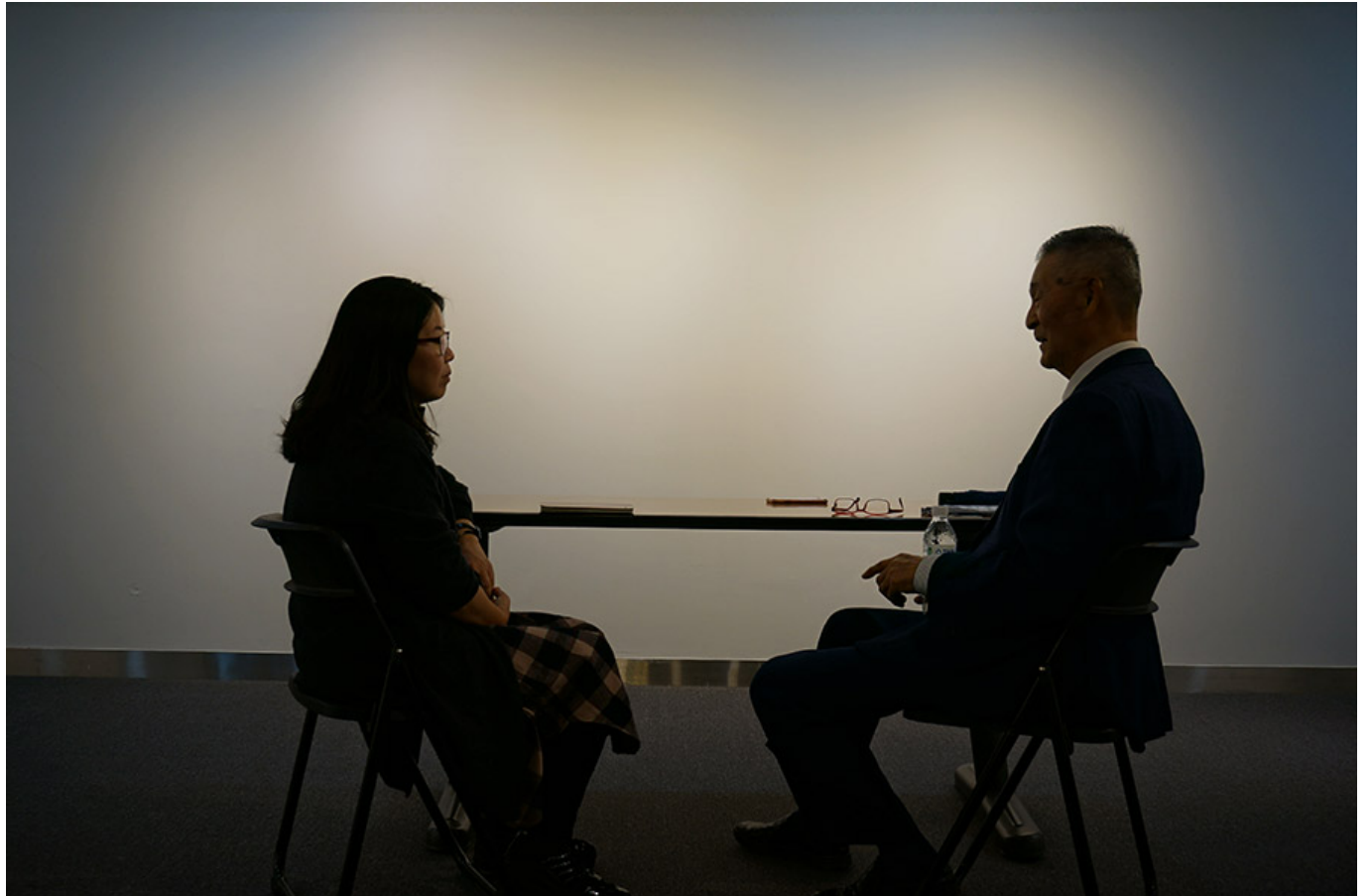
2018.10.18 <sing along> 000 000 000 000 00000 00000.

0 0000 00 00 000 00 0 000. 00 00000 000 00 000 0000 0000. 000 000000 000 00 00000000 000 000 000 000 000 000 000 00 00 000 000 00 0 000. 00 000 00 0000 00 000 0 00 000.