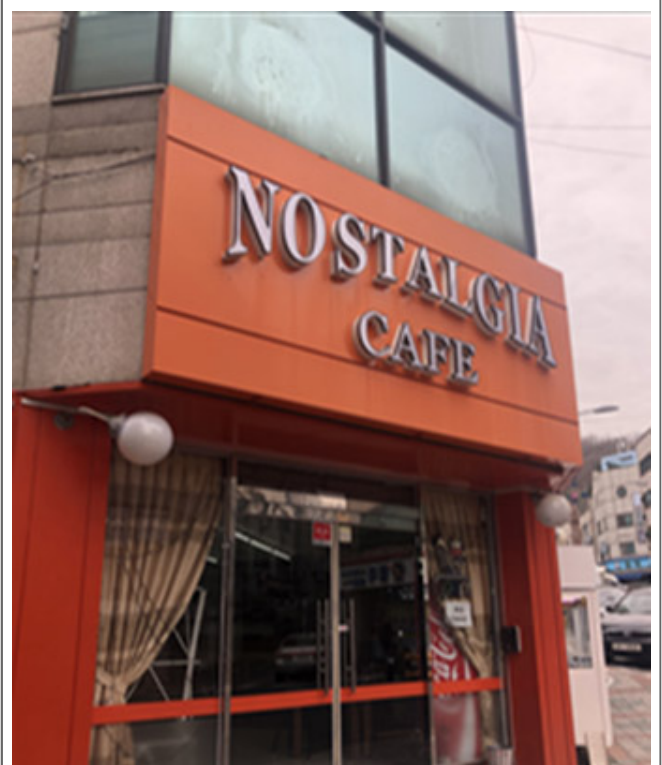
☐ · ☐☐ / ☐☐☐(☐☐☐, Park Bong Su) ☐☐☐☐, ☐☐☐☐☐☐☐☐ ☐☐, ☐☐☐☐☐☐☐☐☐☐☐☐