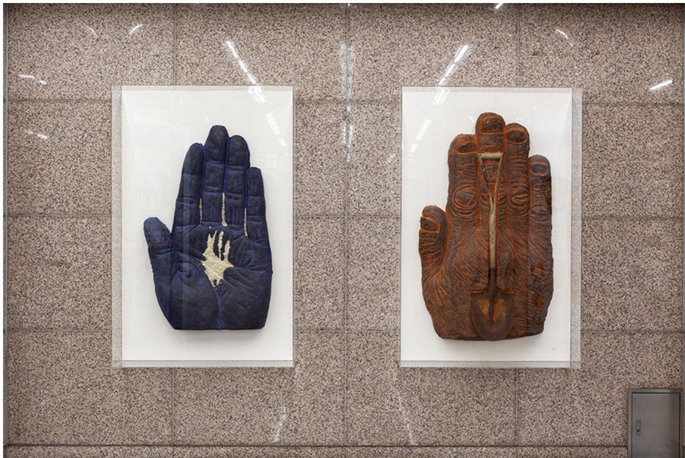
장갑, 장갑, 105x70x10cm, 장갑 장갑(장갑), 2005장갑 장갑, 113x75x15cm, 장갑 장갑(장갑), 2005