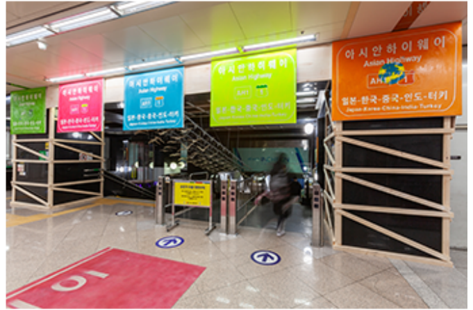
아시아 하이웨이, 2018