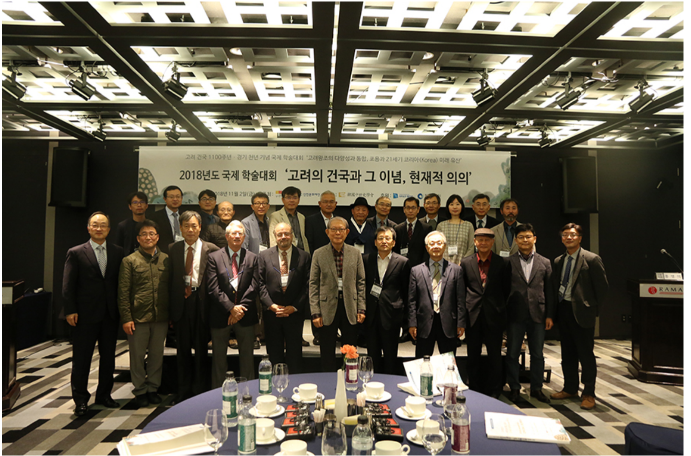
2018년도 국제 학술대회 기념 촬영