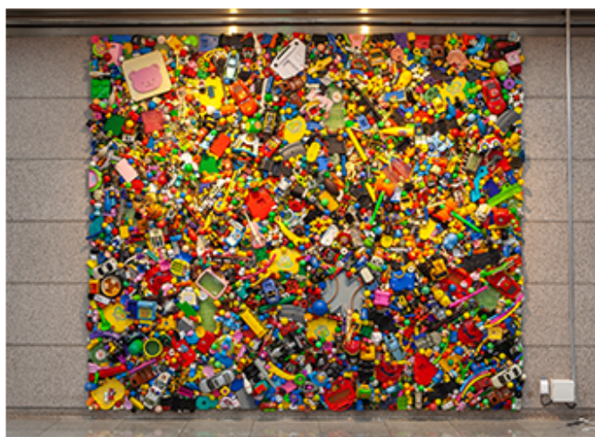
김용철, 사용된 꿈-지표, 400x350cm, 사용된 장남감들, 2018