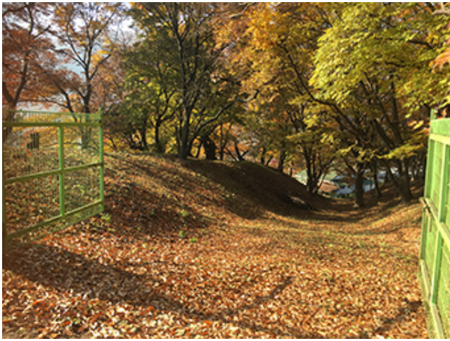
80년 된 나무의 낙엽