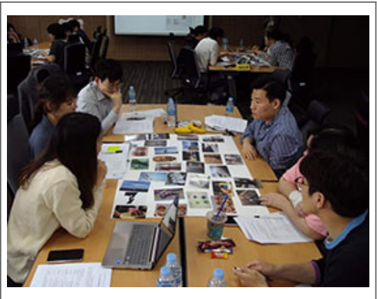
프로그램 소개 청년 참여

Q. 이번 프로그램의 주요 내용은 무엇인가요? A. 이번 프로그램은 크게 3가지 주제로 구성되어 있습니다. 첫째, 창업 관련 내용은 '청년창업의 이해'와 '투자 유치 전략'을 포함합니다. 둘째, 취업 관련 내용은 '취업 트렌드 분석'과 '자기소개서 작성법'을 다룹니다. 셋째, 문화 및 스포츠 관련 내용은 '지역 문화 탐방'과 '스포츠 마케팅'을 포함합니다.