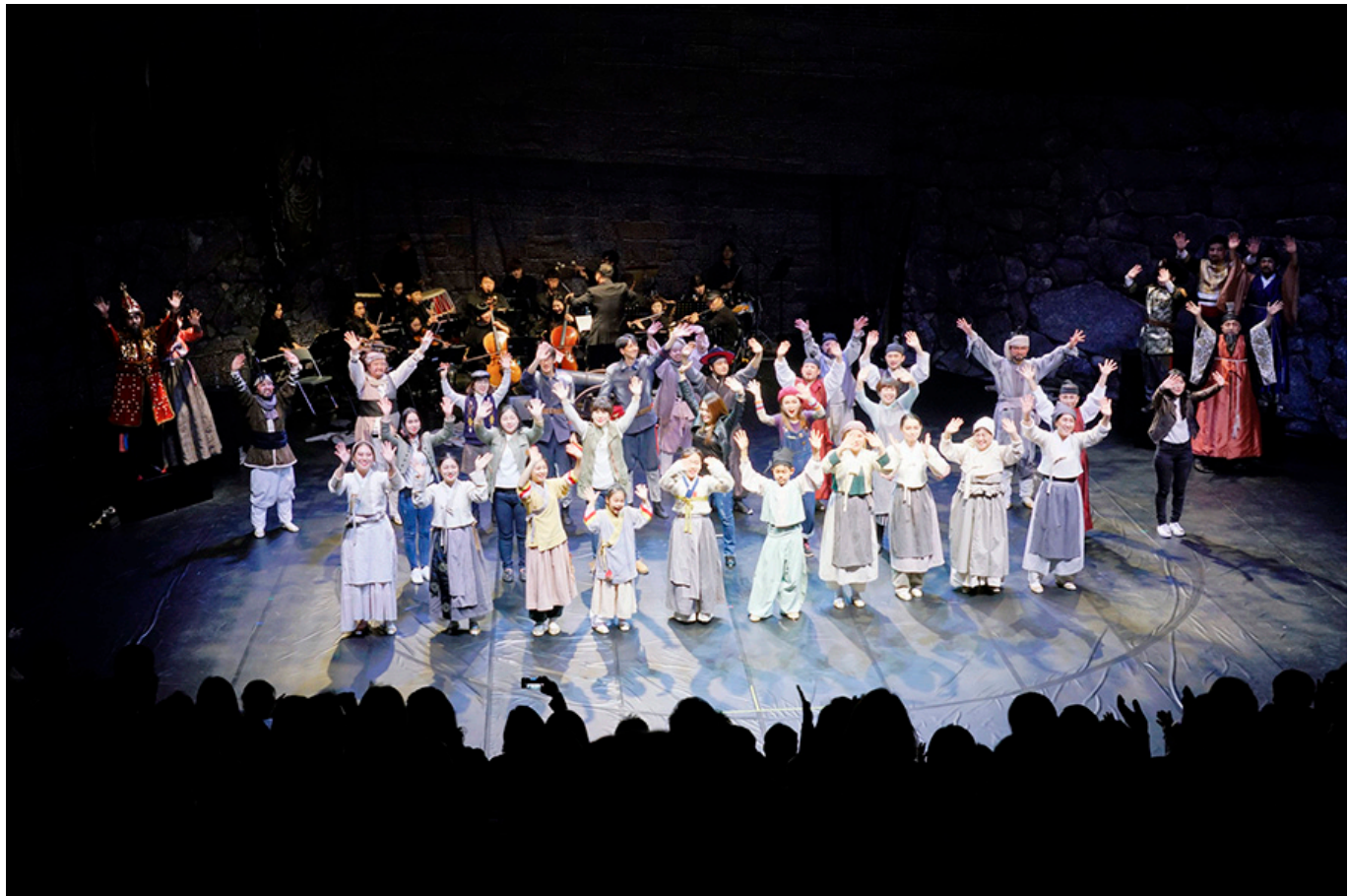
2018 관악구<신림동 1866 문화축제> 공연 모습 (관악구 : 신림1동)

2018년 10월 18일부터 20일까지 서울특별시 관악구 신림동 신림1동 주민센터 대강당에서 열린 '2018년 관악구 신림1동 주민센터 대강당 공연'의 모습입니다. 공연은 관악구 신림1동 주민센터 대강당에서 열렸으며, 관악구 신림1동 주민센터 대강당에서 열렸으며, 관악구 신림1동 주민센터 대강당에서 열렸습니다.