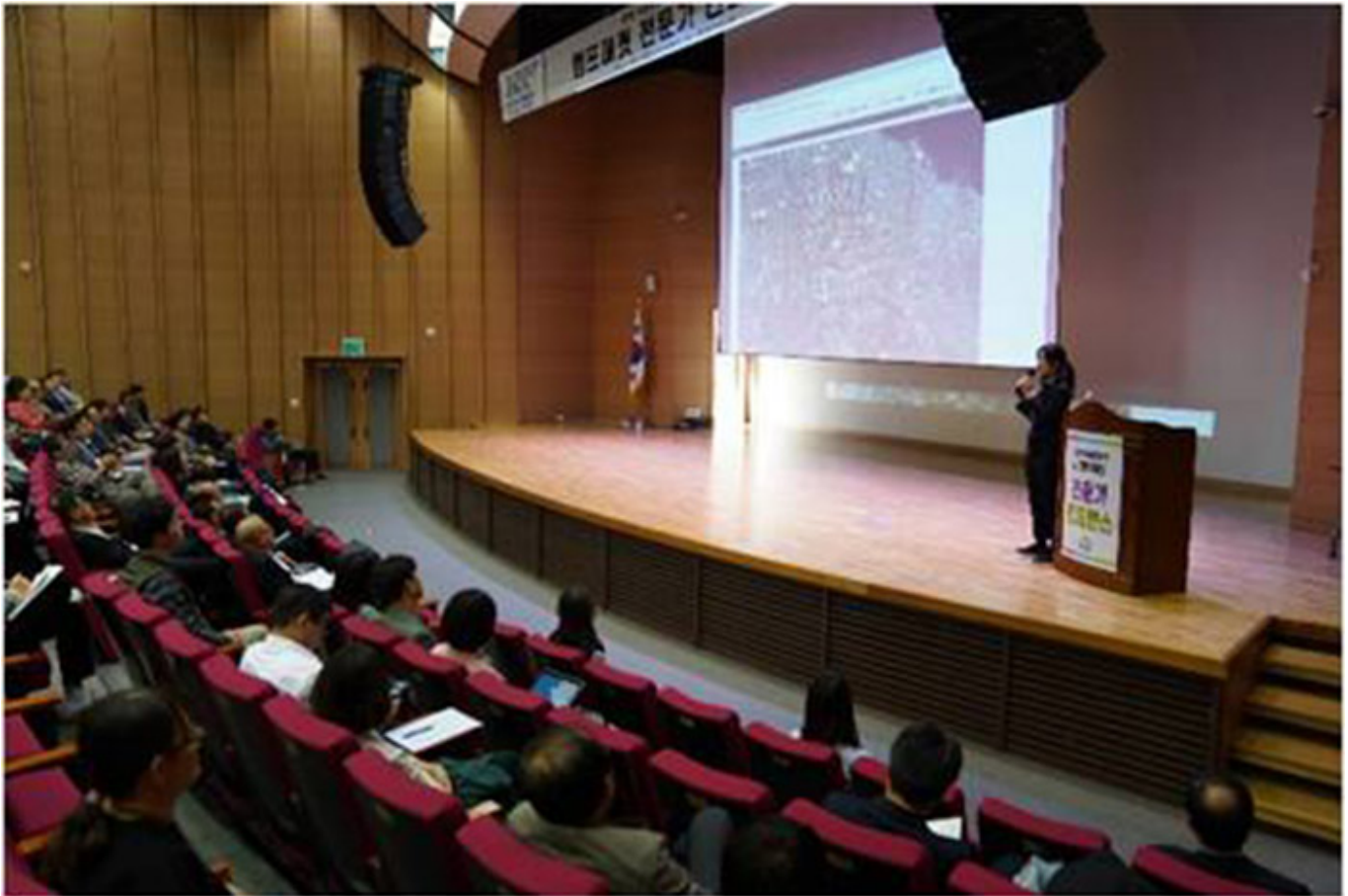
그림 2. 2019년 11월 2일 서울대학교에서 열린 '2019년 11월 2일 서울대학교에서 열린' 행사에서 강연을 하고 있는 모습