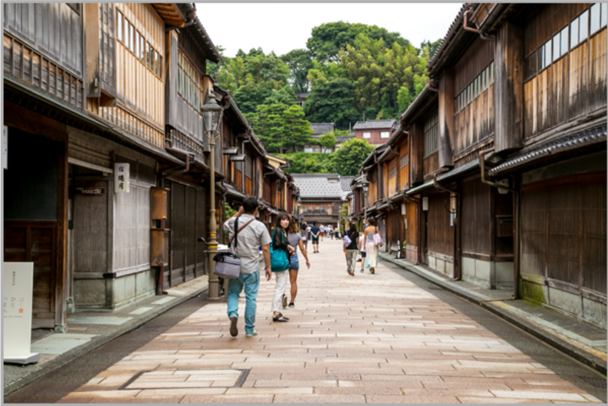
가나자와 전통거리 / 여행사12go

0000 000 00 0000. 00 0000 00 000 000 00 000 0000 0 000 00 0000 0 000 0000 000? 00 0000. 00 00 0000 0000 000 000 0000 000 00 0 00 000 00. 000 000 000 00000, 000 0000 000 000, 00 000 000 000 0000 0 000 0 0 00. 000 0000 0000000, 000 00 00 00, 00 000 30 00 0 000 000 0000 0000 000 0000 000000 00 00 000000 0000 000 0000 0 0 00. 00 000 000 000 00 0, 00 0000 000 000000 0 000 00 000 00 0 00 00 000 0000 00 000 000 000. 0000 00 0000 000 000 00, 00 000 00 00 000000 000 000 000 00 0000.