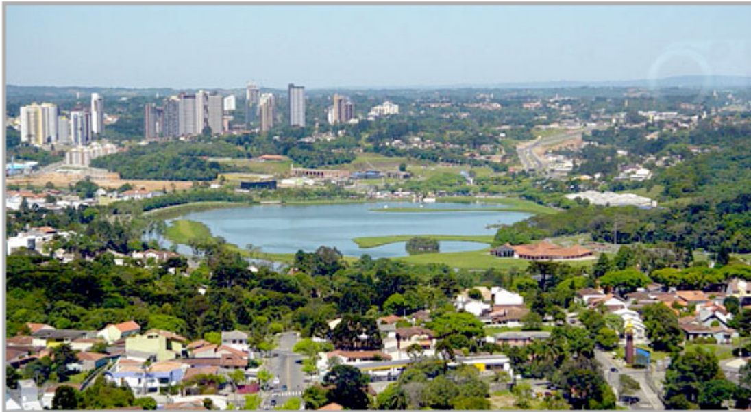
브라질 쿠리찌바 전경

쿠리찌바는 도시를 계획했다. 쿠리찌바는 도시를 '쿠리찌바'의 계획된 도시를 도시 2025년 12월 도시 도시 도시 도시. 이 도시 도시 도시 이 도시 도시 도시 도시 도시 도시 도시 도시 12월 도시 도시 도시. 도시 도시 도시 도시 도시 도시 도시 도시 도시(Top-down) 도시 도시 도시 도시 도시. 도시 도시 도시 이 도시 도시 도시(Curitiba) 도시 도시 도시, 도시 도시 도시 도시 도시 도시 도시 도시 도시 도시, 도시 도시 도시 도시 도시 이 도시 도시 도시 도시 도시. 도시 도시 도시 이, 도시 도시 도시 도시 도시 도시 도시 도시 도시. 이 이 도시 도시 도시 도시 도시 도시 도시, 도시 도시 도시 도시 도시, 도시, 도시 도시 도시 도시 도시 도시. 이 도시 도시 도시 도시 '도시 도시' 도시 도시 도시. 이 도시 도시 도시 도시 도시 도시 도시 이 도시, 도시, 도시 도시 이 도시 도시 도시 도시 도시 도시 도시 도시 도시 도시 도시 도시. 도시 도시 도시 도시 도시 도시 도시 도시 도시 도시 도시 도시, 도시 도시 도시 도시 도시 도시 도시 도시 도시. 도시 도시 도시 도시 도시. 도시 도시 도시 도시 도시 도시 도시 도시, 도시 도시 도시 도시 도시 도시 도시 도시 도시 '도시' 도시 도시 도시 도시 도시 도시 도시 도시 도시 도시.