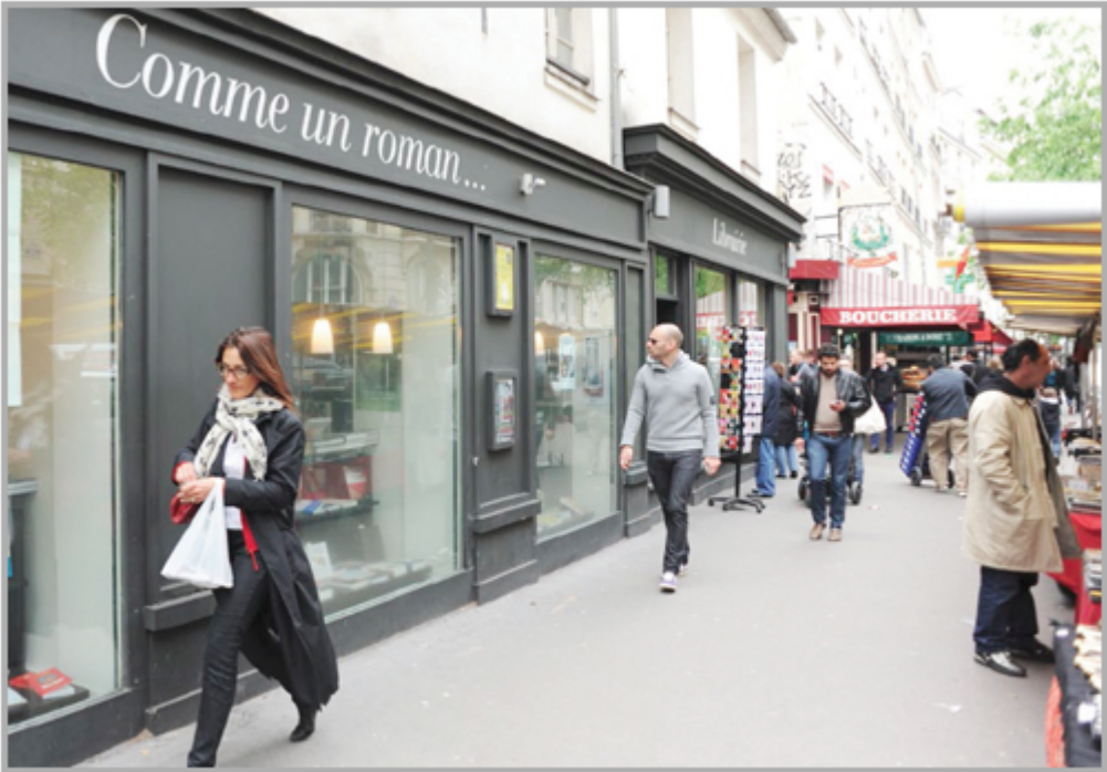
프랑스 파리 상점가 / 세마에스트(SEMAEST)

프랑스 파리 상점가 / 세마에스트 (SEMAEST)는 프랑스의 대표적인 상점가 중 하나입니다. 이 상점가는 프랑스의 문화와 역사를 보여주는 다양한 상점과 레스토랑이 모여 있습니다. 이 상점가는 프랑스의 문화와 역사를 보여주는 다양한 상점과 레스토랑이 모여 있습니다. 이 상점가는 프랑스의 문화와 역사를 보여주는 다양한 상점과 레스토랑이 모여 있습니다.