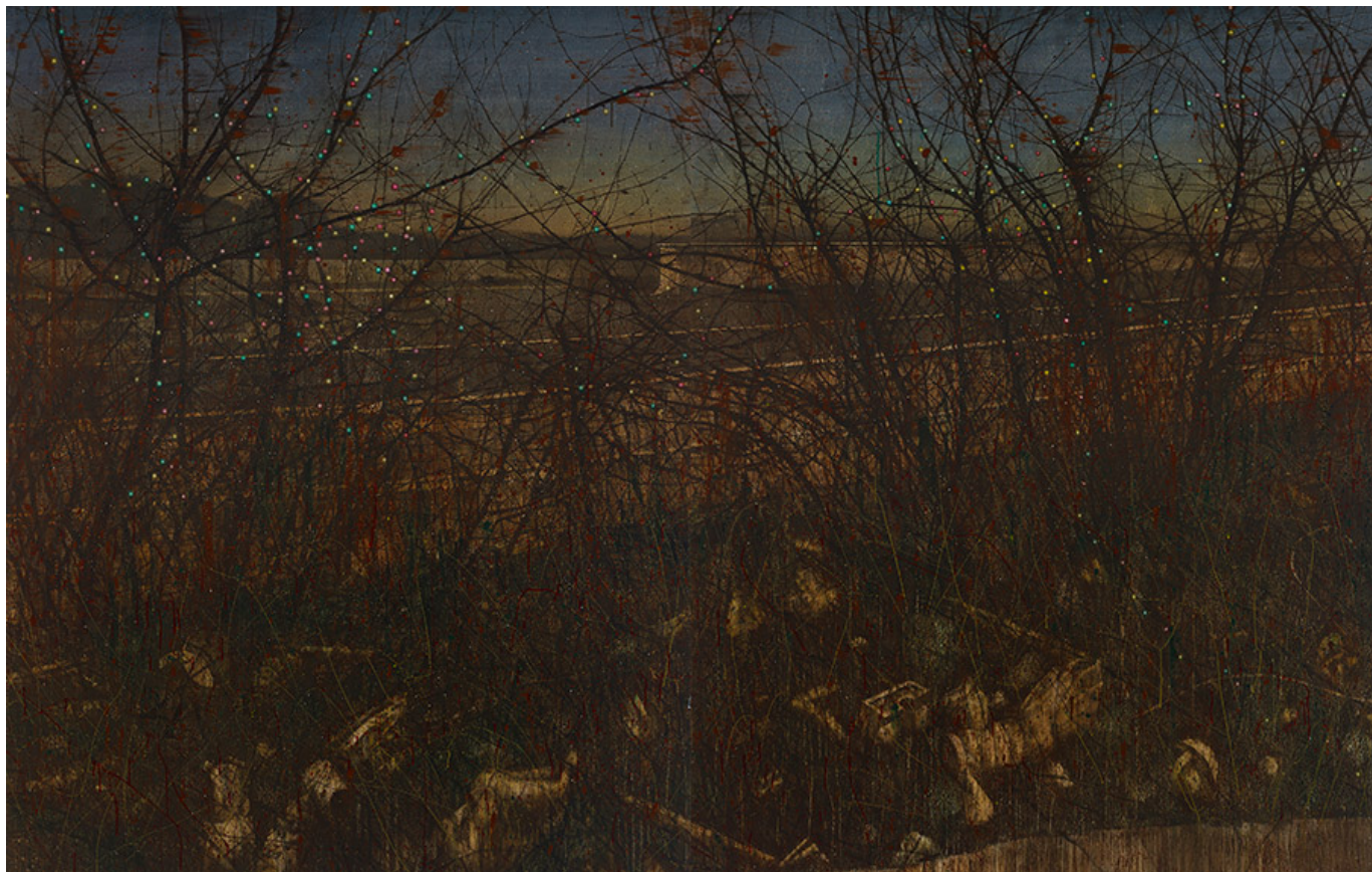
□□, 230x360cm, acrylic on canvas, 2016