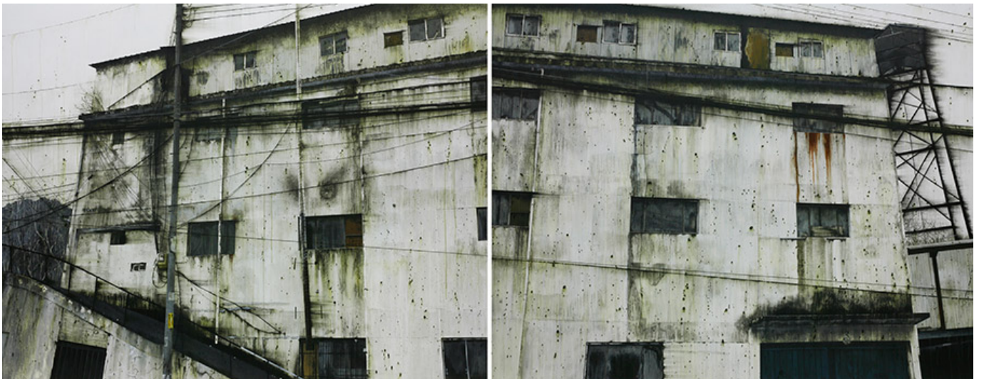
factory, 180x460cm, acrylic on canvas, 2017