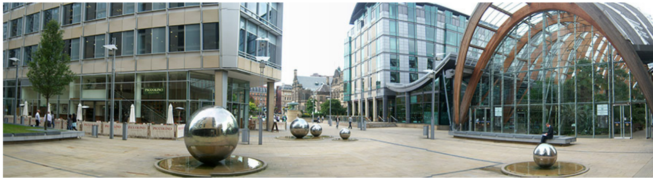
셰필드의 밀레니엄 광장과 겨울정원

도시 계획은 도시 공간의 질을 높이고, 도시 공간의 지속 가능성을 높이는 데 기여한다. 도시 계획은 도시 공간의 질을 높이고, 도시 공간의 지속 가능성을 높이는 데 기여한다. 도시 계획은 도시 공간의 질을 높이고, 도시 공간의 지속 가능성을 높이는 데 기여한다. 도시 계획은 도시 공간의 질을 높이고, 도시 공간의 지속 가능성을 높이는 데 기여한다. 도시 계획은 도시 공간의 질을 높이고, 도시 공간의 지속 가능성을 높이는 데 기여한다.