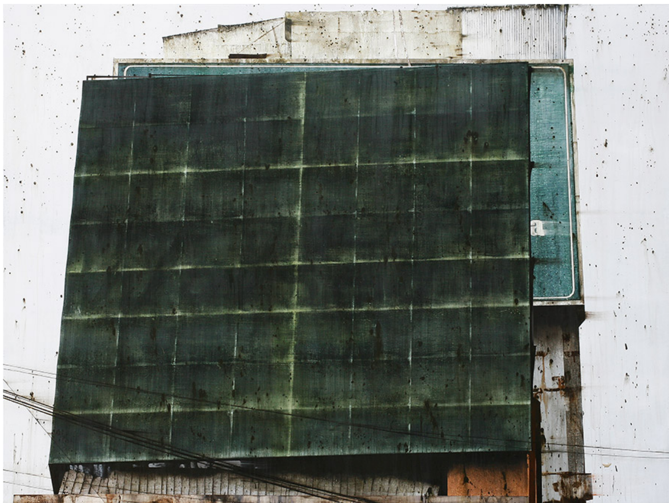
Grid, 135x180cm, acrylic on canvas, 2016