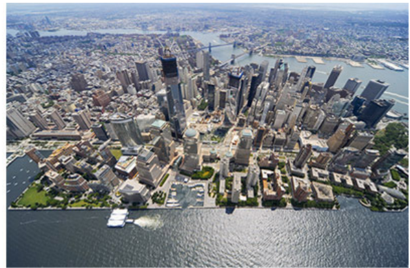
항만재개발로 건설된 맨하타의 배터리 파크 시티

도시의 경쟁력은 '인재'의 집중에 달려 있다. 2000년대 이후에는 인적 자원의 집적이 도시의 경쟁력을 결정하는 주요 요인이 되었다. 도시의 경쟁력을 높이기 위해서는 '인재 유치'에 중점을 두어야 한다. 인재 유치를 위해서는 도시의 생활 환경을 개선하고, 도시의 안전을 강화하며, 도시의 인프라를 확충하는 등 다양한 노력을 기울여야 한다. 또한, 도시의 경쟁력을 높이기 위해서는 도시의 혁신 생태계를 조성하고, 도시의 혁신 역량을 강화하는 등 다양한 노력을 기울여야 한다. 도시의 경쟁력을 높이기 위해서는 도시의 혁신 생태계를 조성하고, 도시의 혁신 역량을 강화하는 등 다양한 노력을 기울여야 한다. 도시의 경쟁력을 높이기 위해서는 도시의 혁신 생태계를 조성하고, 도시의 혁신 역량을 강화하는 등 다양한 노력을 기울여야 한다. 도시의 경쟁력을 높이기 위해서는 도시의 혁신 생태계를 조성하고, 도시의 혁신 역량을 강화하는 등 다양한 노력을 기울여야 한다.