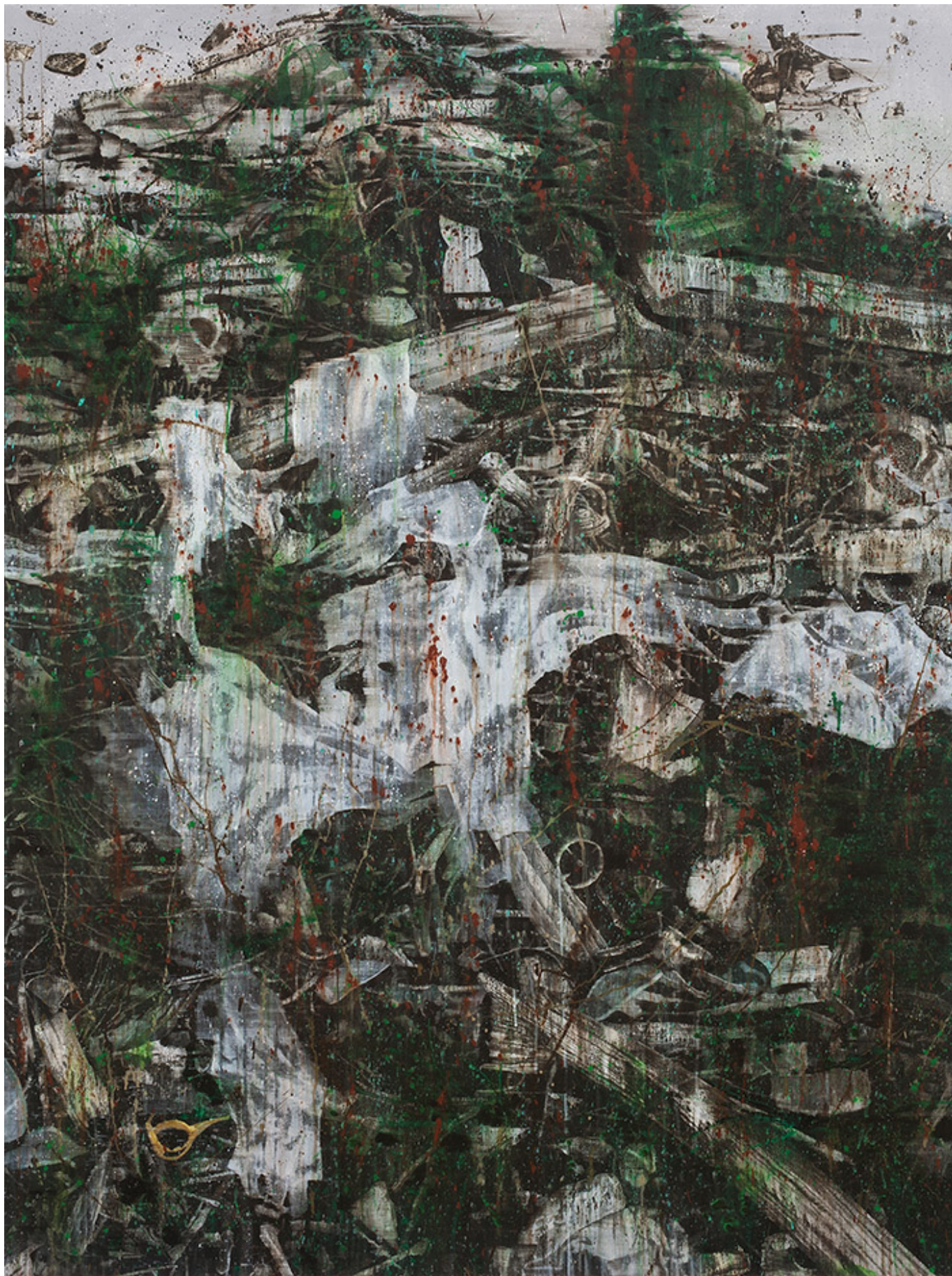
□□□, 180x135cm, acrylic on canvas, 2016