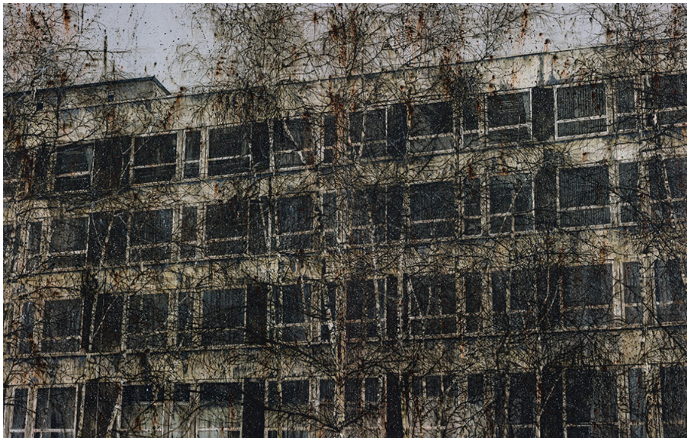
□□□□, 135x180cm, acrylic on canvas, 2016