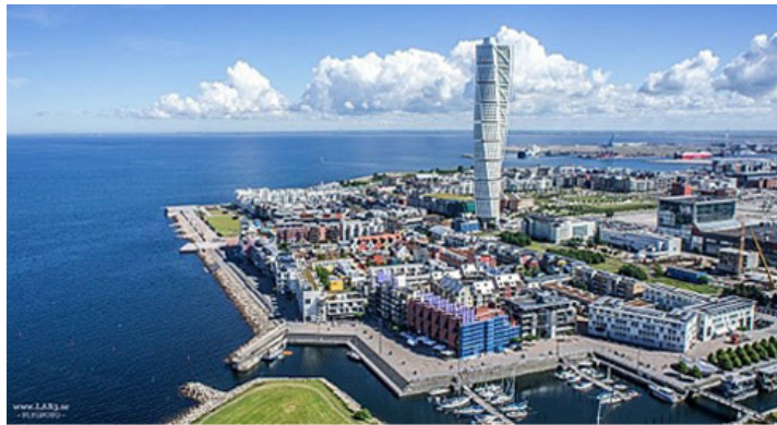
말외의 워터프론트 개발

도시의 경쟁력은 인적·물적 자원의 집적과 효율적 배분에 달려 있다. 도시의 경쟁력을 높이기 위해서는 '혁신적인 도시'로의 변모가 필요하다. 혁신적인 도시는 첨단 기술을 접목한 새로운 산업과 서비스를 창출하고, 이를 통해 도시의 경쟁력을 높인다. 또한, 도시의 경쟁력을 높이기 위해서는 도시의 인프라를 확충하고, 도시의 환경을 개선하며, 도시의 안전을 강화하는 등 다양한 노력을 기울여야 한다.