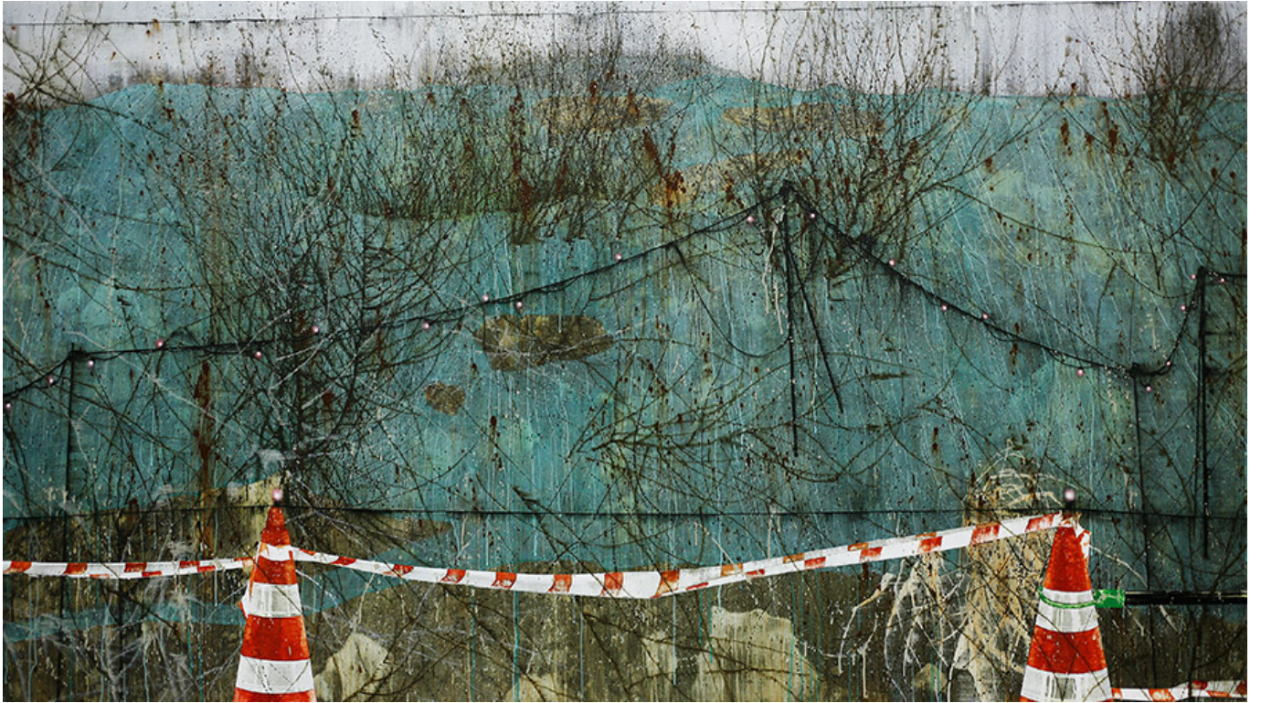
□, 156x277cm, acrylic on canvas, 2017