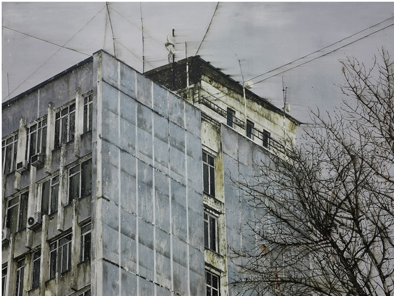
□□, 135x180cm, acrylic on canvas, 2016