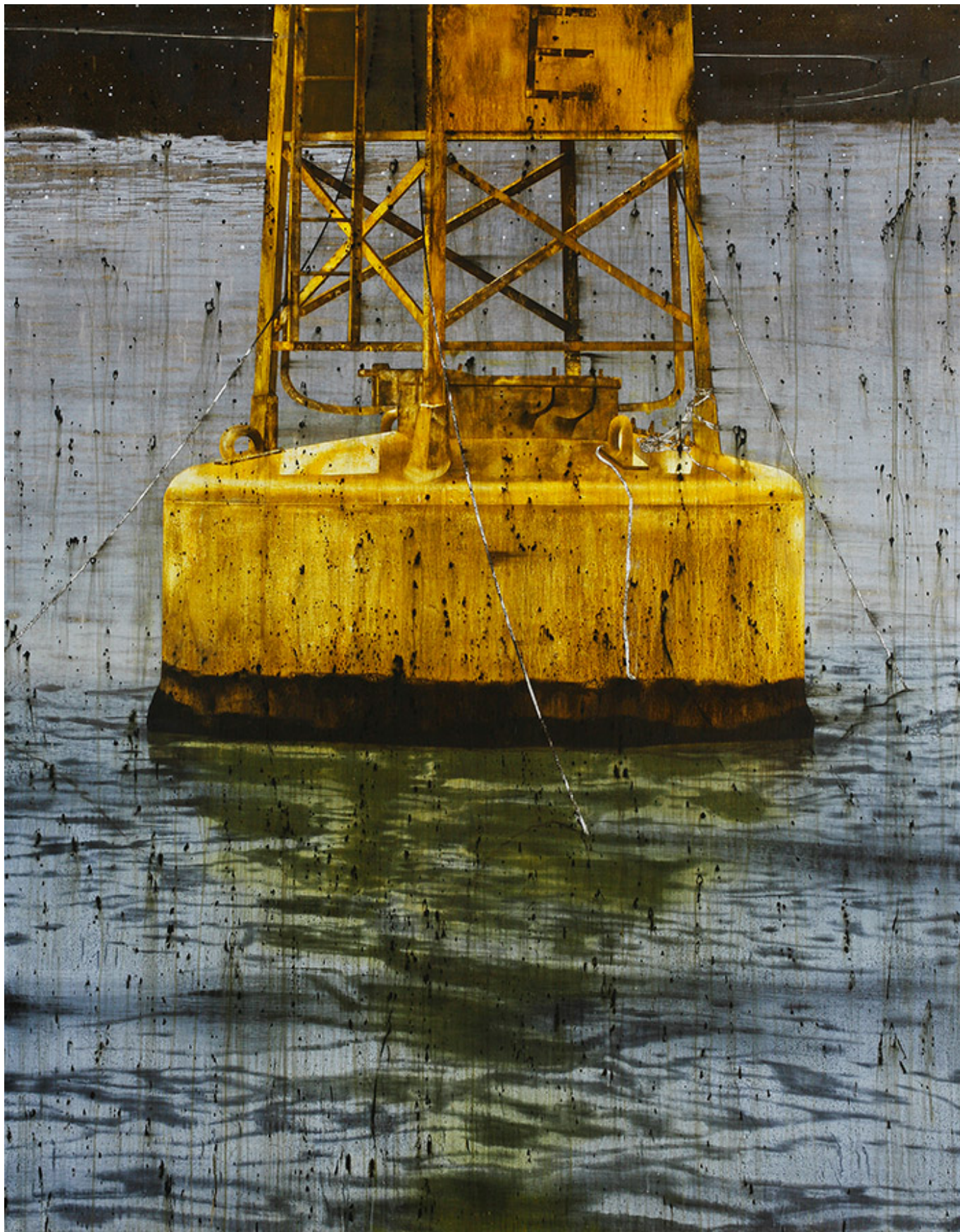
□□, 230x180cm, acrylic on canvas, 2017