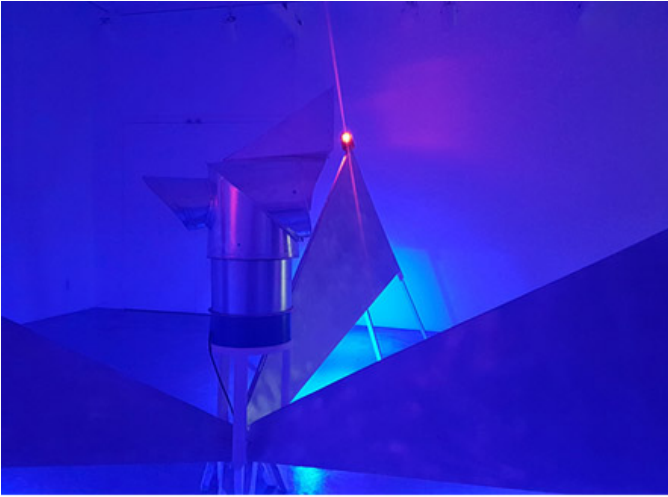
공장의 돌아가는 모터와 비상등