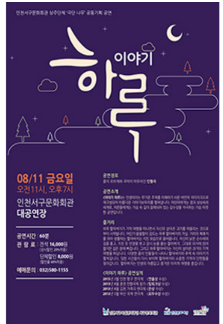
<이야기 하루> 포스터

0000 00 000 000000 00000 0000 0000 000 000 000000. “0000 0000 00 00000.” 00 00 00 00000 00 00 00000 000000 0000. (...) 00 00000 00 00000 0000. 000 0 0000 0000 00 0000 00, 0000 00 0000 00, 00 00 00 0000 0000 00 00000 0000 0 0000 00 00000 00. 00 0000 0000000. (...) 00000 0000 00 0000 0000 ‘0 0 0’0 00 000000 00000000, 0000 00 00 00000 0000 0000 0000 0000 0000 0000 00 0000 0000 0000. (...) 00 00 00 00 0000. 0000 00 00 0000 00 00000 0000 00 00000 0000 00 0000 0000 00. “00000 0000, 0, 00000. / 00 0000