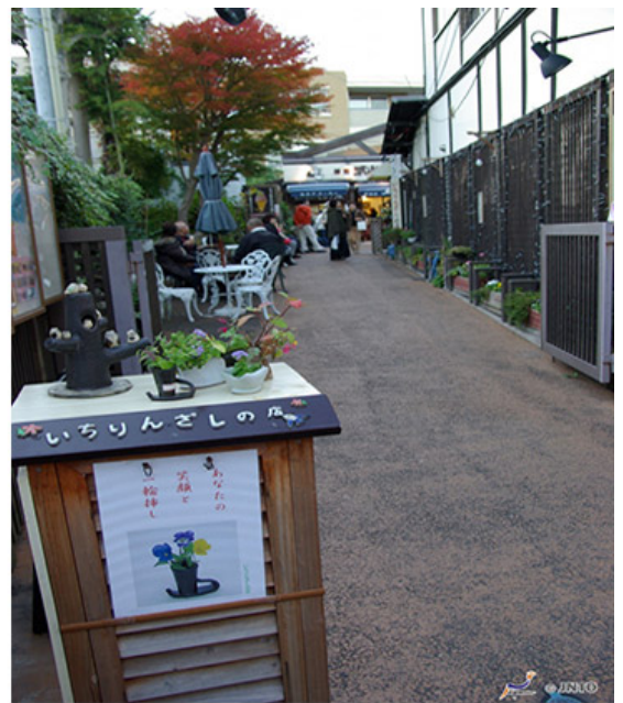
도쿄의 나카메구로(좌)와 가나가와의 가마쿠라(우)의 골목길.

도시의 문화적 다양성을 높이기 위해 다양한 문화 행사와 프로그램이 개발되고 있다. 이는 도시의 문화적 활력을 증진시키고, 시민들의 삶의 질을 향상시키는 데 기여하고 있다.