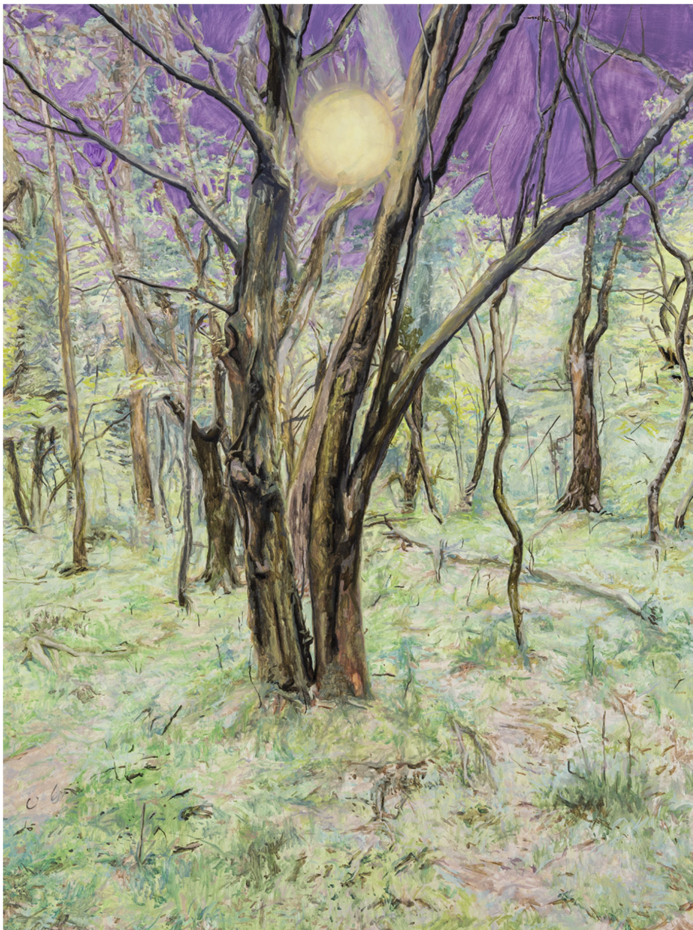
陈鹤良 作品， 130×97cm, 2016