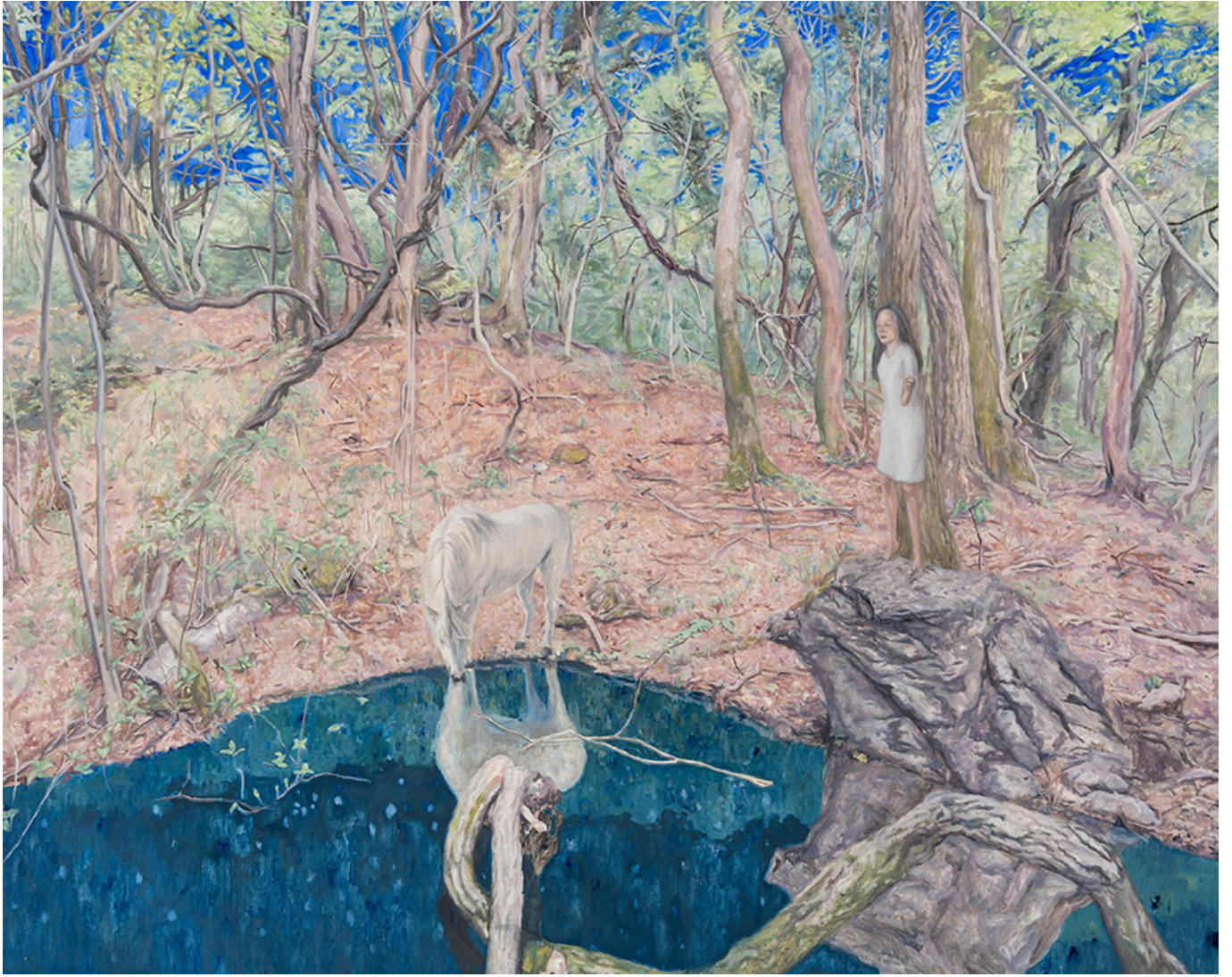
□ □ □ □ □ □ □ □ □ □, □ □ □ □ □ □, 130×162cm, 2016