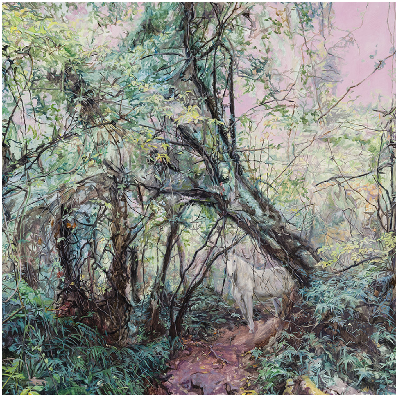
□□□ □□□, □□□□ □□, 91×91cm, 2016