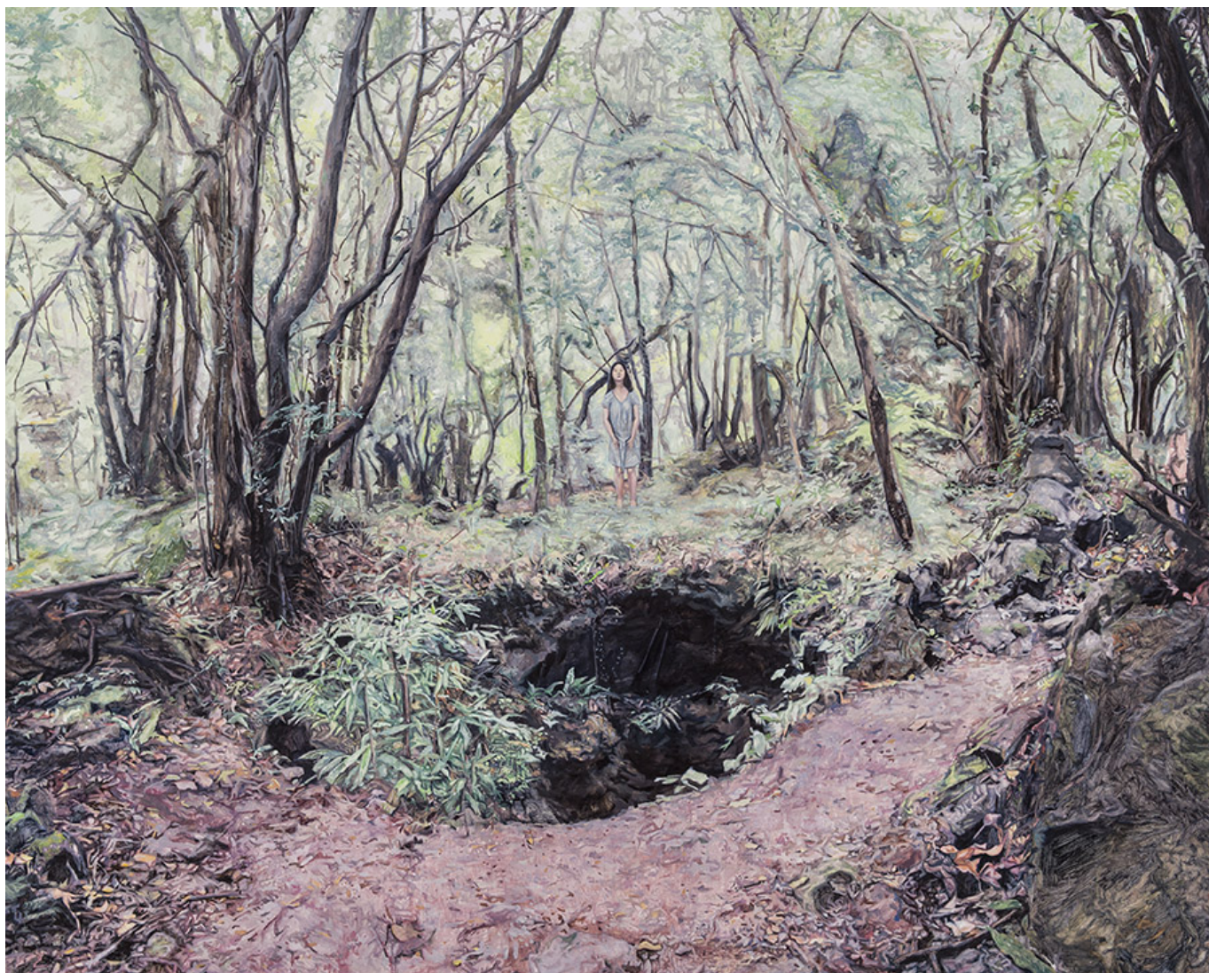
□□□ □□, □□□□ □□, 130×162cm, 2016