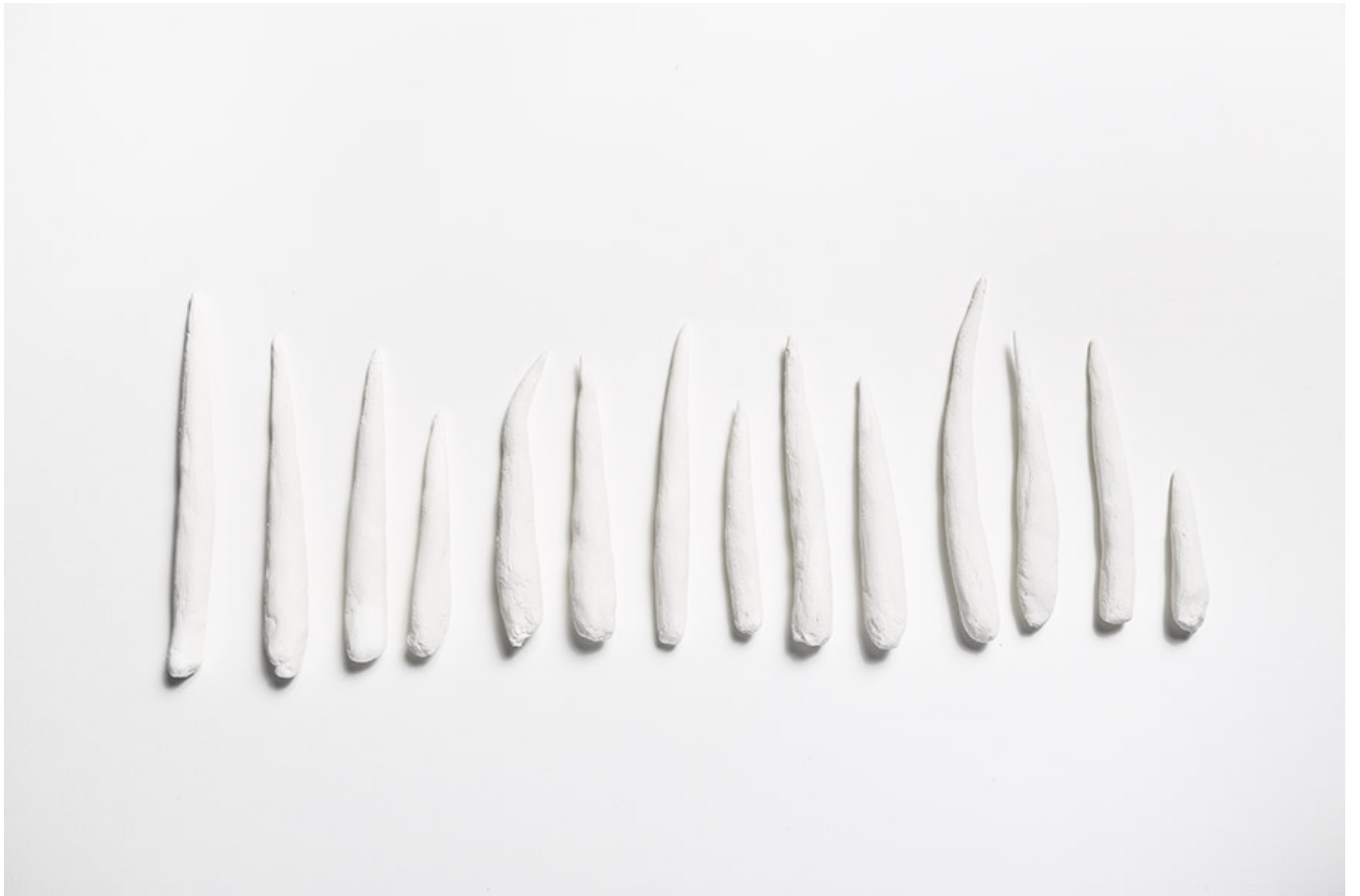
14개의 흰색 돌 조각, 2016