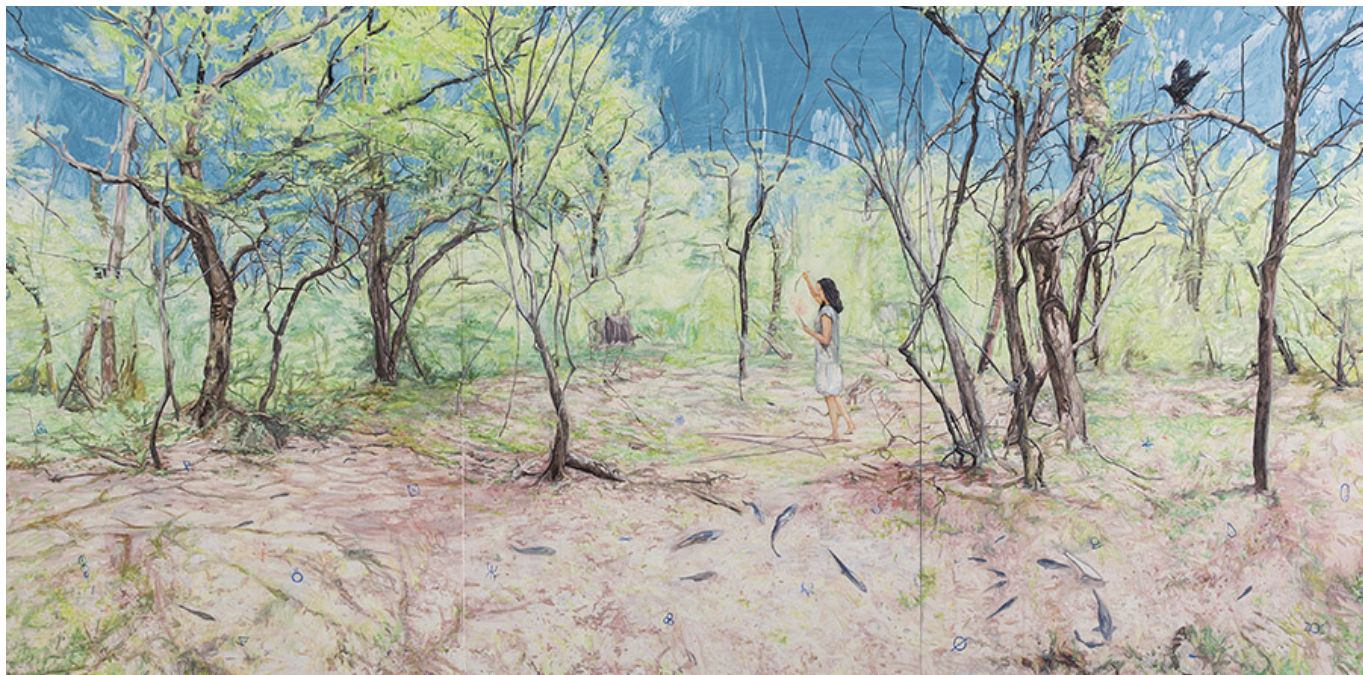
سید علی حسینی، سید علی حسینی، 194×390cm، 2016