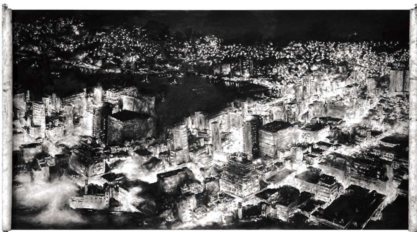
□□□(□□), Drawing(stroller), 150×300cm, conte on paper, 2015