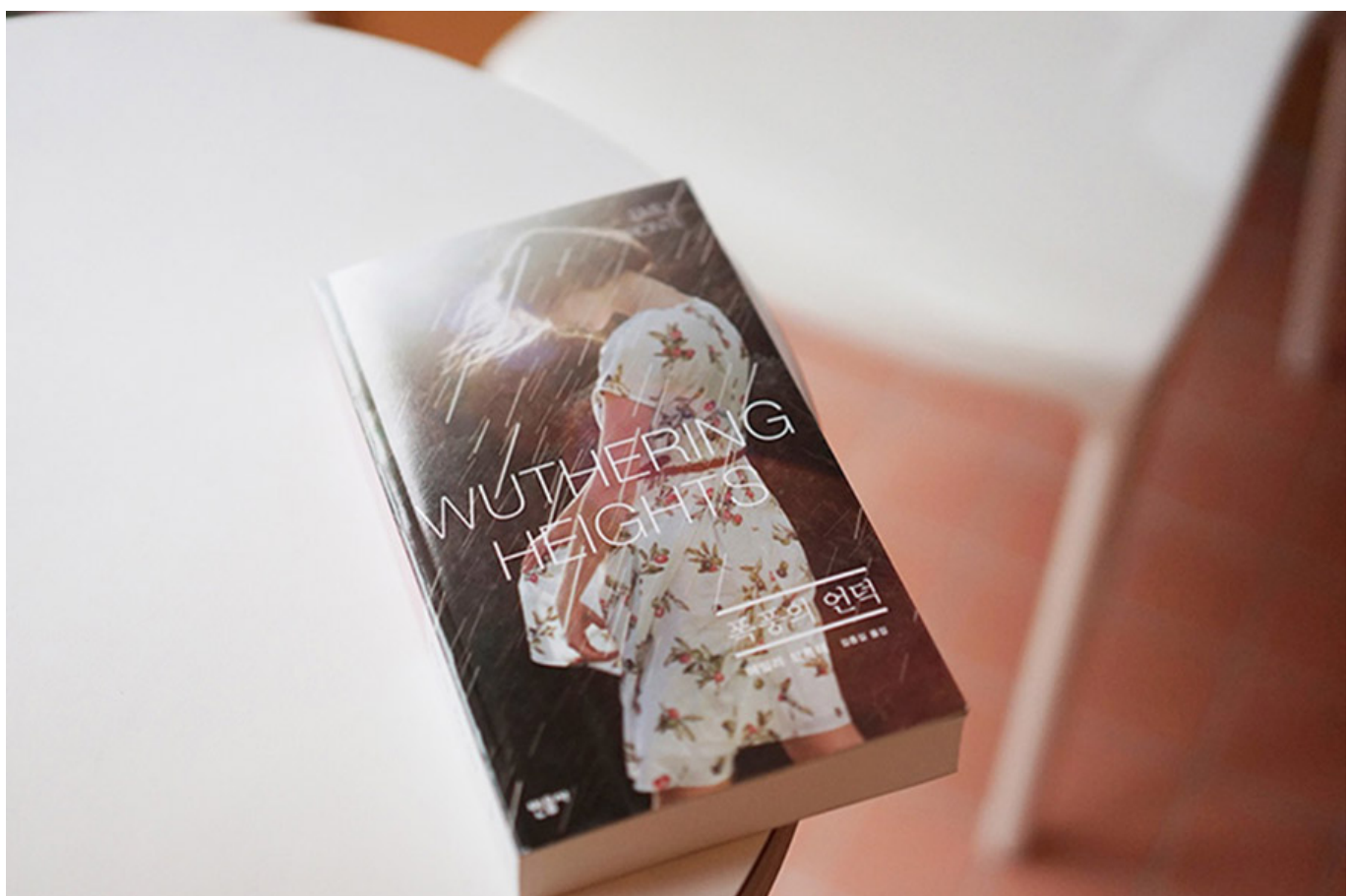
키이스 콜라보레이션 에디션 중 <폭풍의 언덕>

000 0000000 000 00 00 0000000 000000. 00 00 000 000KEITH0 0000 00 0 00 0000 '0000 0000000 000'0 '0000 00 00 000, 00000 00 00 000, 00 0 00 00 00 000' 00000 00000 000000. 0000 0000 00000 0000. '0000 00000'0 0000 0000 0 00 00 0000000. 00000 00000 0000 000000000, 0000 0000 0000 0000 0000 00000. 00000 00000 0000000 0000 0000 0000000.