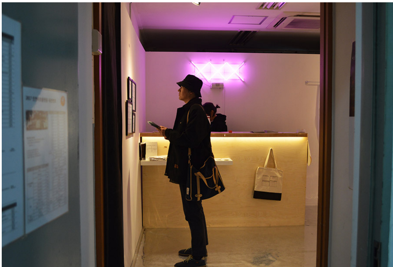
Drawing XXX, Slang Market Project, 2017

이 작품은 6월 1일부터 30일까지 서울의 한 갤러리에서 전시되었습니다. 이 작품은 <Drawing XXX> 시리즈의 일부로, 다양한 주제와 스타일을 탐구하는 프로젝트의 일환입니다. 이 작품은 5월 15일부터 30일까지 전시되었습니다. <Drawing XXX> 시리즈는 '이 작품'이라는 제목을 가진 작품으로, 다양한 주제와 스타일을 탐구하는 프로젝트의 일환입니다.