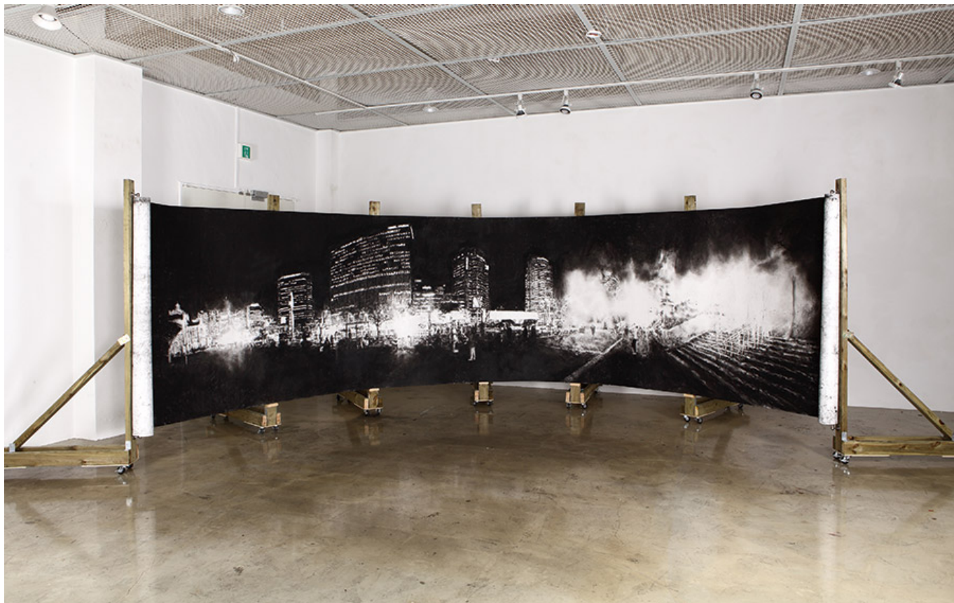
박서기(박서기 박서기), Drawing(Arch), 150×600cm, conte on paper, 2016