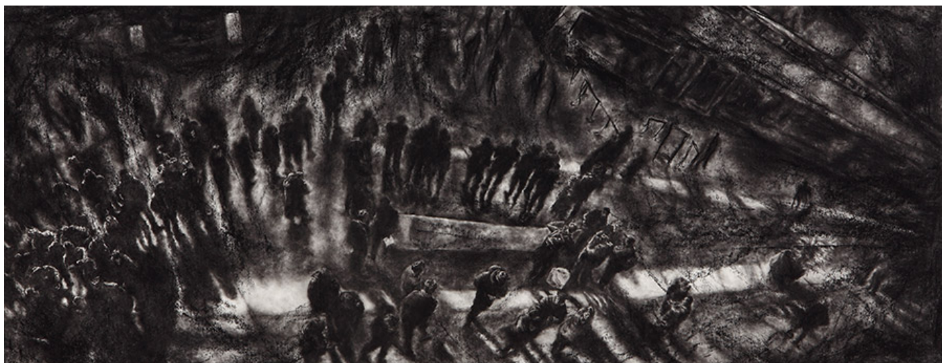
□□□(□□), Drawing(stroller), 40×103cm, conte on paper, 2016