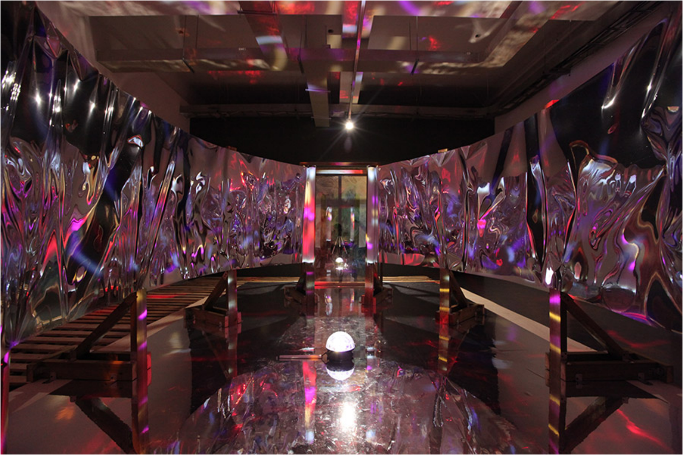
Ark, 330×550×191.5cm, space installation, 2016 Installation view at Gyeonggi Creation Center