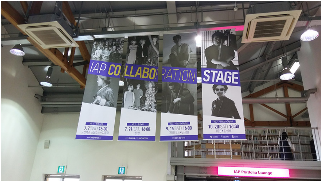
C동 공연장, 인천아트플랫폼 콜라보 스테이지

이제는 공연이 단순히 관객을 즐겁게 해주는 것을 넘어, 사회적 메시지를 전달하는 역할까지 맡고 있다. 그렇다면 공연은 어떻게 사회적 메시지를 전달할 수 있을까? 이번에는 인천아트플랫폼 C동 공연장에서 열린 'IAP CO-LLABORATION STAGE'를 통해 알아보자. 'IAP CO-LLABORATION STAGE'는 인천아트플랫폼과 IAP가 협업하여 기획한 공연이다. 'IAP CO-LLABORATION STAGE'는 7월 7일(토) 16:00, 7월 21일(토) 16:00, 9월 15일(토) 16:00, 10월 20일(토) 16:00에 걸쳐 총 4회 공연을 펼친다. 이번 공연은 'IAP CO-LLABORATION STAGE'를 통해 인천아트플랫폼의 다양한 공연을 소개하고, 관객들에게 다양한 공연을 소개하는 기회를 제공한다.