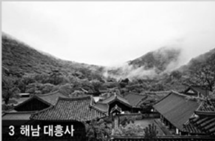
3 해남 대흥사