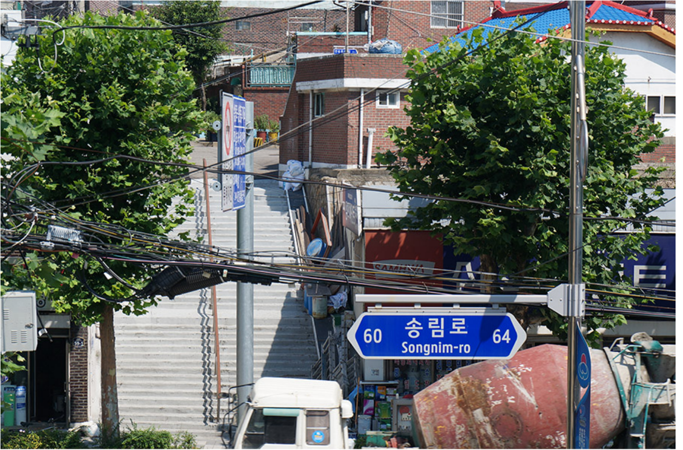
인천 동구 송림동