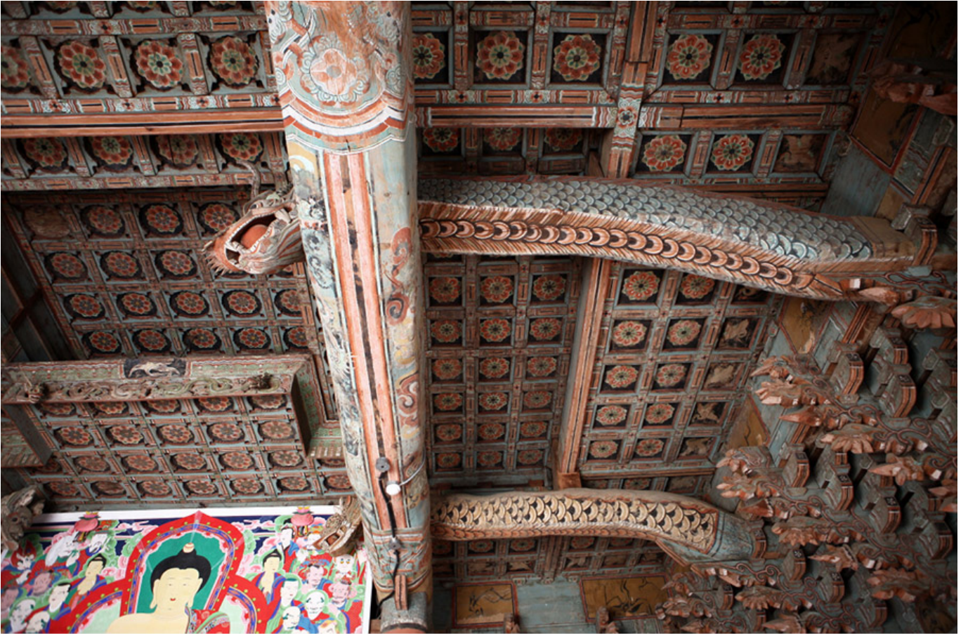
선암사(전남 순천) 대웅전 용머리 보물 제1311호

이 보물은 1973년 3월 30일 문화재청장령 제1311호로 지정된 국보이다. 높이가 1.5미터에 달하는 '용머리 보물'은 대웅전 내부에 있다.