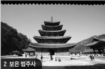
2 보은 범주사