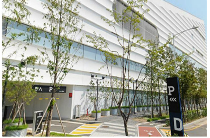
☞ 프리미엄 아울렛(좌)와 ☜ 쇼핑몰(우)의 입면. 판매기능의 효율성과 훌륭한 내적 완결성을 위한 선택으로 도시는 거대한 장벽을 갖게 되었습니다.

이 공간은 도시 공간 안에서 도시 공간을 도시 공간으로 만들며, '도시'의 공간을 이 공간으로 만든다. 이 공간은 도시 공간을 '도시 공간'으로 만들며, 도시 공간을 도시 공간으로 만든다. 이 공간은 도시 공간을 도시 공간으로 만들며, 도시 공간을 도시 공간으로 만든다. 이 공간은 도시 공간을 도시 공간으로 만들며, 도시 공간을 도시 공간으로 만든다. 이 공간은 도시 공간을 도시 공간으로 만들며, 도시 공간을 도시 공간으로 만든다. 이 공간은 도시 공간을 도시 공간으로 만들며, 도시 공간을 도시 공간으로 만든다. 이 공간은 도시 공간을 도시 공간으로 만들며, 도시 공간을 도시 공간으로 만든다. 이 공간은 도시 공간을 도시 공간으로 만들며, 도시 공간을 도시 공간으로 만든다.