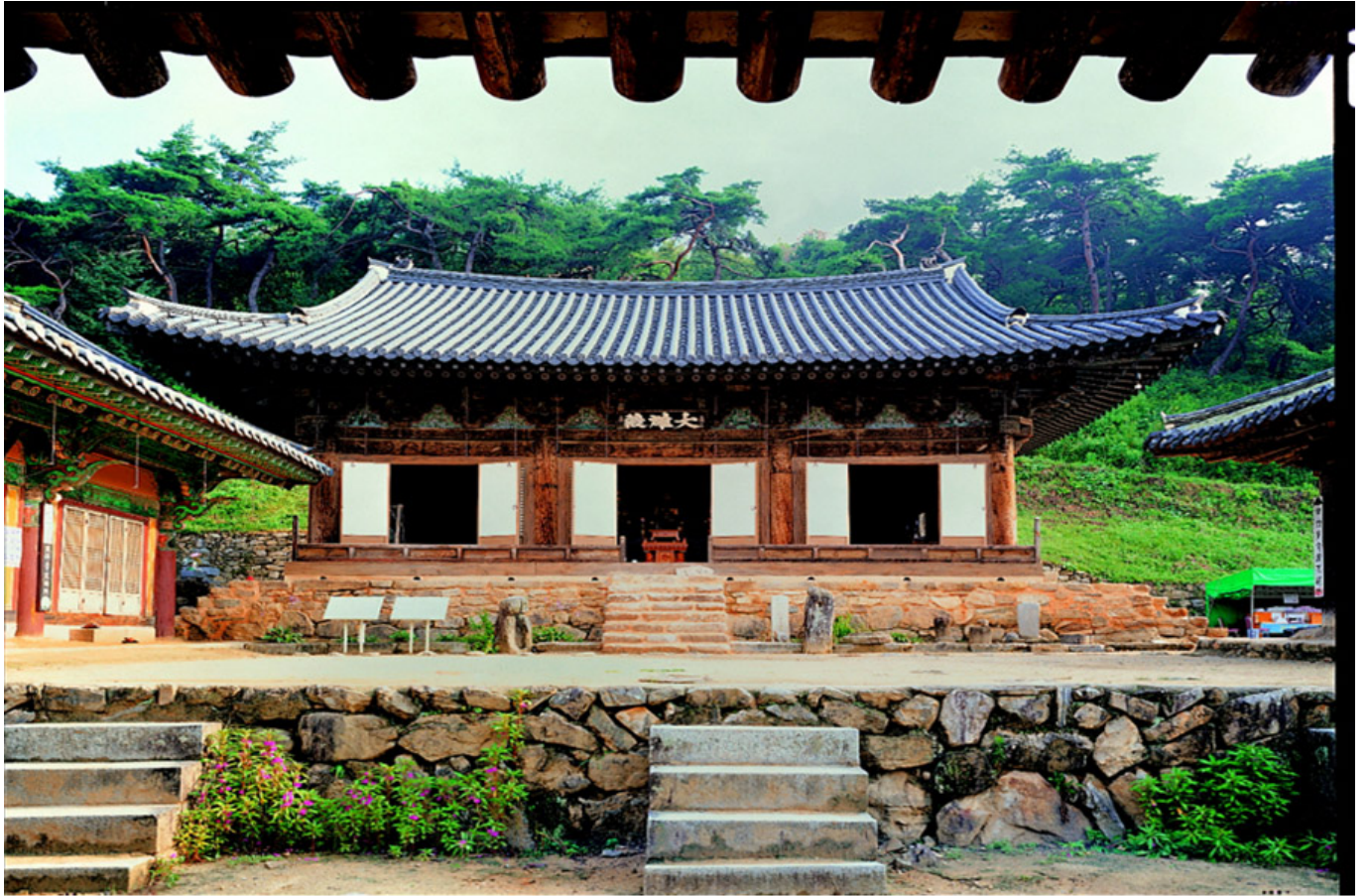
봉정사(경북 안동) 대웅전 국보 제311호

대웅전(大雄殿)은 불교 사찰의 중심을 이루는 건물로, 7세기 말부터 8세기 초에 걸쳐 세워졌다. 이 건물은 대웅보살을 모신 곳으로, 정면 3칸, 측면 3칸의 정방형 구조를 띠고 있다. 지붕은 단청을 한 겹처마로, 목재는 대부분 소나무를 사용하였다. 건물 앞에는 석제 계단과 돌담이 있으며, 주변에는 다양한 석조 유물이 남아 있다.