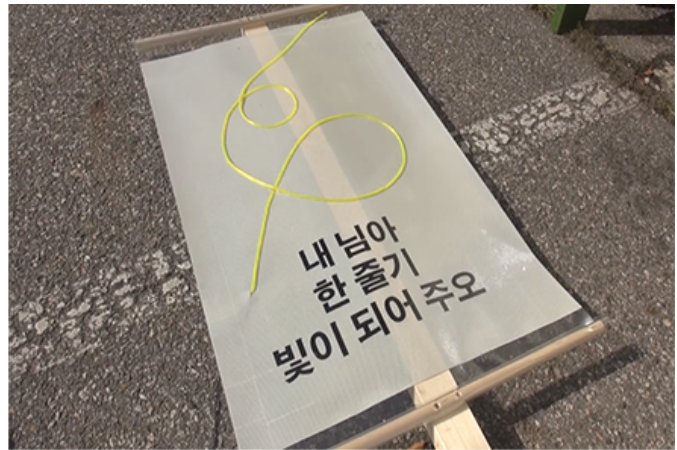
현수막 프로젝트, 제작된 현수막, 2015

이러한 현수막은 다양한 주제와 메시지를 전달하는 데 사용됩니다. 예를 들어, 환경 보호, 사회적 이슈, 문화 행사, 교육 캠페인 등에 활용됩니다. 현수막의 크기와 디자인은 전달하려는 메시지의 중요성과 행사장의 분위기에 따라 달라집니다. 또한, 현수막의 위치와 노출 시간은 메시지의 효과를 높이는 데 중요한 역할을 합니다.