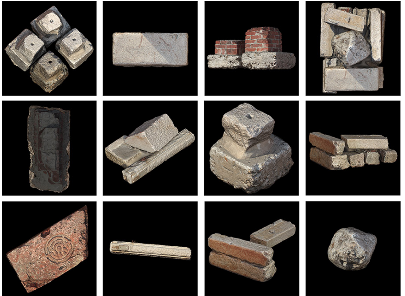
<0000 00>_0000 000 0000000 000 0000_000, LED, 1CH 00, 000, C-Print_2017

A. 0000 0000 000 00 00 000 000 00 0000, 00 000 00 000000 0000 0000. 00 000 0000 00 0000 000 000 0000 000 000 000 000 000 000 000 00 00 000000 0000. 00 000 00 00 000 00 000 0000 000 000 000 00 0 00, 00 000 000 0 00 0 0 000 000 0000. 000 000 00 0000 0000 0 0000 000 0000 0000 0000 000 00 0000 000 00 0000. 0 000 000 000000 00 0 000, 000 000 0000 0000 0000 0000.