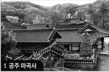
1 공주 마곡사