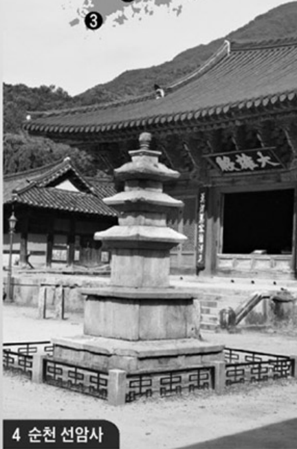
4 순천 선암사