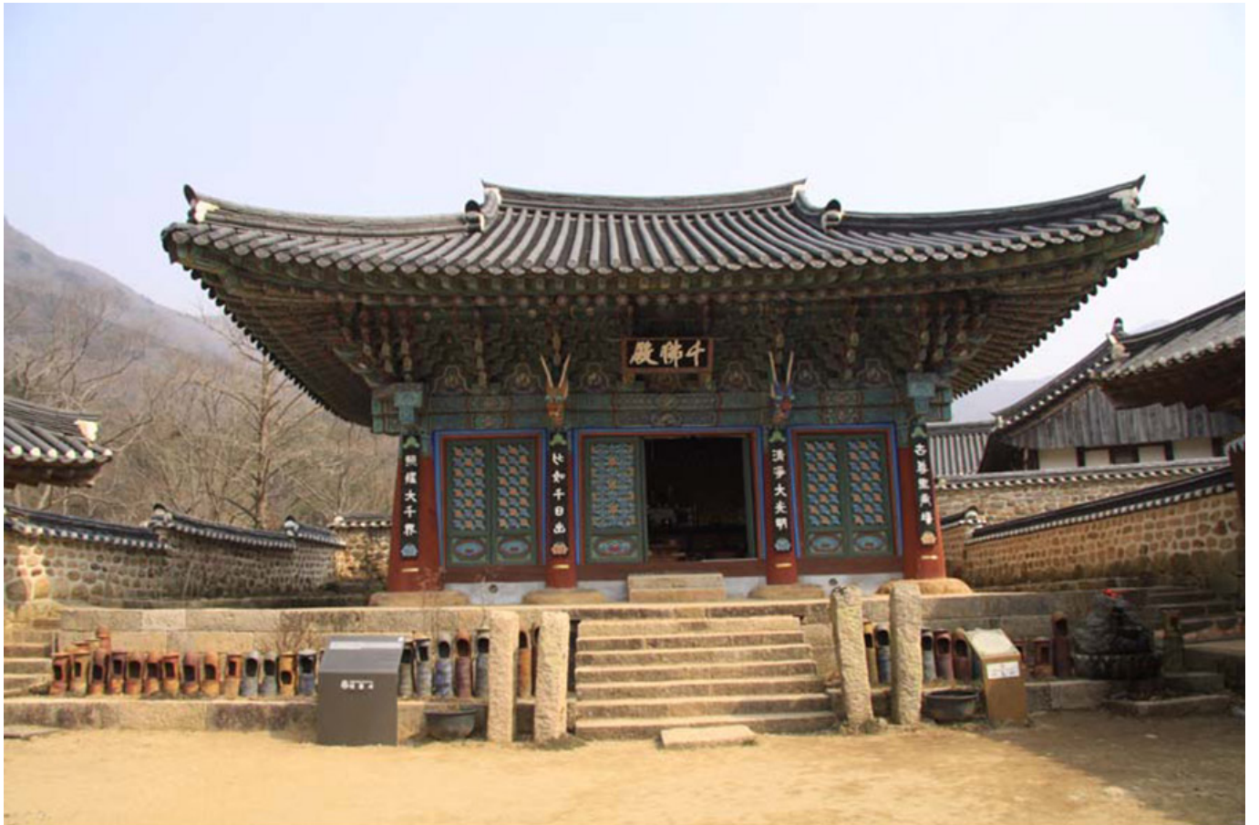
대흥사(전남 해남) 천불전 보물 제1807호

천불전은 대흥사(전남 해남)의 본전으로, 조선시대 중엽에 건립된 것으로 보인다. 건물은 대웅전과 유사한 구조를 띠고 있으며, 내부에는 천불(천부대)이 봉안되어 있다. 건물은 대웅전과 유사한 구조를 띠고 있으며, 내부에는 천불(천부대)이 봉안되어 있다.