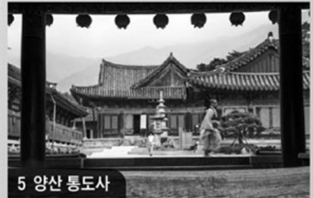
5 양산 통도사