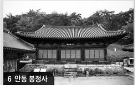
6 안동 봉정사