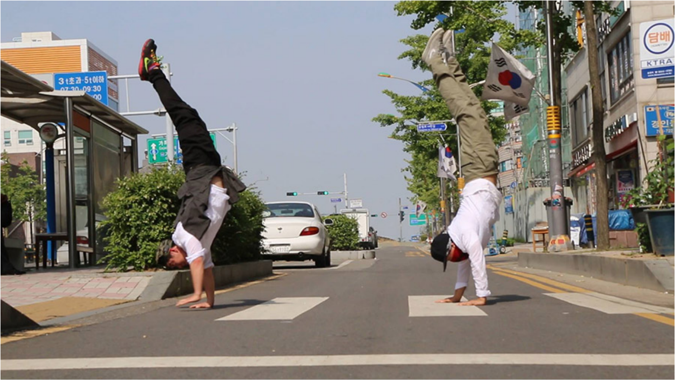
<도시청년 게릴라>

이들 5명 10명 <도시청년 게릴라> 팀을 구성할 예정이다. 이 팀은 도시청년 게릴라 팀의 구성원들이 '0'으로 구성된 팀을 구성할 예정이다. <도시청년 게릴라> 팀은 이 팀을 구성할 예정이다.