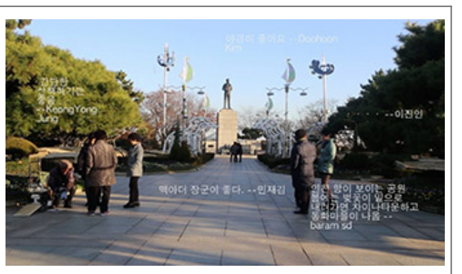
<Mind Map>_모모모_2모 모모_20 47_2016