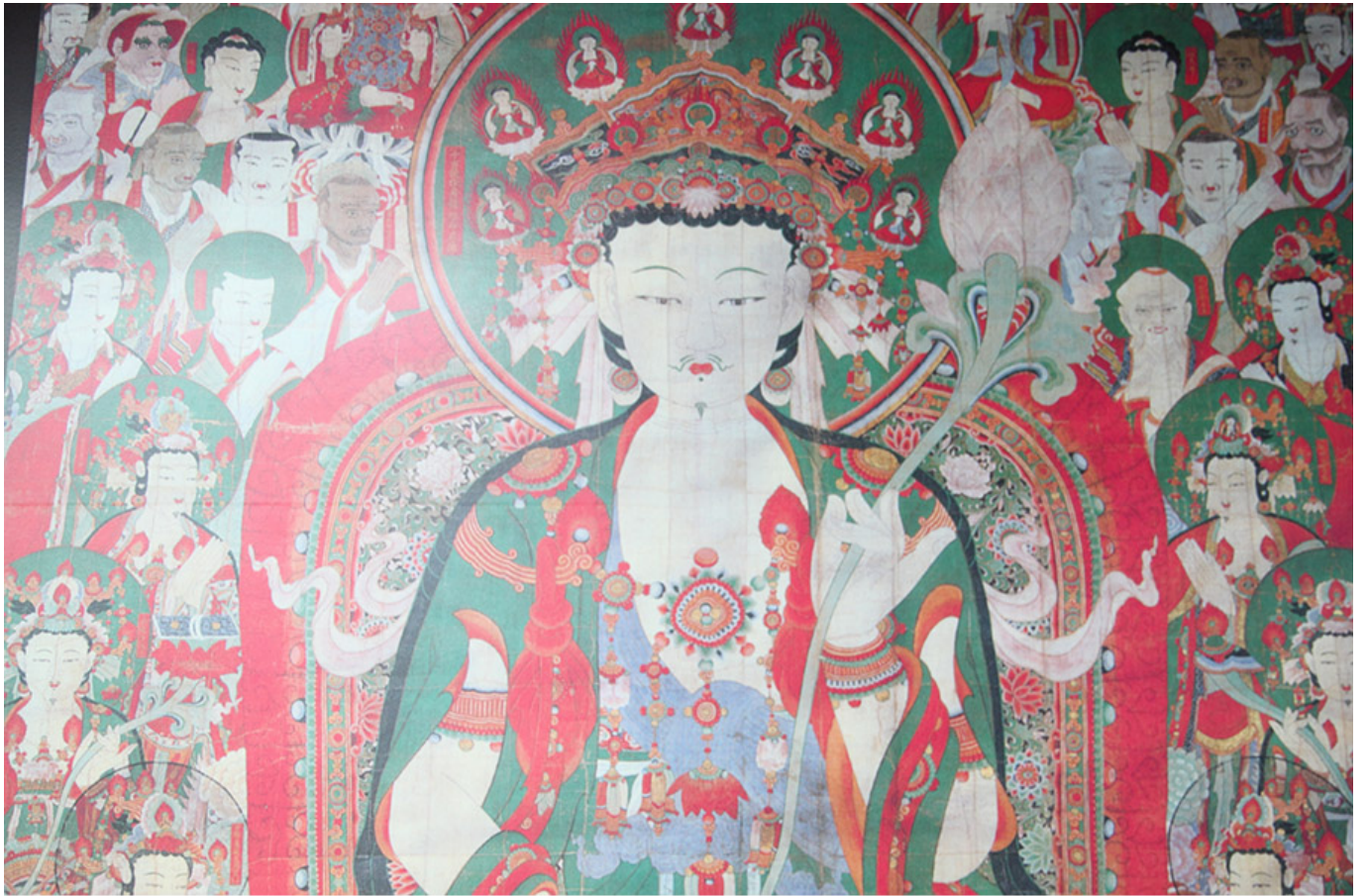
마곡사(충남 공주) 석가모니불괘불탱 보물 1260호

이 작품은 6세기 말, 10세기 말, 고려시대, 조선시대, 17세기 말에 제작된 것으로 추정된다. 이 작품은 17세기 말에 제작된 것으로 추정된다. 이 작품은 17세기 말에 제작된 것으로 추정된다.