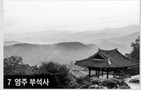
7 영주 부석사