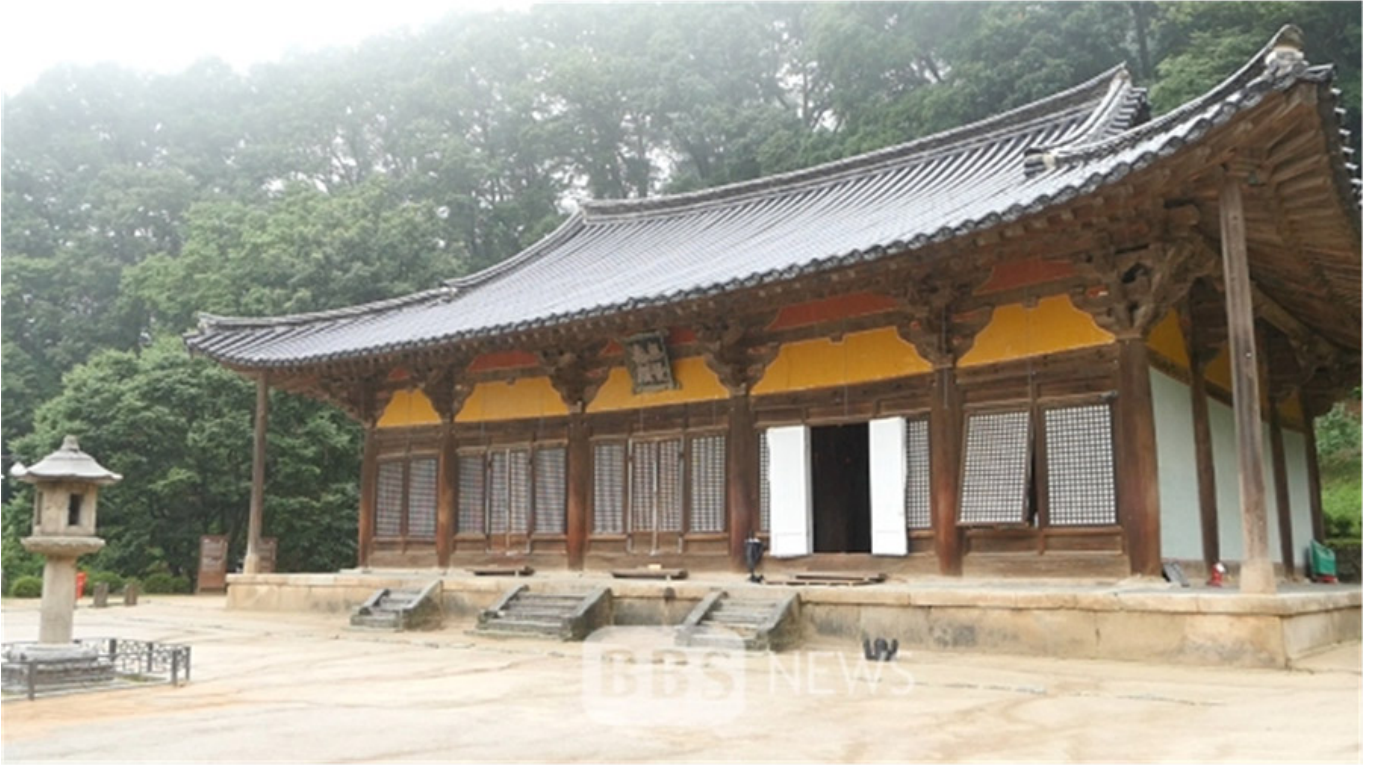
부석사(경북 영주) 무량수전 국보 18호

부석사(경북 영주) 무량수전 국보 18호는 16세기(676)에 건립된 것으로 추정된다. 이 건물은 조선 초기에 건립된 것으로 보이며, 18세기 중반에 중수된 것으로 보인다. 이 건물은 조선 초기에 건립된 것으로 보이며, 18세기 중반에 중수된 것으로 보인다. 이 건물은 조선 초기에 건립된 것으로 보이며, 18세기 중반에 중수된 것으로 보인다.