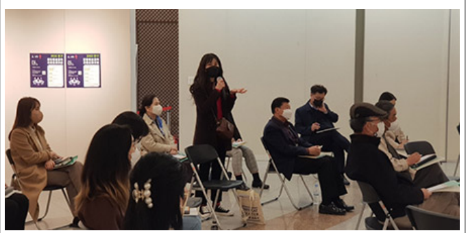
이 프로그램의 모습