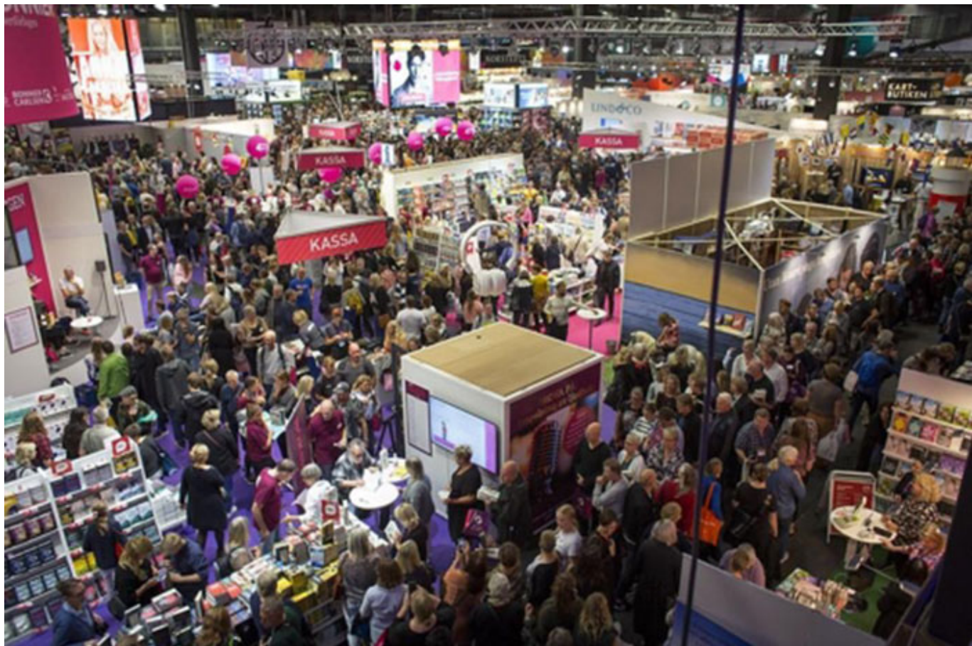
2017 : 2018

• 2017 2018 2019. 2017 2018 '10TAL' 2019 2020 2021 "2022 2023 2024 2025 2026 2027 2028 2029" 2030 2031.