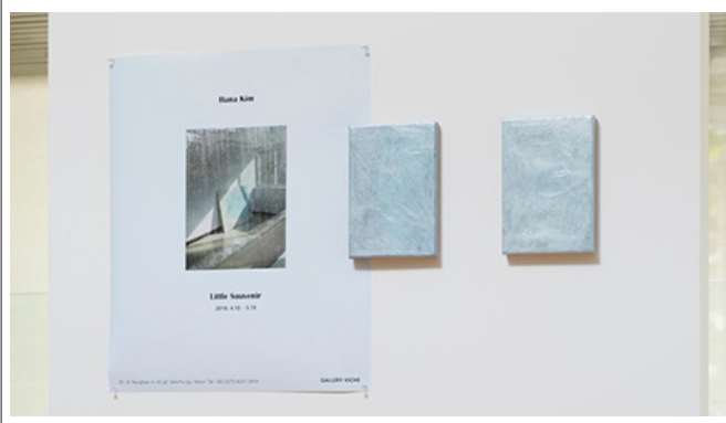
Untitled (Little Souvenir Series), 22.7×15.8cm(2pcs), 2018