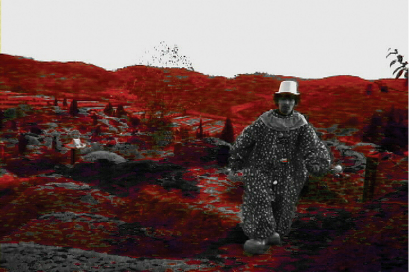
00, <0000 00>, Single-channel video, color, sound (LCD monitor), 1min 53sec, 2003