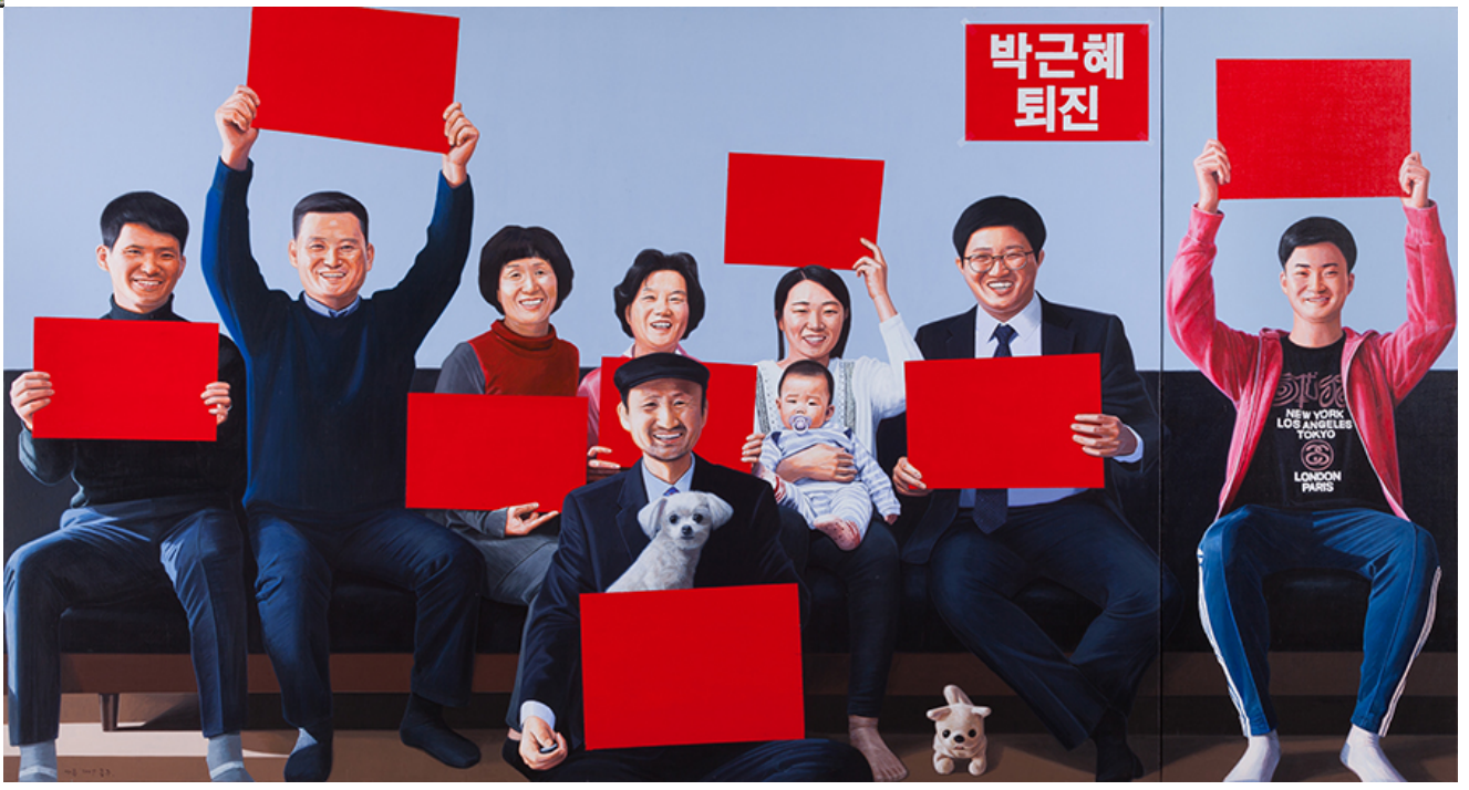
vas, 130x244cm, 2017

이 작품은 2017년 12월 10일 박근혜 대통령의 탄핵 결정이 발표된 직후에 제작된 작품이다. 이 작품은 박근혜 대통령의 탄핵을 지지하는 다양한 계층의 사람들을 보여준다. 이 작품은 박근혜 대통령의 탄핵을 지지하는 다양한 계층의 사람들을 보여준다. 이 작품은 박근혜 대통령의 탄핵을 지지하는 다양한 계층의 사람들을 보여준다.