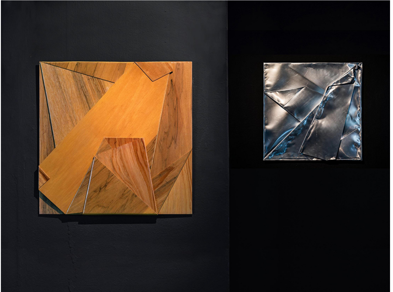
cm( ), 50x50cm( ), 0000, 0000, 2019