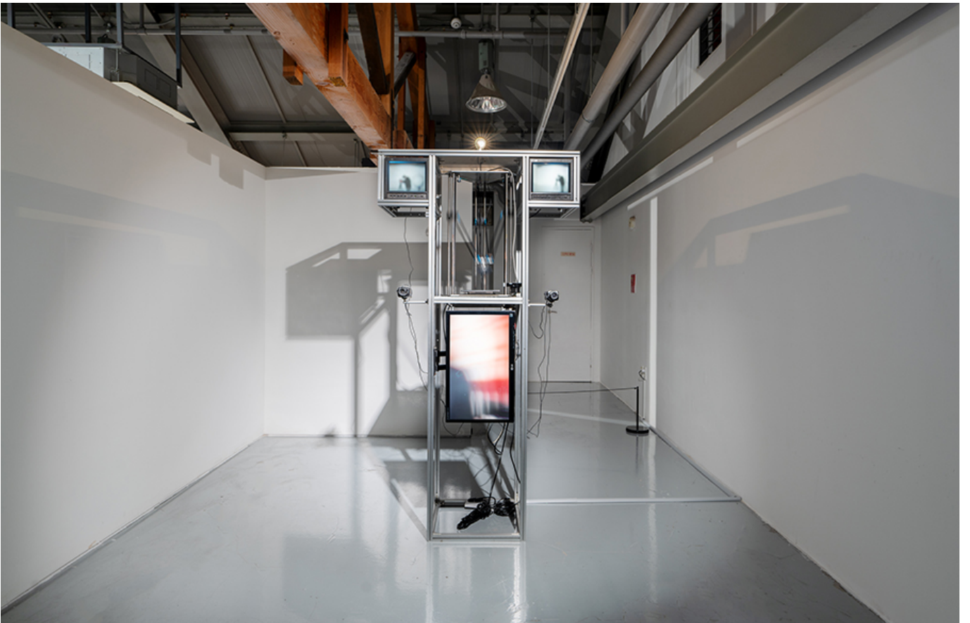
00, <0000 000 00 000 000 0000>, Recycle robot, plc, relay, sensor, support frame, etc, 230×160×45cm, 2010