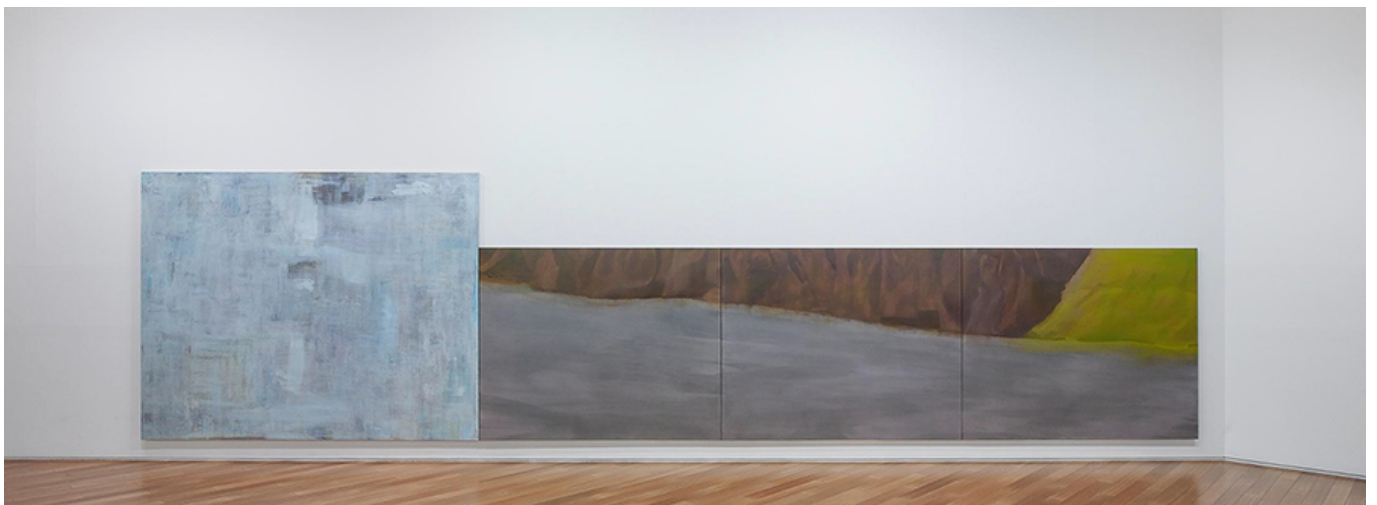
Beau Travail 10(2019년 10월 10일), 181.8×227.3cm, 2019

A. 'Little Souvenir' 시리즈는 작가 Hana Kim의 개인적인 기억과 경험을 바탕으로 제작된 작품입니다. 이 시리즈는 주로 창문, 책상, 조명 등 일상적인 사물을 주제로 하며, 이를 통해 공간의 분위기와 감정을 표현합니다. 작품은 주로 흰색 배경에 얇고 투명한 유리나 아크릴에 그려진 것으로, 단순하면서도 섬세한 선과 색채를 사용하여 공간의 깊이와 질감을 강조합니다. 또한, 이 시리즈는 전시 공간의 조명과 배치에 따라 다르게 보이는 특성을 가지고 있어, 관람객의 시선과 움직임에 따라 작품의 해석이 달라질 수 있습니다.