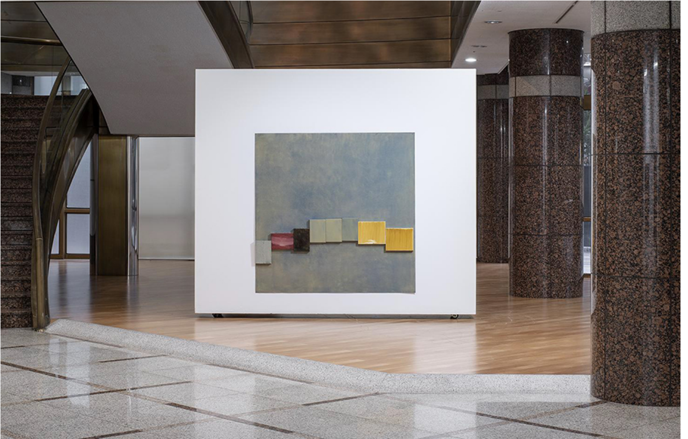
Beau Travail 11(2019년 11월), 160x160cm, 유채화, 2019

Q. 이 작품은 어떤 주제(내용)를 다루고 있으며, 어떤 메시지를 전달하고 있습니까?