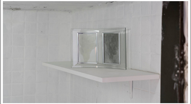
Untitled (Little Souvenir Series), 15.5×10.5cm(2pcs), 2018

Q. 2018년 10월 10일부터 11월 10일까지 전시된 'Little Souvenir' 시리즈의 주요 특징을 설명하십시오.