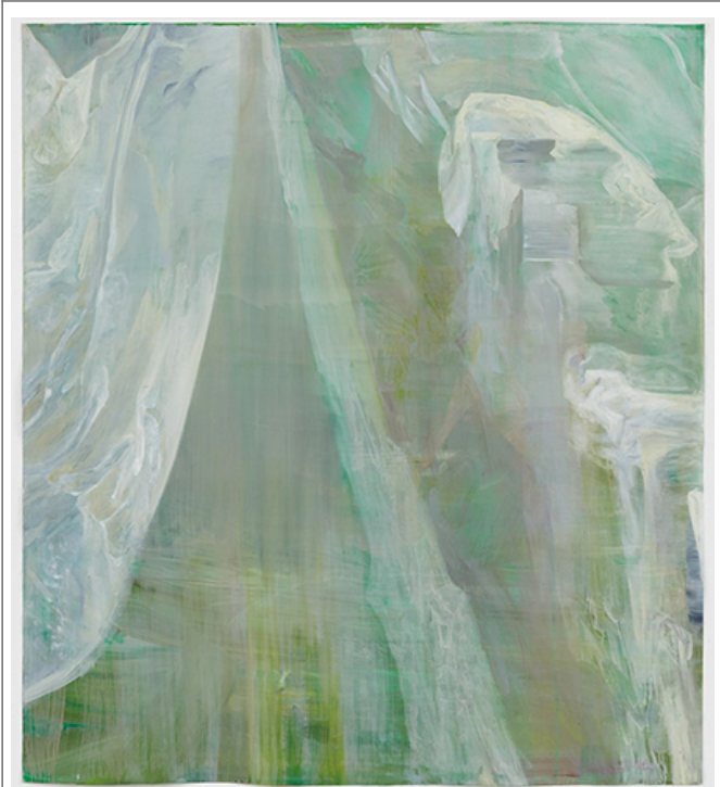
Untitled (Glacier Landscape Series), 180x160cm, 2016

2016 年 10 月 1 日 至 2016 年 10 月 31 日 止 的 展 覽 期 間 內 展 出 的 作 品 均 為 2014 年 至 2017 年 間 創 作 的 作 品。 展 覽 期 間 內 展 出 的 作 品 均 為 2014 年 至 2017 年 間 創 作 的 作 品。 展 覽 期 間 內 展 出 的 作 品 均 為 2014 年 至 2017 年 間 創 作 的 作 品。