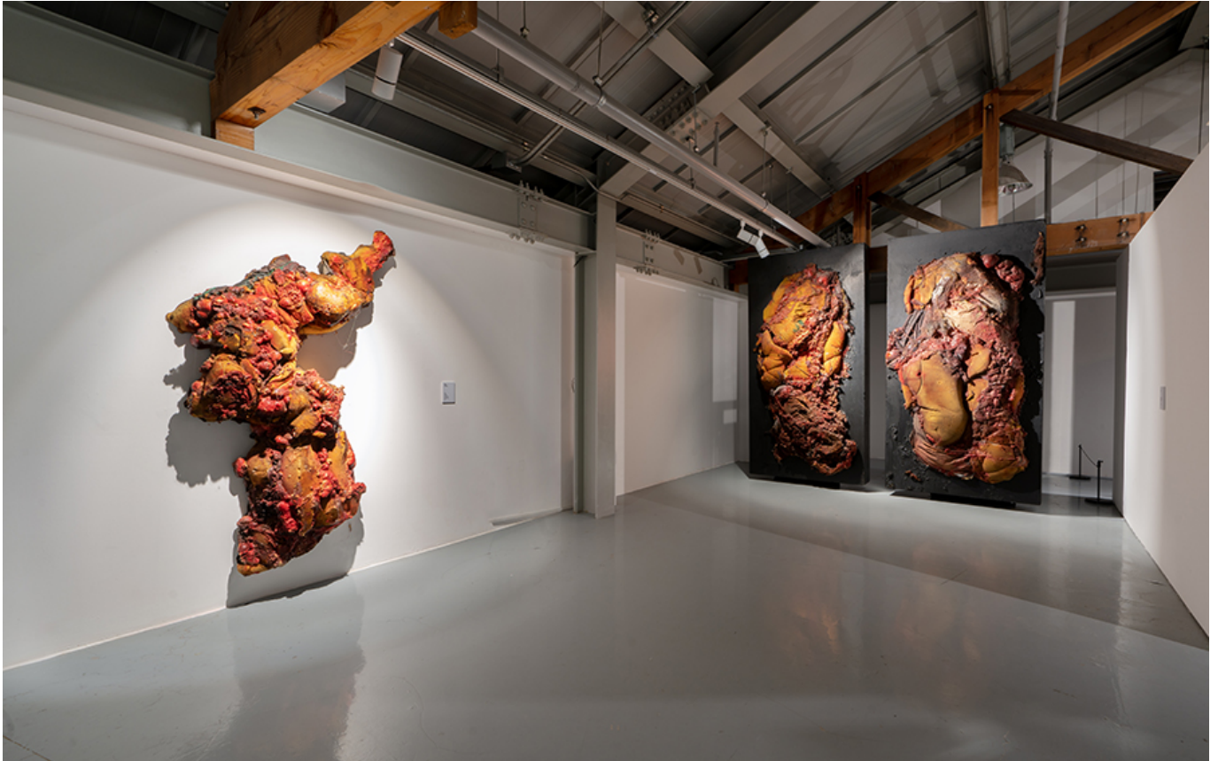
○○, <○○>, Object on frame, 180×120×50cm, 2003 ○○, <○○>, Object on frame, 240×120×50cm(2pcs), 1999

○○ ○○ ○○○ ○○○ ○○○ ○○○. ○○(○○)○ ○○(○○)○ ○○○ ○ ○○○.