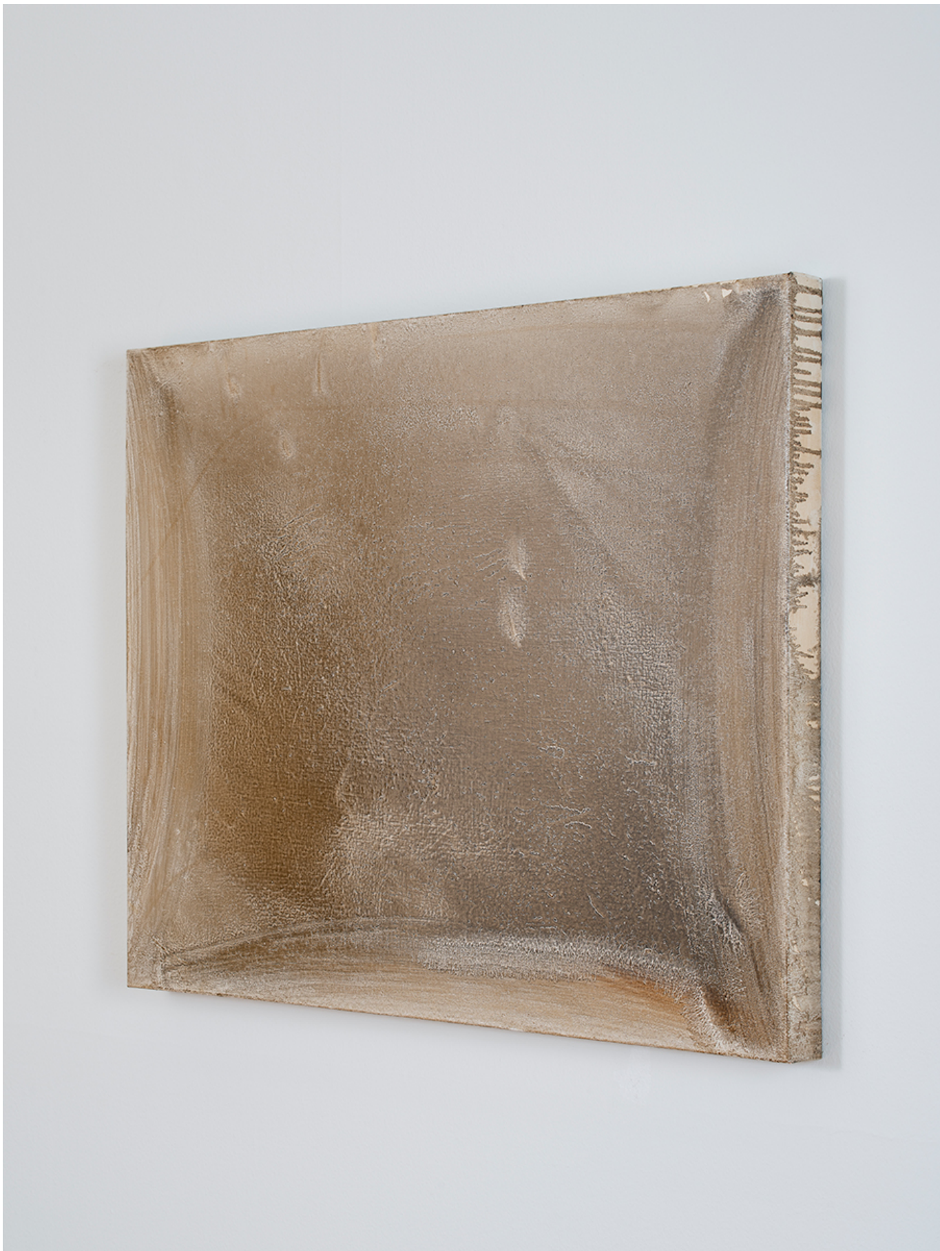
□□□□ □□ 4, 90.9×72.7×5cm, □□□□ □□, 2019