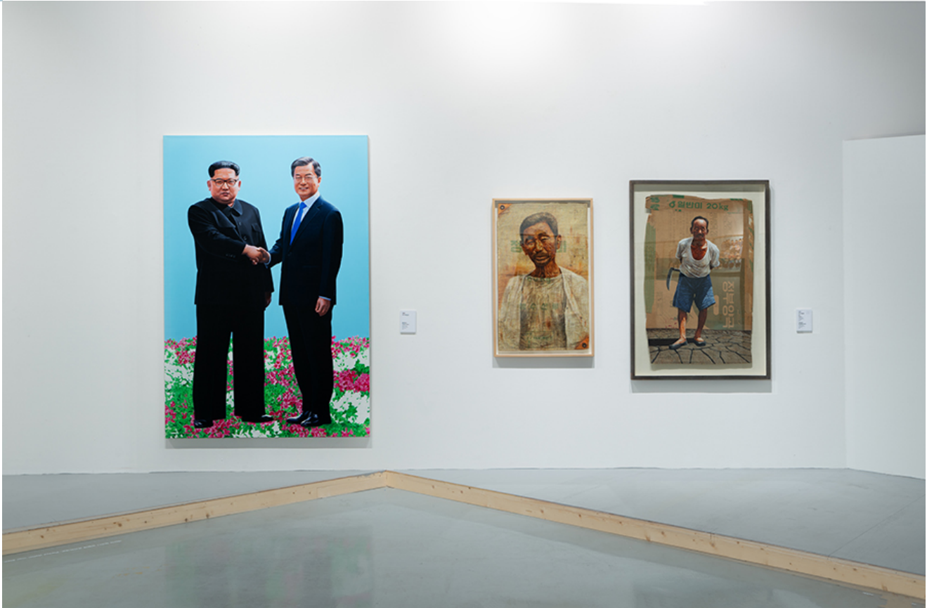
c on a canvas, 194x130cm, 2018