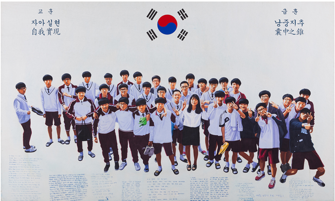
n paper, 97x130cm, 2018