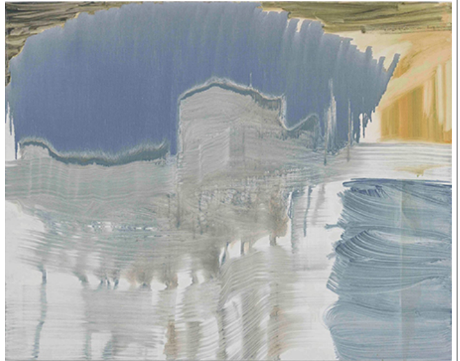
Untitled (Glacier Landscape Series), 130.3x162.2cm, 2016

2016 年 10 月 1 日 至 2016 年 10 月 31 日 止 的 展 覽 期 間 內 展 出 的 作 品 均 為 2014 年 至 2017 年 間 創 作 的 作 品。 展 覽 期 間 內 展 出 的 作 品 均 為 2014 年 至 2017 年 間 創 作 的 作 品。 展 覽 期 間 內 展 出 的 作 品 均 為 2014 年 至 2017 年 間 創 作 的 作 品。