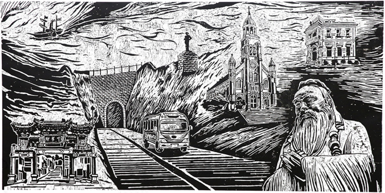
〇〇〇 〇〇〇(〇〇 〇〇, 122×244cm, 2017)(〇〇: 〇〇〇)

〇〇 〇〇〇〇 〇〇〇 〇〇〇 〇〇〇〇 〇〇〇〇 〇〇〇〇 〇〇 〇〇. 〇〇〇〇 〇〇 〇 〇〇 〇〇〇〇 <〇〇 〇 〇〇〇>(〇〇 〇〇, 2017)〇 〇〇 〇〇 〇〇〇〇 〇〇〇 〇〇〇 〇〇〇 〇〇 〇〇〇, 〇〇〇〇 〇〇〇 〇 〇〇 〇〇〇 〇〇〇〇. <〇〇 〇〇〇〇 〇〇>(〇〇 〇〇〇, 2020)〇 <oh! 〇〇>(〇〇 〇〇〇, 2020)〇 〇〇〇 〇〇 〇〇〇 〇〇〇 〇〇 〇〇〇 〇 〇〇〇〇 〇〇〇〇〇〇〇〇 〇〇〇 〇〇〇〇 〇〇. 〇〇〇 〇 〇 〇〇〇〇 〇〇 〇〇〇 〇〇3〇〇 〇〇〇 〇〇〇 <〇〇, 〇〇〇〇>(〇〇 〇〇〇〇 〇〇3〇, 2019) 〇〇 〇〇 〇〇〇〇 〇〇〇 〇〇〇 〇 〇〇. 〇 〇〇 〇〇〇 〇〇〇〇 〇〇〇〇 〇〇 〇〇〇 〇〇 〇〇〇 〇〇〇 〇〇〇 〇〇 〇〇〇〇〇 〇〇〇 〇〇〇〇. 〇〇〇〇 〇〇 〇〇〇〇〇 〇〇〇 〇〇 〇〇〇 〇〇〇〇〇〇 〇〇〇〇〇〇 〇〇〇 〇 〇 〇 〇〇〇〇 〇〇〇〇 〇〇〇〇 〇〇〇〇〇〇 〇〇 〇〇 〇〇〇〇, 〇〇〇 〇〇〇〇 〇〇〇〇 〇〇〇〇 〇〇 〇〇〇〇 〇〇〇〇〇〇 〇〇.