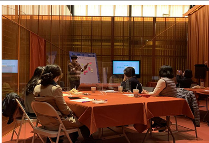
14:00 - 15:00

2019년 12월 10일(수) 14:00 - 17:00, 15:00 - 17:00, 16:00 - 17:00, 17:00 - 18:00. 14:00 - 15:00, 15:00 - 16:00, 16:00 - 17:00, 17:00 - 18:00. '14:00 - 15:00(14:00)' 14:00 - 15:00, 15:00 - 16:00, 16:00 - 17:00, 17:00 - 18:00. 14:00 - 15:00, 15:00 - 16:00, 16:00 - 17:00, 17:00 - 18:00.