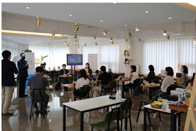
16:00 - 17:00