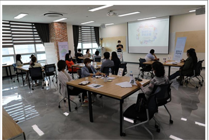
15:00 - 16:00