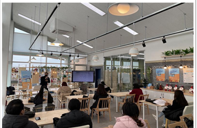
17:00 - 18:00

14:00 - 15:00, 15:00 - 16:00, 16:00 - 17:00, 17:00 - 18:00. 14:00 - 15:00, 15:00 - 16:00, 16:00 - 17:00, 17:00 - 18:00. 14:00 - 15:00, 15:00 - 16:00, 16:00 - 17:00, 17:00 - 18:00.