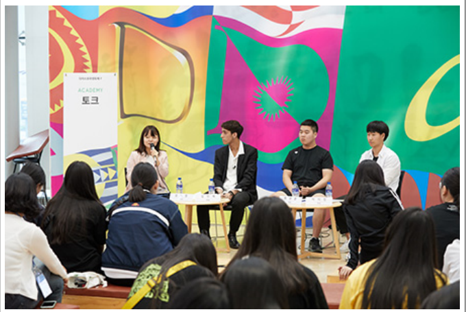
070 토크 콘서트 (2019. 5. 24. ~ 5. 28.)

본 프로그램은, 관객이 직접 참여하여 다양한 주제에 대해 토론하고, 전문가와 함께 의견을 나누는 기회를 제공합니다. <토크 콘서트>는 관객이 직접 참여하여 다양한 주제에 대해 토론하고, 전문가와 함께 의견을 나누는 기회를 제공합니다. 2013년 1월 본 프로그램은 총 9편의 <토크 콘서트>를 개최하여 관객의 참여를 유도하고 500여 명의 관객이 참여했습니다. <토크 콘서트>는 관객이 직접 참여하여 다양한 주제에 대해 토론하고, 전문가와 함께 의견을 나누는 기회를 제공합니다. 또한, 관객이 직접 참여하여 다양한 주제에 대해 토론하고, 전문가와 함께 의견을 나누는 기회를 제공합니다.