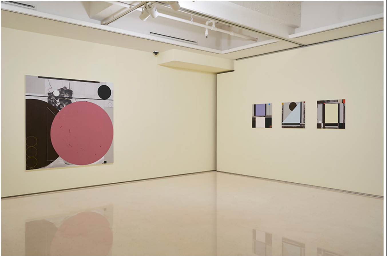
「The Tourist」 〇〇 〇〇, 〇〇〇〇71, 〇〇, 2020