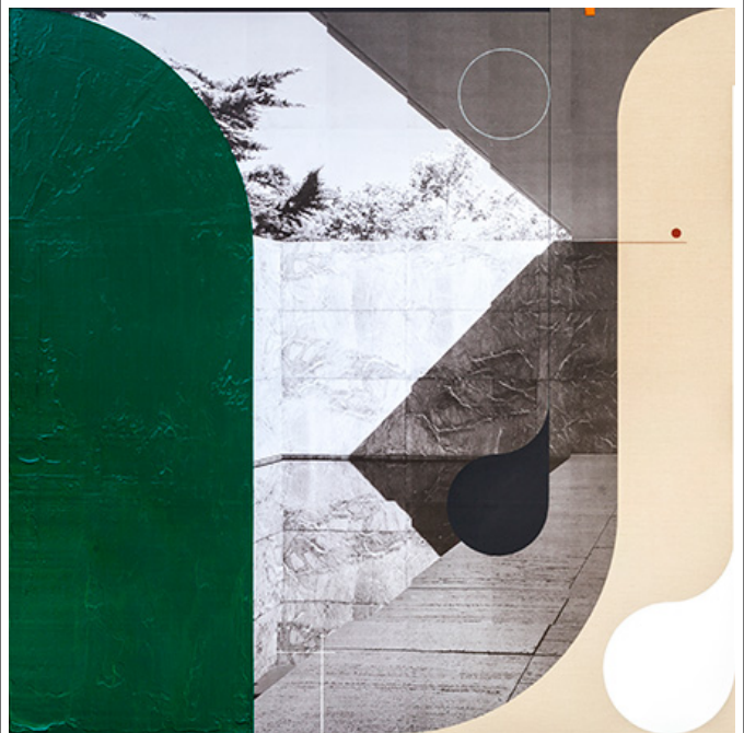
<Barcelona Pavilion no.2>, 〇〇〇〇 〇〇〇〇, 〇〇 〇〇〇, 160x160cm, 2020

Q. 〇〇〇 〇〇〇〇 〇〇〇 〇〇 〇〇〇 〇〇〇〇 〇〇 〇〇〇 〇〇 〇〇 〇〇.