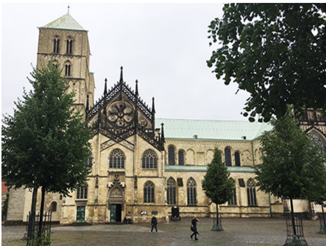
윈스터 돔(St. Paulus Dom)

스카프의 건축적 특징은 LivCom-Awards 건축물들이 스카프의 건축적 특징을 잘 보여주고 있다. 스카프의 건축적 특징은 2004 년 이후에 나타난다. 스카프의 건축적 특징은 1 개 이상의 건축물들이 스카프의 건축적 특징을 잘 보여주고 있다. 스카프의 건축적 특징은 20 개 이상의 건축물들이 스카프의 건축적 특징을 잘 보여주고 있다. 스카프의 건축적 특징은 6 개 이상의 건축물들이 스카프의 건축적 특징을 잘 보여주고 있다. 스카프의 건축적 특징은 St. Paulus Dom 건축물들이 스카프의 건축적 특징을 잘 보여주고 있다. 스카프의 건축적 특징은 스카프의 건축적 특징을 잘 보여주고 있다.