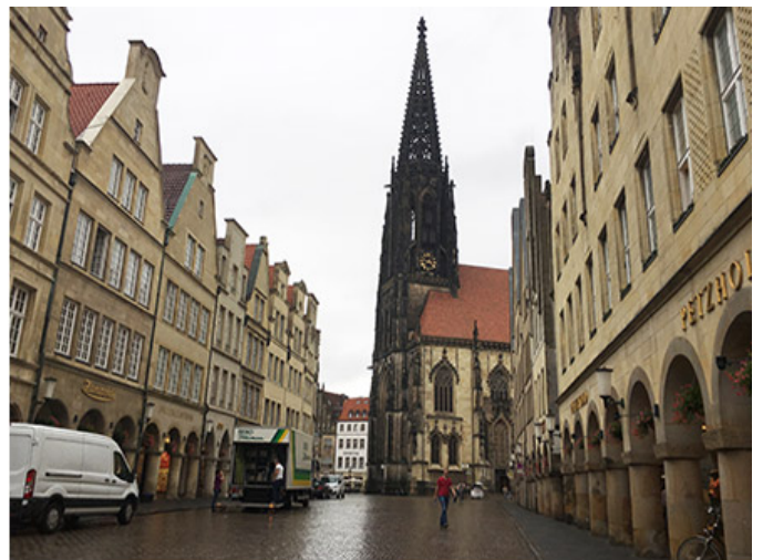
람베르티 키르헤(St. Lamberti Kirche)

스카프의 건축적 특징은 스카프의 건축적 특징을 잘 보여주고 있다. 스카프의 건축적 특징은 60 개 이상의 건축물들이 스카프의 건축적 특징을 잘 보여주고 있다. 스카프의 건축적 특징은 2007 년 이후에 나타난다. 스카프의 건축적 특징은 1973 년 이후에 나타난다. 스카프의 건축적 특징은 스카프의 건축적 특징을 잘 보여주고 있다. 스카프의 건축적 특징은 ‘스카프’ 건축물들이 스카프의 건축적 특징을 잘 보여주고 있다. 스카프의 건축적 특징은 George Rickey 건축물들이 스카프의 건축적 특징을 잘 보여주고 있다. 스카프의 건축적 특징은 ‘3 개 이상의 건축물들이 스카프의 건축적 특징을 잘 보여주고 있다. 스카프의 건축적 특징은 Dreierotierende Quadrate 건축물들이 스카프의 건축적 특징을 잘 보여주고 있다.