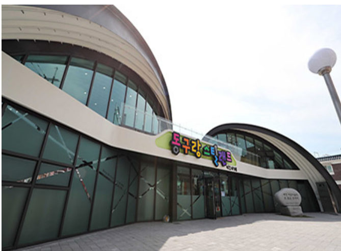
동구랑 스틸랜드(인천 동구 화수로69번길 17)

A. 송림주공 어린이집에서는 2010년 12월 24일(수) 오후 2시 30분부터 4시 30분까지 송림주공 어린이집에서 공연을 펼쳤다. 공연 내용은 송림주공 어린이집에서 준비한 어린이극 '송림주공 어린이극'이다. 송림주공 어린이집에서는 송림주공 어린이극을 통해 어린이들에게 올바른 인성과 생활습관을 길러주기 위하여 노력하고 있다. 송림주공 어린이집에서는 송림주공 어린이극을 통해 어린이들에게 올바른 인성과 생활습관을 길러주기 위하여 노력하고 있다. 송림주공 어린이집에서는 송림주공 어린이극을 통해 어린이들에게 올바른 인성과 생활습관을 길러주기 위하여 노력하고 있다.