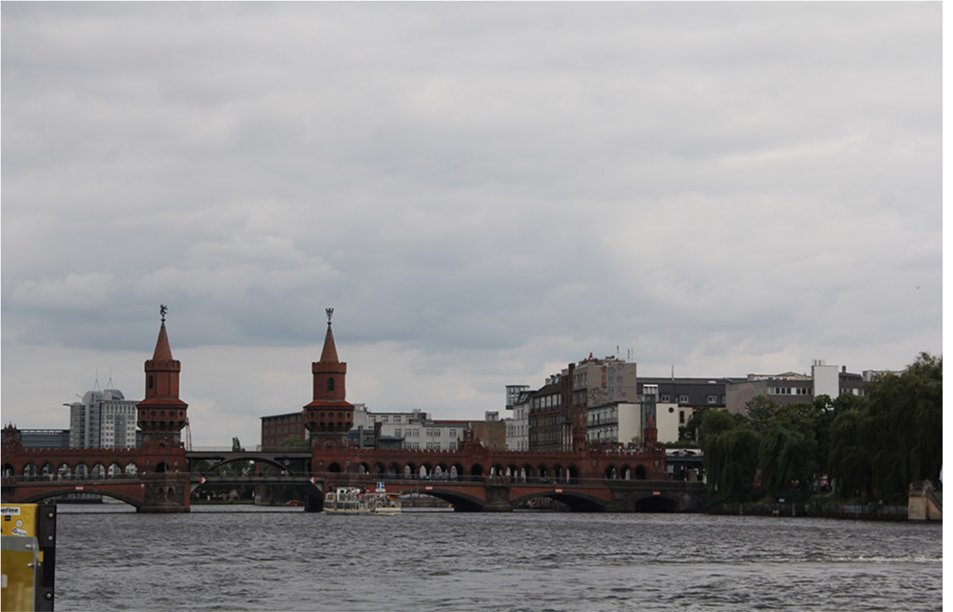
베를린 장벽 쪽에서 바라본 수프레 강변

이 사진은 베를린 장벽 쪽에서 바라본 수프레 강변을 보여줍니다. 수프레 강은 베를린의 중요한 강이며, 이 강을 따라 여러 개의 다리가 있습니다. 사진에는 두 개의 높은 탑이 보이며, 이는 수프레 다리(Spreebrücke)의 특징적인 구조물입니다. 배경에는 도시 건물과 나무들이 보이며, 하늘은 흐린 날씨를 나타냅니다.