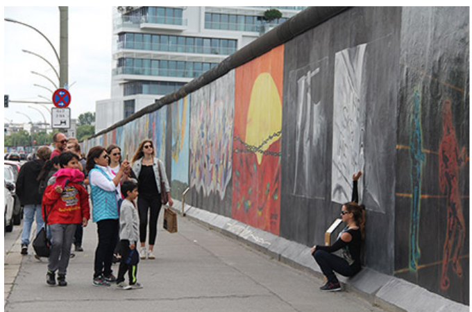
베를린 장벽에서 사진 찍는 사람들

000 00 00, 000 000 0000 00000 000000 0000 00 00000 000 000 000 0 0 000 0000. 000000 00 000 000 0000000 000 0 000? 0000 00000 00 00 000 00 00 0000 00, 00 0000 000 '00 00 0'00 000. 0000 00000 00000 000 00000 0000 00 0 000 000 0000. 00 0 000 00 0000 0000 0000 0000000 000 000 000000 00 00 000 000 000 00 000 0000. 0000 0000 0000 00 00 00000, 0 000 00 0 00 000 00000. 00 000 000 000 0 000 000 00 0000 0000 00 00 0000? 0000 00 000 00000? 000 0000 000000 0000 00 00 0000 000 00 00 000 000 000(Ostbahnhof)00 0000. 0000000 0000 40 00 000 000. 000000 000 00 00 0 00 000 000. 000 00.