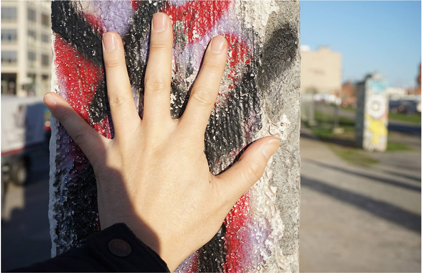
고작 한 뼘 두께인 베를린 장벽

이 벽은 정말 얇아. 두께가 겨우 한 뼘 정도밖에 안 돼. 하지만 이 벽이 있었기 때문에 독일은 오랫동안 분단 국가였어. 이 벽이 없었더라면 독일은 지금도 하나의 나라였을 거야. 이 벽이 있었기 때문에 독일인들은 서로를 미워하게 됐어. 이 벽이 있었기 때문에 독일인들은 서로를 믿지 않게 됐어. 이 벽이 있었기 때문에 독일인들은 서로를 사랑하지 않게 됐어. 이 벽이 있었기 때문에 독일인들은 서로를 이해하지 않게 됐어. 이 벽이 있었기 때문에 독일인들은 서로를 용서하지 않게 됐어. 이 벽이 있었기 때문에 독일인들은 서로를 용서받지 않게 됐어. 이 벽이 있었기 때문에 독일인들은 서로를 용서받지 않게 됐어.