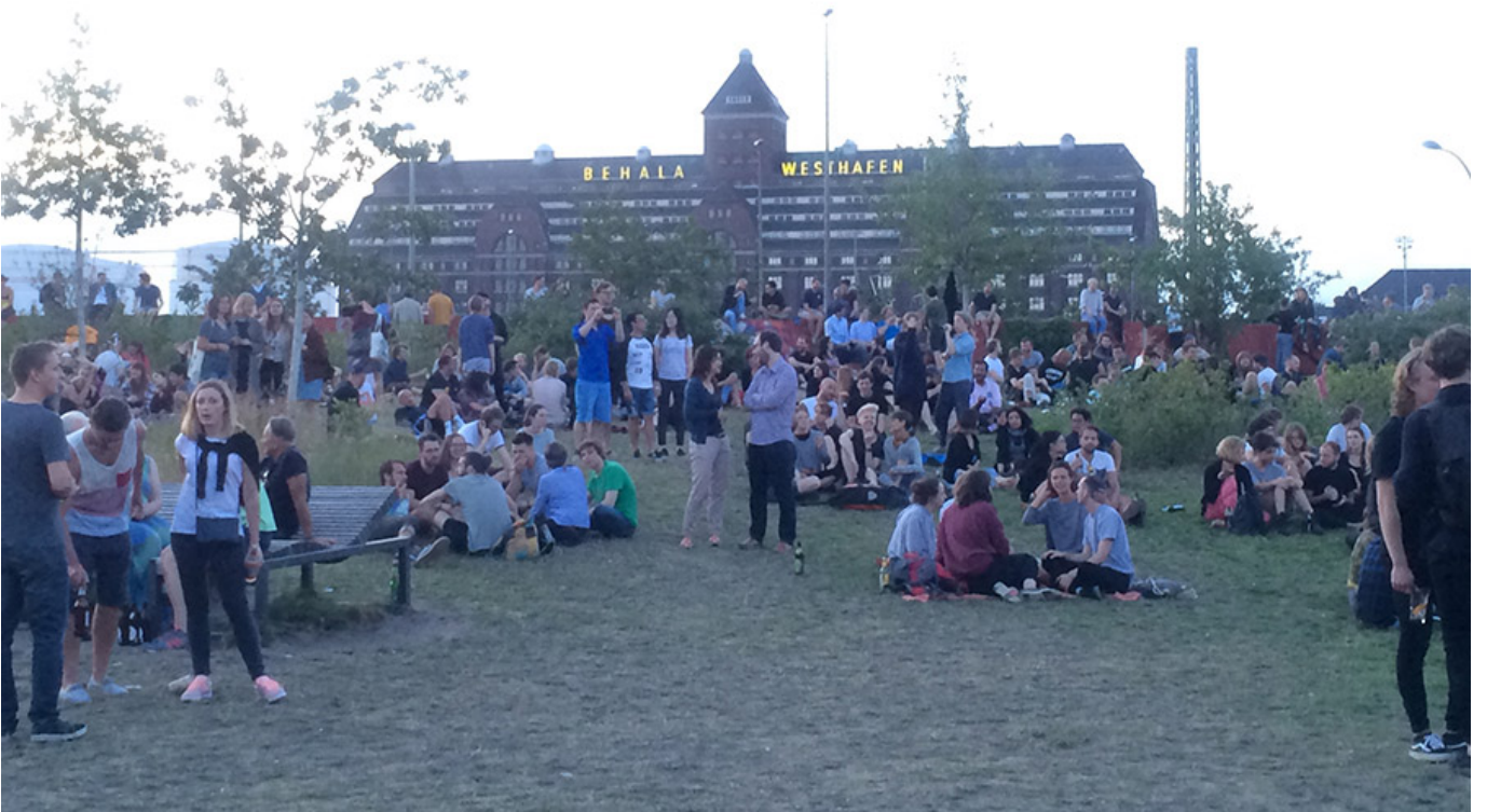
다양한 행사가 열리는 레지던시 앞 공원

공공 공간은 도시의 생명선입니다. 공공 공간을 통해 주민들은 서로를 만나고, 소통하며, 공동체 의식을 형성할 수 있습니다. 공공 공간을 조성하고 관리하는 것은 도시의 질을 높이고, 주민들의 삶의 질을 향상시키는 중요한 과제입니다.