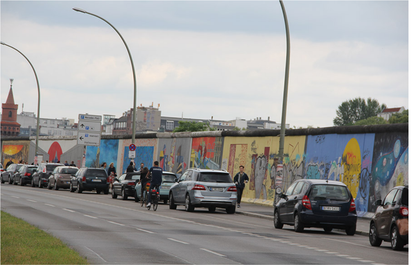
건너편에서 바라본 베를린 장벽

이 사진은 베를린 장벽의 한 구간을 보여줍니다. 벽은 양쪽에서 다양한 예술 작품과 그래피티로 장식되어 있습니다. 도로에는 차량과 자전거가 보이며, 배경에는 베를린의 도시 풍경이 담겨 있습니다.