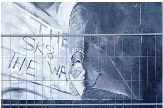
장벽에 그려진 그림 중

000 00 000 0000 0 00000. 0 000 00? 000 0000 00. 00 00 000 000 00 0 000 0000 000000. 000 0000 000 '000 000 000(East Side Gallery)'00 000. 0000 00 0001.3km 000, 0000 00 0 00 0000. 000 0 00000 000 000(Spre.R) 00 00 00000. 000 00 00 000 000 0 00 0 000 000 00000.