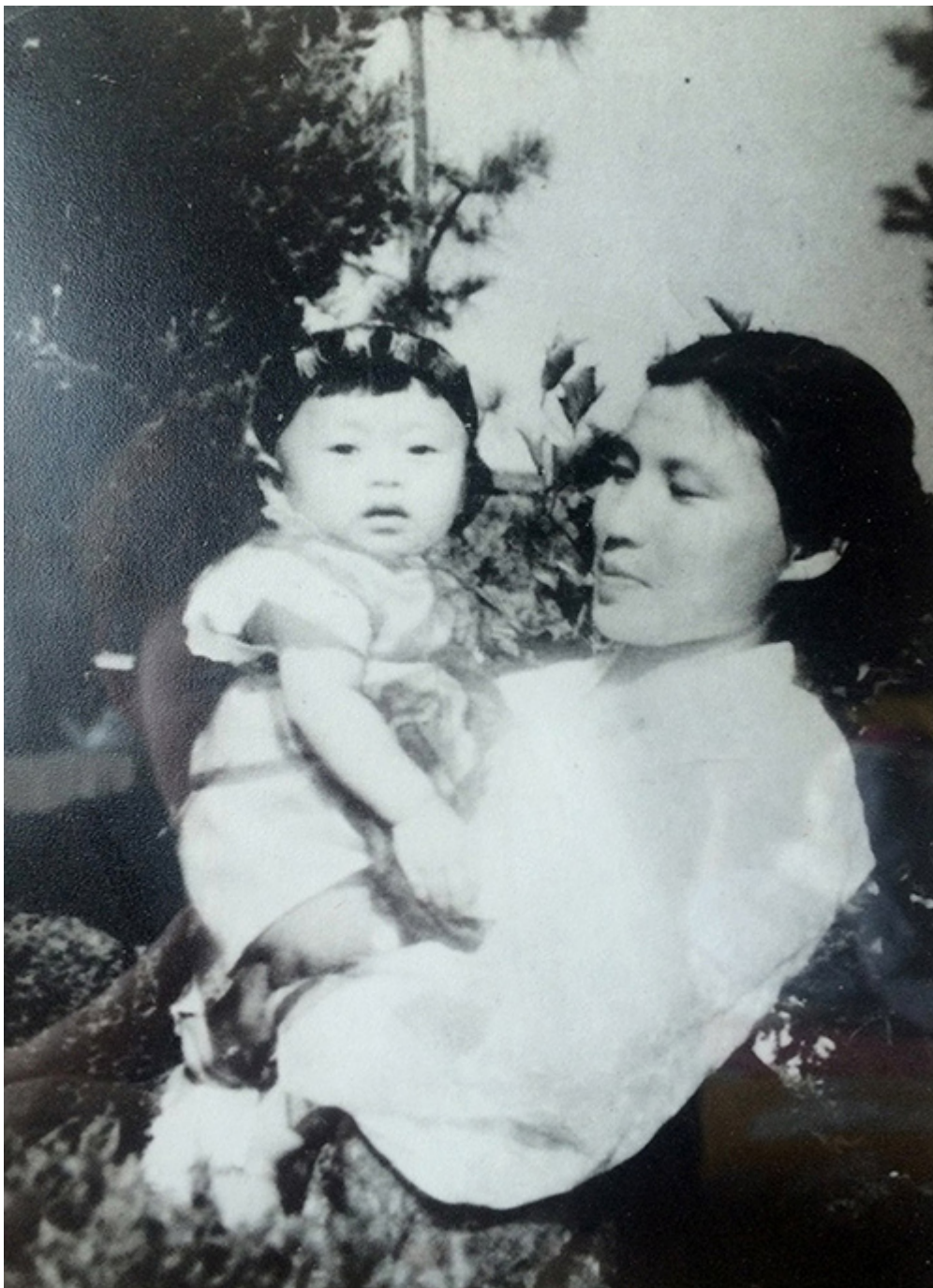
20대 시절 외할머니

ZK/U 000000 00000 000000 000 00 0 0000 000 000000 000 000 000 00000.