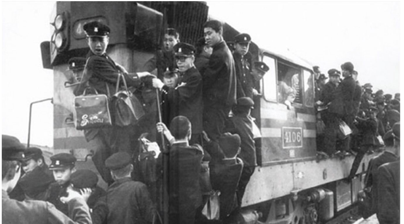
1960년대 학생으로 붐비던 경인선 통학열차 모습

이 사진은 1960년대 경인선 통학열차 모습이다. 열차에는 많은 학생들이 타고 있다. 열차에는 많은 학생들이 타고 있다. 열차에는 많은 학생들이 타고 있다. 열차에는 많은 학생들이 타고 있다.