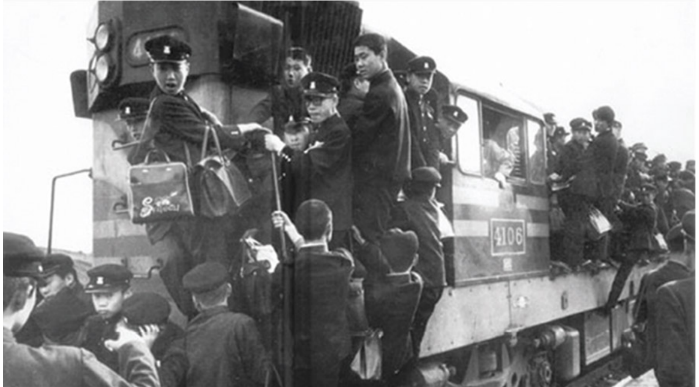
1960년대 학생으로 붐비던 경인선 통학열차 모습

이 당시에는 학생들이 학교를 갈 때 버스를 이용하지 않았고, 대부분이 대중교통을 이용했다. 특히, 1960년대에는 학생들이 학교를 갈 때 버스를 이용하지 않았고, 대부분이 대중교통을 이용했다.