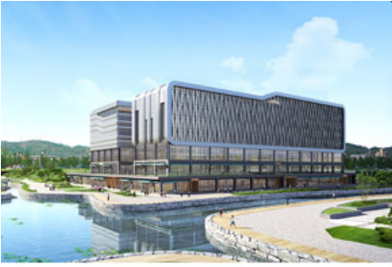
두손건설 지젤M청라 조감도