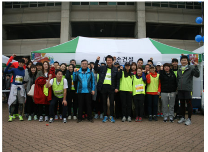
마라톤 대회에서 직원들과 함께

Q. □□□□□. □□□ □□ □□□□□ □□□□□. □□□ □□ □□□□□□□.