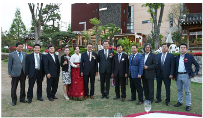
와인아카데미 5기 회장 취임식

Q. 000 000 000 000 000 00 000 000 00 0000 00 0 00000. 0000 00000 000 000 0000000.