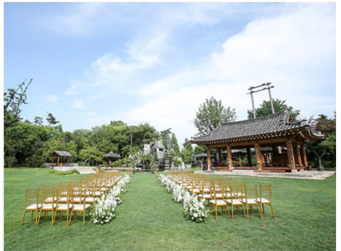
우리가본집 외부 마당