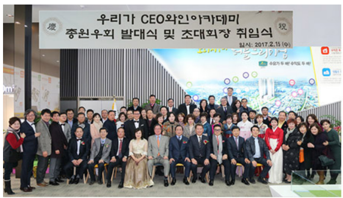
우리가 와인아카데미 총 원우회 발대식

A. 000 000000000 500 000000000. 00 000 000000, 000 000 00 0 000 00 0000 000000. 000 00 00000 00000 00 000 000 0000000 000 00 0000 00 000 00 000000, 000 00 0 00 '00' 00000 00000000. 000 000 00000 0 0 0 00 0 00 00 00000 00000. 000 00 00 000 00000 00 000 000 000 00 00 000 00000 00000 0000000 0000 0000000 00000.