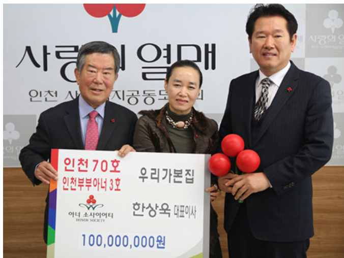
인천 부부 아너 3호 가입

A. 자녀 교육에 대한 고민은 다양합니다. 첫째, 교육 비용 부담입니다. 대학 교육부터 시작해서, 사교육 비용, 생활비 등 다양한 지출이 필요합니다. 둘째, 자녀의 진로 고민입니다. 자녀가 어떤 분야에서 일할 것인지, 어떻게 준비할 것인지에 대해 고민하고 있습니다. 셋째, 부모의 노후 준비입니다. 자녀 교육이 끝났을 때 부모의 생활비를 어떻게 충당할 것인지에 대해 걱정하고 있습니다. 마지막으로, 자녀의 인성 교육을 어떻게 할 것인지에 대해 고민하고 있습니다.