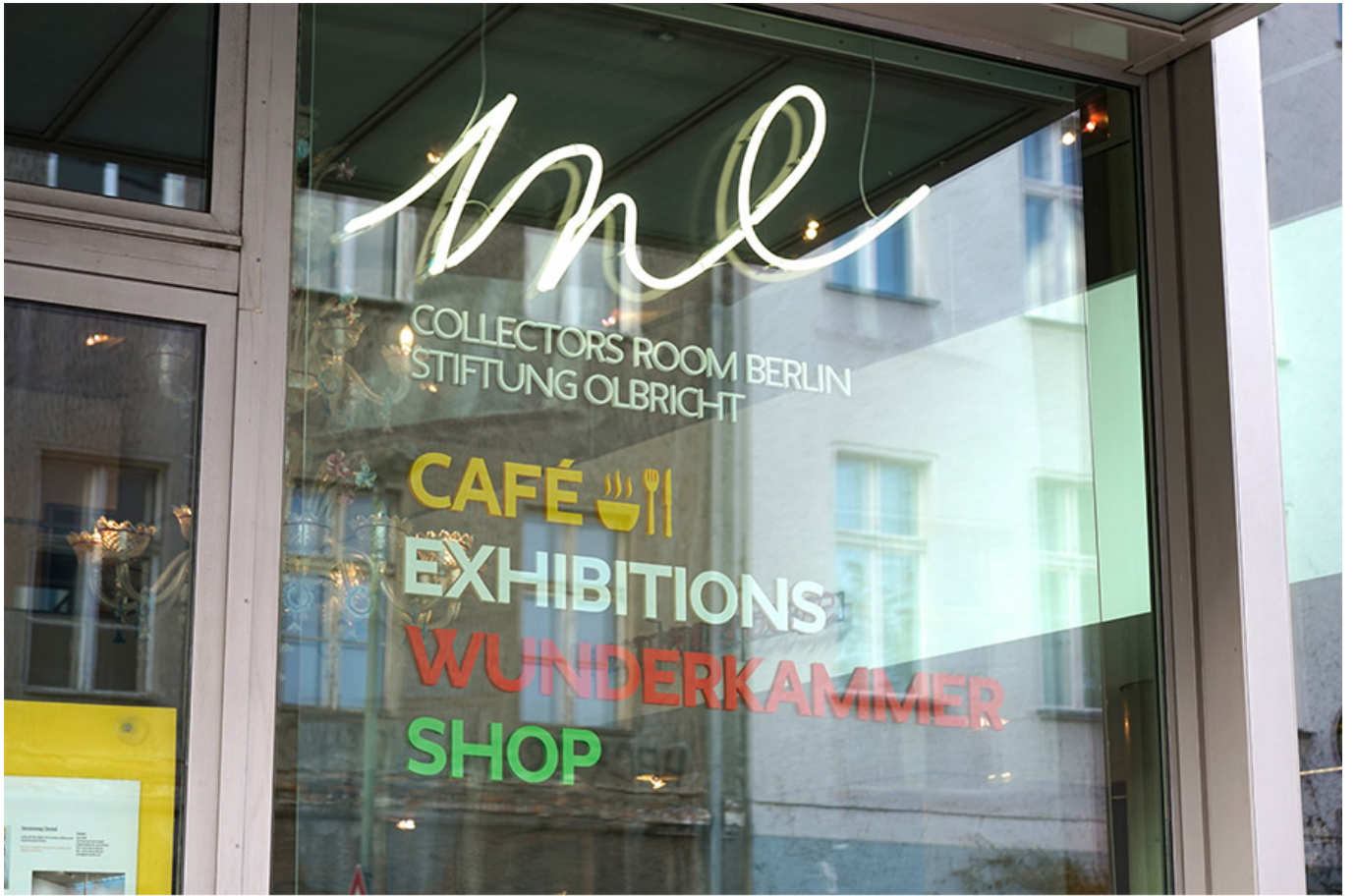
미 컬렉터스 룸 입구