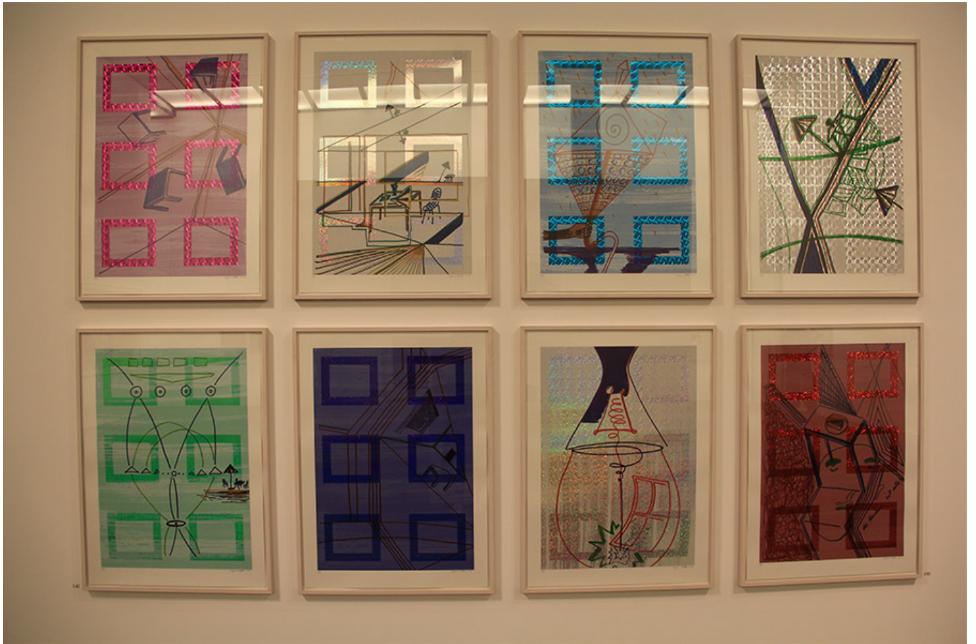
냉장고 안을 비춘 조명에 영감을 받아 만든 작품: Der Kuchen ist alle?, 2006

“이 작품은 냉장고 안을 비춘 조명에 영감을 받아 만든 작품이다. 이 작품은, 냉장고 안을 비춘 조명에 영감을 받아 만든 작품이다! 이 작품은 냉장고 안을 비춘 조명에 영감을 받아 만든 작품이다. 이 작품은, 냉장고 안을 비춘 조명에 영감을 받아 만든 작품이다. 이 작품은, 170cm x 170cm 크기의 작품이다, 이 작품은, 냉장고 안을 비춘 조명에 영감을 받아 만든 작품이다. 이 작품은, 냉장고 안을 비춘 조명에 영감을 받아 만든 작품이다.”