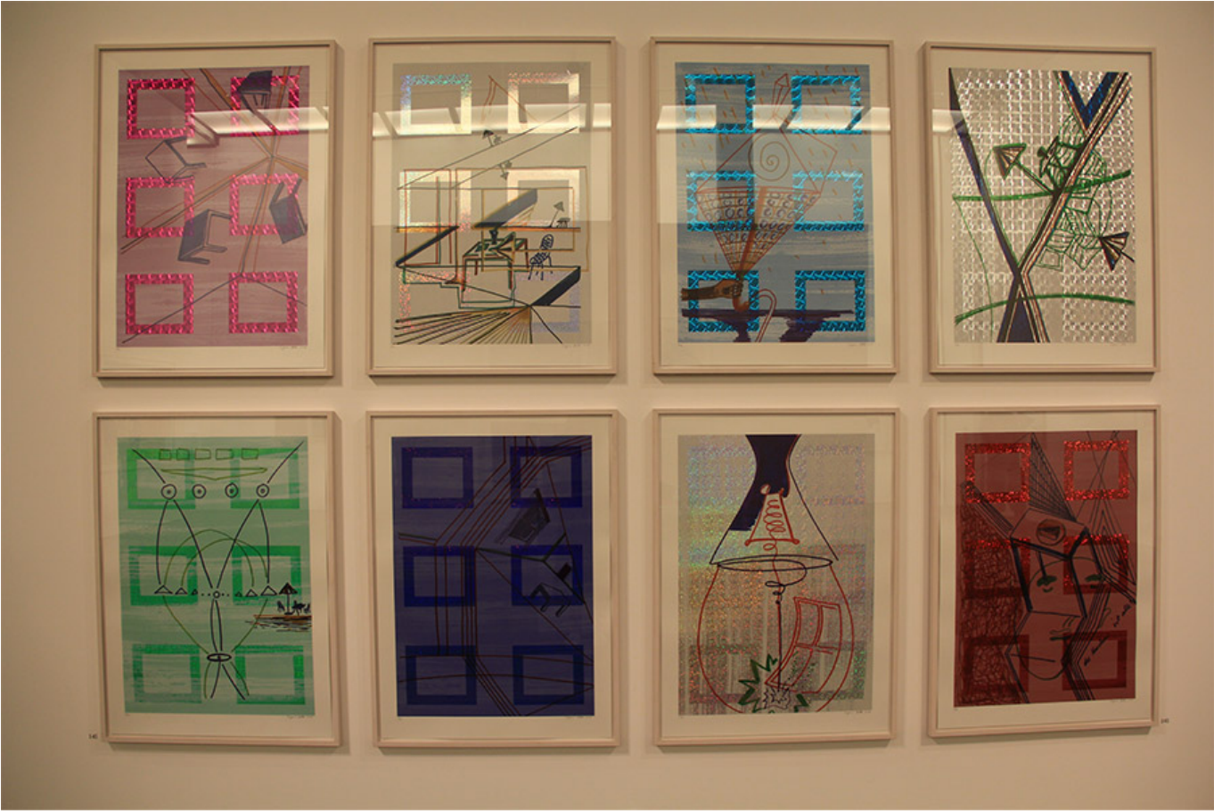
냉장고 안을 비춘 조명에 영감을 받아 만든 작품: Der Kuchen ist alle?, 2006

“이 작품은 냉장고 안을 비춘 조명에 영감을 받아 만든 작품이다. 이 작품은, 냉장고 안에서 보이는 다양한 물체의 형태와 색상을 추상적으로 표현한 것이다. 이 작품은 170cm x 170cm 크기의 캔버스에 그려졌으며, 다양한 색상을 사용하여 시각적으로 풍부한 효과를 창출했다. 이 작품은 냉장고 안에서 보이는 다양한 물체의 형태와 색상을 추상적으로 표현한 것이다. 이 작품은 170cm x 170cm 크기의 캔버스에 그려졌으며, 다양한 색상을 사용하여 시각적으로 풍부한 효과를 창출했다.”