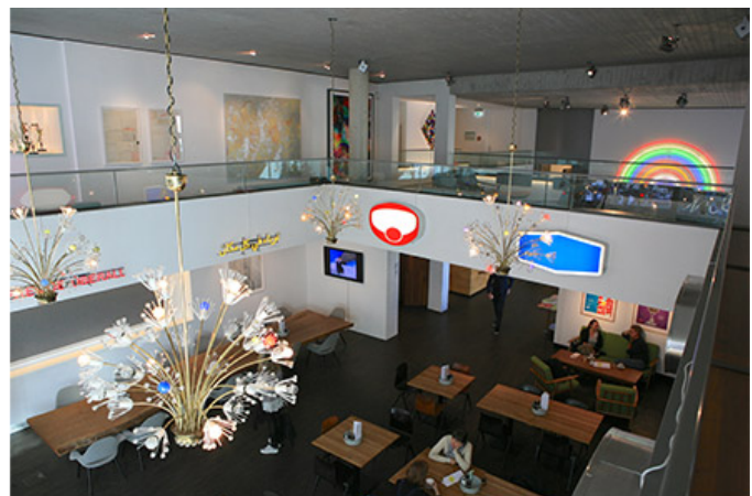
미 컬렉터스 룸 카페