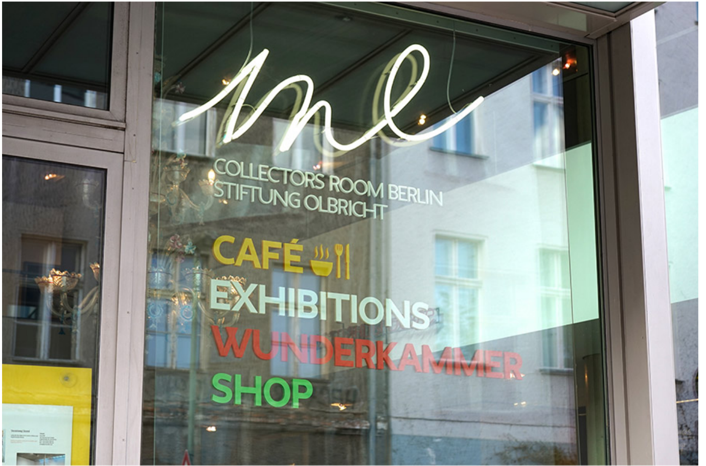
미 컬렉터스 룸 입구