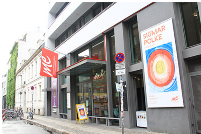
빨간 깃발이 펄럭이는 미 컬렉터스 룸

0000 0000 00, 0000 00000 00(Mitte) 0000 00000 000. 00000 0 000000 00 0 0 000. 00 0000 0000 00 00 0000 0000 00 00. 00 00 0000 00 00 00000 00 00, 0000 ‘Me’00 00 00 0000 000000. 0000 00000 00000 0000 00 “0000 0000 00 0000?” 00 00 00000. 0000 00000 ‘Me’00 00 0 00 00 ‘00000 0 00 0 00000000000(collectors room berlin stiftung olbricht)’00 00 00 0 00 00. 0 00000(Me Collectors)00? ‘0(Me)’00 ‘0’0 0000? 0 0 00 0...? 0000 00 00000 00000...? 00 0000000 00000 0000 0000 0000 0000 0000 0000 00 00000 00. 00000 00 10 00 0000000 0000 00000. 000000 00000 00 00 0000 0 00. 0000 00000 0000. 0000000 0000 00 0000 00000. 00 0000 0000000 00 0000 0 00000 00 0000 00000 00 00. 00 0000 0000 0000 0000 00000 00000.