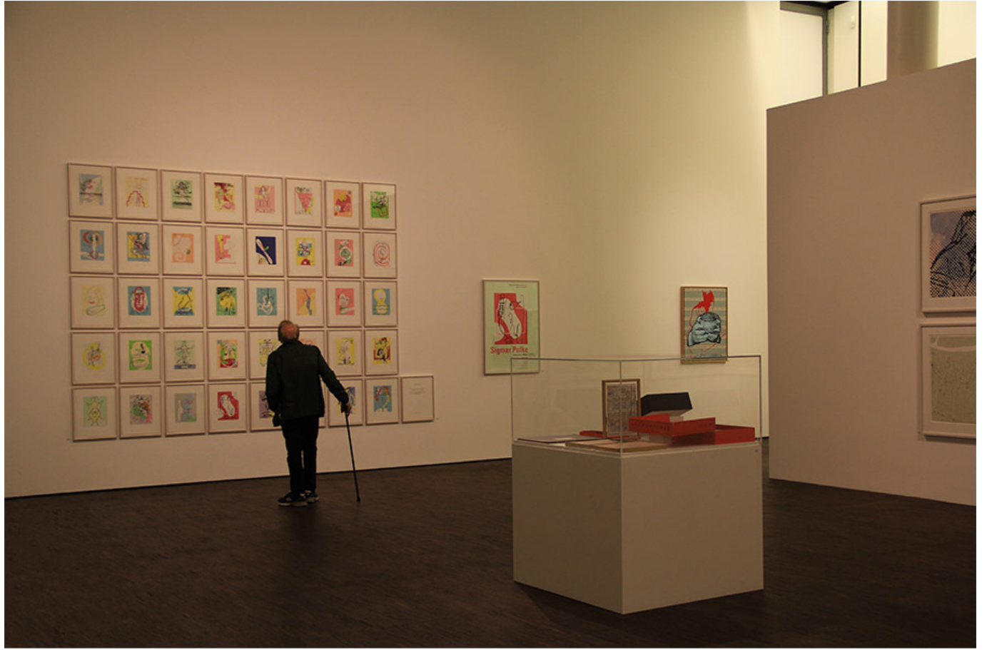
시그마 폴케 전시전경

“시그마 폴케(Sigma Polke)는 다양한 주제와 스타일을 보여줍니다. 그의 작품은 종종 사회적 비판과 정치적 메시지를 담고 있습니다. 그는 다양한 매체와 기법을 사용하여 자신의 아이디어를 표현했습니다. 그의 작품은 종종 대중적인 이미지와 상징을 사용하며, 이는 그의 작품의 중요한 특징입니다. 그의 작품은 종종 대중적인 이미지와 상징을 사용하며, 이는 그의 작품의 중요한 특징입니다. 그의 작품은 종종 대중적인 이미지와 상징을 사용하며, 이는 그의 작품의 중요한 특징입니다.”