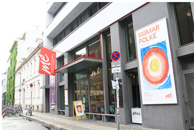
빨간 깃발이 펄럭이는 미 컬렉터스 룸

0000 000 00, 0000 0000 00(Mitte) 0000 0000 000. 00000 0 000000 00 0 0 000. 00 0000 0000 00 00 0000 0000 00 00. 00 00 0000 00 00 00000 00 00, 0000 ‘Me’00 00 00 0000 000000. 0000 00000 00000 0000 00 “0000 0000 00 0000?” 00 00 00000. 0000 00000 ‘Me’00 00 0 00 00 ‘00000 0 00 0 00000000000(collectors room berlin stiftung olbricht)’00 00 00 0 00 00. 0 00000(Me Collectors)00? ‘0(Me)’00 ‘0’0 0000? 0 0 00 0...? 0000 00 00000 00000...? 00 000000 00000 0000 0000 0000 0000 0000 0000 00 00000 00. 00000 00 10 00 000000 0000 00000. 00000 00000 00 00 0000 0 00. 0000 00000 0000. 0000000 0000 00 0000 00000. 00 0000 0000000 00 0000 0 00000 00 0000 00000 00 00. 00 0000 0000 0000 0000 00000 00000.