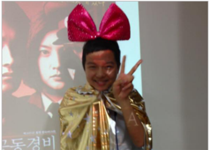
〈별별시네마〉, 〈모씨네〉

○○○○○○○○ <○○(○○)○○○>○ <○○○○ ○○>, ○○○○○○○○ <○○○○>, ○○○○○○○○ <○○○○ ○>, ○○○○○○○○ <○○○○○○○ ○○> ○ ○○ ○○○ ○○ ○○○ ○○○○○ ○○ 10○ ○○ ○○○○○ ○○ ○○○ ○○○○ ○○○○ ○○○○○ ○○○○ ○○○○○. ○○○○ ○○○○ ○○○○ ○○○○○ ○○ ○ ○ ○○○○ ○○○○ ○○○ <○○○○>○ <○○○○○○○ ○○>, ○○○○○○ ○○○○ ○ ○○○○ ○○○○○○ ○○○○○○ ○○○○○○ ○○○○ ○○○○ <○○(○○)○○○>, ○○○○○○ ○○○○ ○○○○ ○○ ○○○○ ○○○○○○ ○○ ○○○○○ ○ <○○○○ ○○>○ <○○○○>○○. ○○ ○○○○ ○○○○ ○○ ○○○○ ○○○○ ○○○○ ○○○○ ○○○○ ○○ ○○○○ ○○○○. ○○○○○○ ○○○○○○ ○○○○○○ ○○○○ ○○○, ○○○○ ○○ ○○○○ ○○ ○○ ○○○○○○ ○○○○○○ ○○○○○○ ○ ○○○○ ○○○○○○ ○○○○○○ ○○○○ ○○○○○○○.