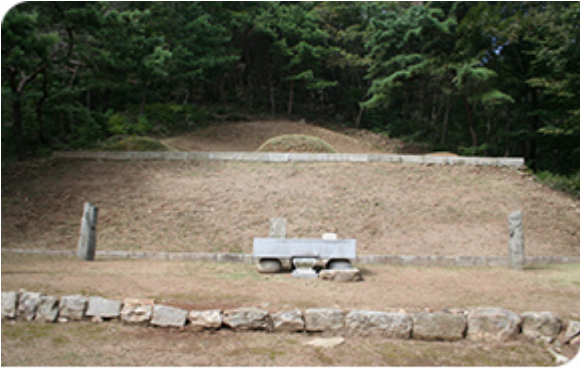
고려 고종 흥릉 (강화읍 국화리)

2017년 1월 10일부터 12월 31일까지, 2018년 1월 10일부터 12월 31일까지 (총 2년) 1100명 이상을 대상으로 강화읍 국화리 흥릉 일대를 <2017년 1100명 이상을 대상으로 하는 일일 탐방>, 2018년 1월 10일부터 12월 31일까지 6월 2013년 10월 10일부터 12월 31일까지 10/10 일일 탐방 일일 탐방 <2017년 1100명 이상을 대상으로 하는 일일 탐방>이다.