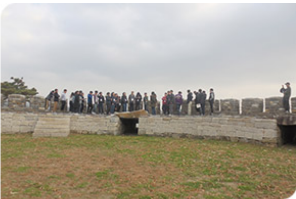
청소년 강화역사 바로알기

2017년 1월 10일부터 12월 31일까지, 2018년 1월 10일부터 12월 31일까지 (총 2년) 1100명 이상을 대상으로 강화읍 국화리 흥릉 일대를 <2017년 1100명 이상을 대상으로 하는 일일 탐방>, 2018년 1월 10일부터 12월 31일까지 6월 2013년 10월 10일부터 12월 31일까지 10/10 일일 탐방 일일 탐방 <2017년 1100명 이상을 대상으로 하는 일일 탐방>이다.