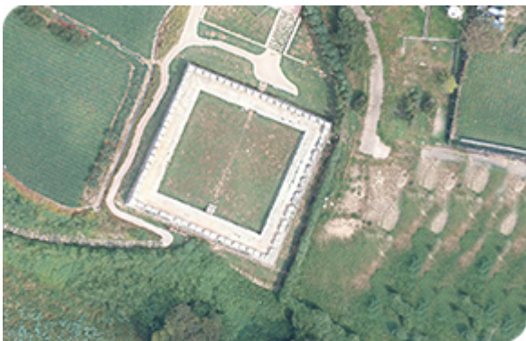
후애둔대 항공촬영사진 (2016)

<국립한양대학교 2017년 3월 1일> 2017년 3월 1일. 2017년 3월 1일 국립한양대학교 2017년 3월 1일.