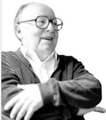
20세기 중남미 문학에서 '초단편소설[超短篇小説]' 분야의 1인자 아우구스토 몬테로소(Augusto Monterroso)

“깨어났을 때, 그 공룡은 여전히 거기 있었다.” 아우구스토 몬테로소의 작품 <그 공룡>의 전문이다. 전세계적 평가를 얻은 초단편소설의 고전이다. 문학에 더 이상 새로운 것은 없다고 생각하는 작가는 간결과 압축, 풍자와 아이러니, 역설을 사용해 가장 짧은 언어로 가장 독특한 문학성을 성취했다. 20세기 중남미 문학을 대표하는 그의 두번째作品集 《검은 양과 또 다른 우화들》은 수록 작품 제목만으로도 “왜 그인가?”에 대해 충분히 대답한다.