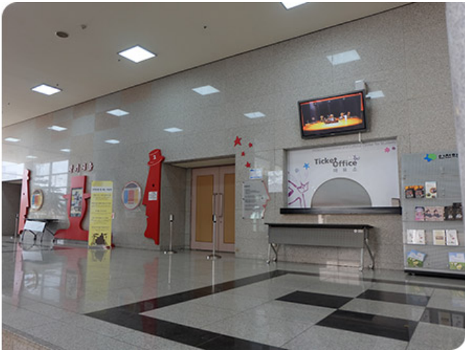
(좌 - 이천교육문화센터 건물 / 우 - 이천교육문화센터 2층 로비)