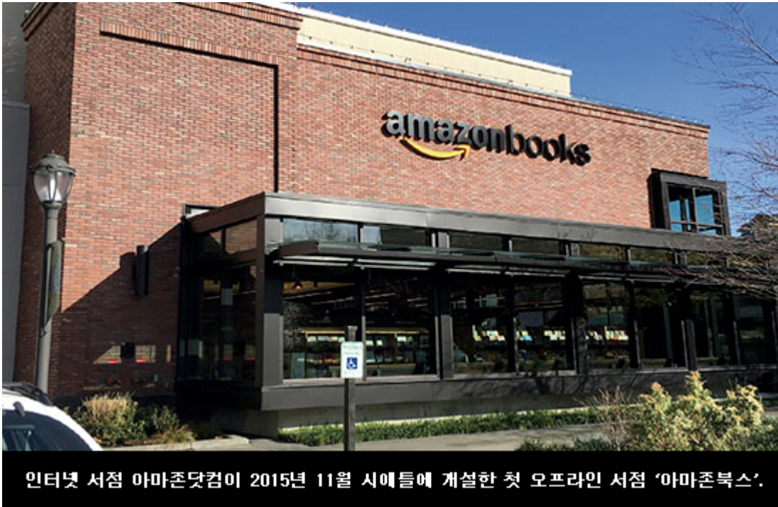
인터넷 서점 아마존닷컴이 2015년 11월 시애틀에 개설한 첫 오프라인 서점 '아마존북스'.

이러한 변화는 소비자 행동의 변화와 밀접한 관련이 있다. 소비자들은 이제 더 이상 오프라인에서만 상품을 구매하지 않는다. 오프라인과 온라인을 넘나들며 상품을 구매하는 '오프라인에서 온라인으로 구매'하는 소비자가 늘고 있다. 이러한 소비 행태의 변화는 기업들에게 새로운 기회를 제공한다. 기업들은 이제 오프라인과 온라인을 통합하여 상품을 판매할 수 있다. 이는 소비자에게 더 나은 구매 경험을 제공하고, 기업에게 더 높은 매출을 창출할 수 있는 기회를 제공한다.