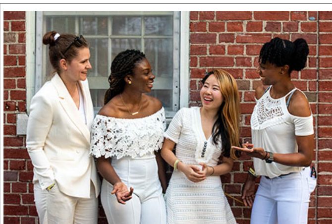
... .. (...: ... ..)