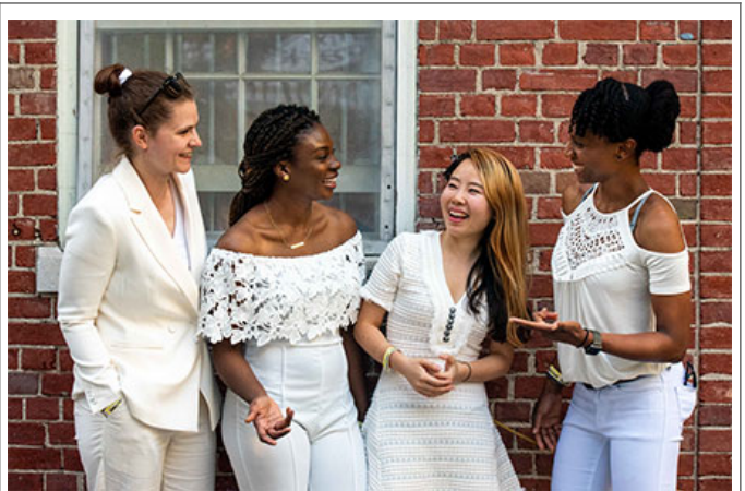
... .. (...: ... ..)