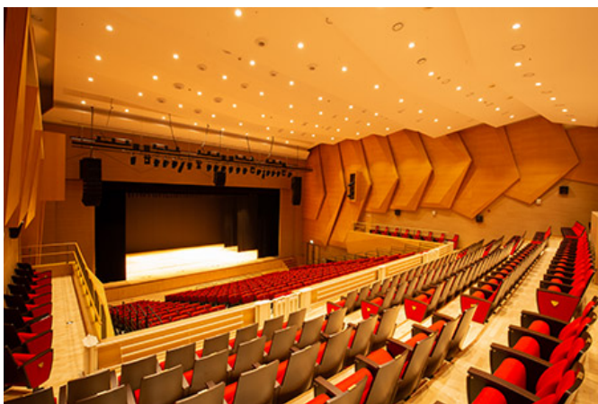
콘서트홀 (면적: 10,000㎡)