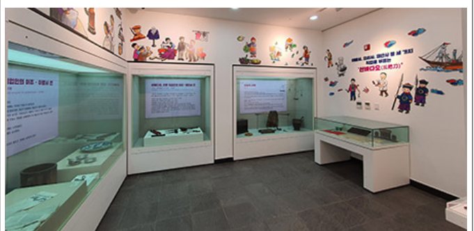
국립민속박물관 <민속문화 전시 140주년 기념>