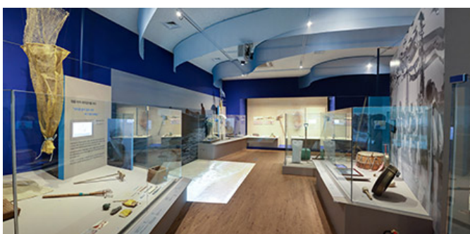
국립민속박물관 <민속문화 전시 공간 소개>

국립민속박물관은 1883년 설립된 대한제국 최초의 민속박물관이다. 민속문화의 보존·연구·전시·교육을 목적으로 설립된 이 박물관은 민속문화의 전승과 확산을 위한 다양한 프로그램을 운영하고 있다. 주요 전시 분야로는 민속문화(민속문화), 민속음악(민속음악), 민속춤(민속춤), 민속놀이(민속놀이), 민속공예(민속공예), 민속의류(민속의류), 민속식품(민속식품) 등이 있다. 9월 1일부터 9월 30일까지 진행되는 '2023년 가을 민속문화 축제'는 민속문화의 아름다움을 느낄 수 있는 좋은 기회이다.