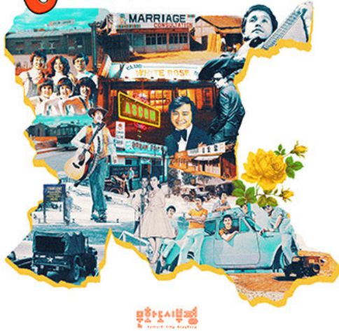
Re:Ascom (RE:ASCOM) CD