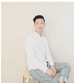
작가(작가, Hyeongyu Oh)

이 프로젝트는 다양한 미디어와 기술을 활용하여 관객의 시각과 청각을 자극하는 다감각적인 환경을 조성합니다. 또한, 관객의 참여를 유도하여 작품의 의미를 완성하는 데 기여합니다. 이 프로젝트는 432Hz의 소리를 통해 긍정적인 에너지를 전달하고, 관객의 마음을 편안하게 해주는 것을 목표로 합니다. 이 프로젝트는 서울 서초구 동대문로에 위치한 갤러리에서 진행되며, 2021년 6월 9일부터 9월 9일까지 운영됩니다.