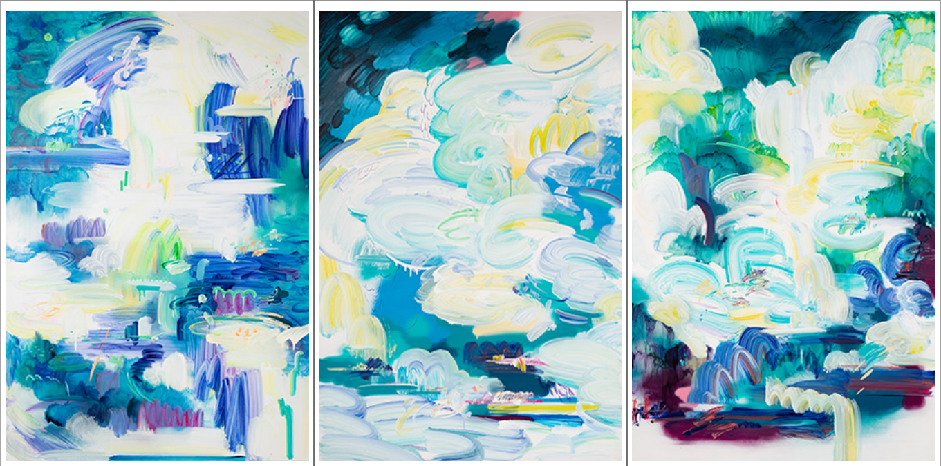
<臺灣 1> 1~3, 193.9x130.3cm, acrylic on canvas, 2021

「臺灣」主題不限於風景、人物、動物、植物等，亦可為抽象、具象、混合等。作品須為原創，且不得有侵害他人權益之虞。主辦單位保有審核權，並得對作品進行複製、出版、展覽等權利。10 月 10 日前繳交，逾期恕不受理。主辦單位得對得獎作品進行複製、出版、展覽等權利。