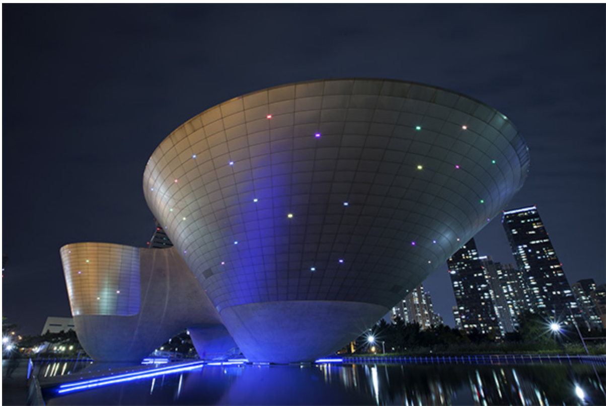
圖 為 某 建 築 物 的 夜 間 照 片

本 報 告 是 我 們 對 2021 年 度 研 究 報 告 的 總 結 與 回 顧。 在 這 個 充 滿 挑 戰 與 機 遇 的 年 度 裏， 我 們 堅 持 以 人 為 本， 以 實 效 為 導 向， 深 入 開 展 各 項 研 究 工 作， 不 斷 提 高 自 身 的 研 究 水 平 與 實 踐 能 力。 本 報 告 從 宏 觀 經 濟、 社 會 發 展、 文 化 創 造 等 方 面， 分 析 了 我 國 經 濟 的 運 行 狀 況 與 趨 勢， 指 出 了 當 前 經 濟 發 展 中 存 在 的 問 題 與 難 點， 並 提 出 了 有 關 的 政 策 建 議。 希 望 能 為 各 界 有 關 人 士 提 供 參 考 與 借 鑑。