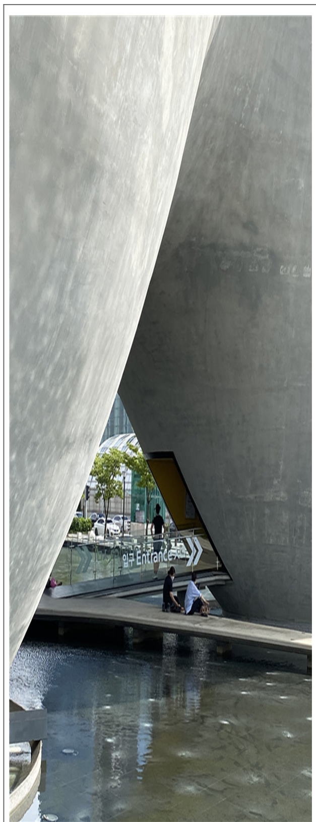
현대미술관 전시 공간

이 공간은 3000㎡의 면적을 차지하며, 300여명의 관람객이 200여종의 작품을 감상할 수 있다. 이 공간은 현대 미술의 흐름을 소개하고, 다양한 문화 프로그램을 선보일 예정이다. 또한, 이 공간은 지역 주민과 관광객 모두에게 친숙한 공간으로 조성될 예정이다.